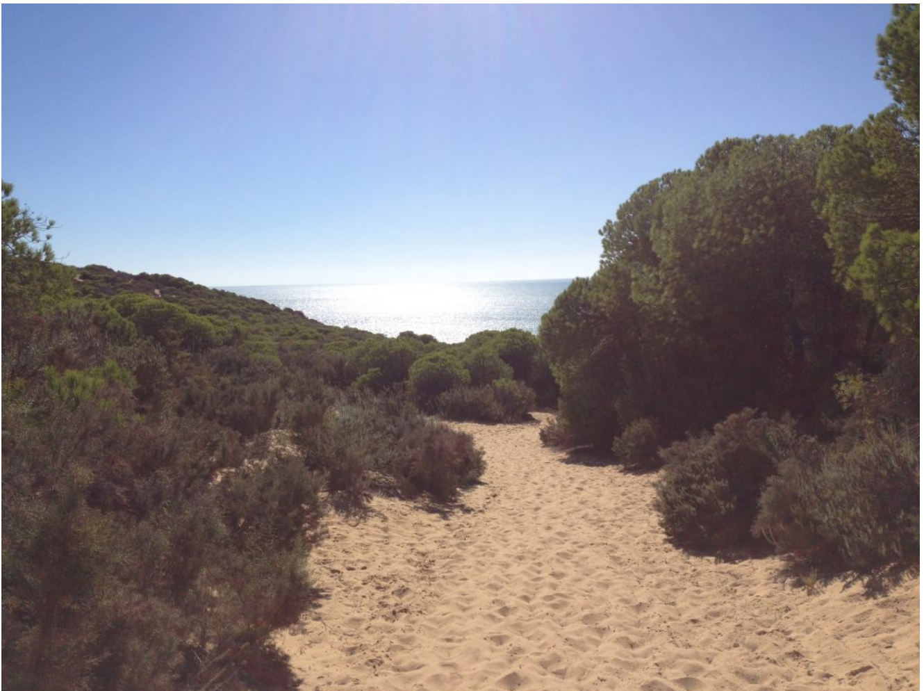
Llegando al mar Atlántico

Niveles uno y dos- 19 de junio – La excursión al Barranco del Asperillo es una excursión de senderismo de costa que une el caminar por tierra, arena y el descenso al barranco, que hay que realizar con cuerdas y aunque es sencillo, hay que estar mínimamente en forma para realizarlo. El nivel uno tiene 9 km y 149 metros DAP y el nivel dos 15 km y 177 metros DAP. Pondremos un bus desde Sevilla y se puede llegar también en coches particulares.