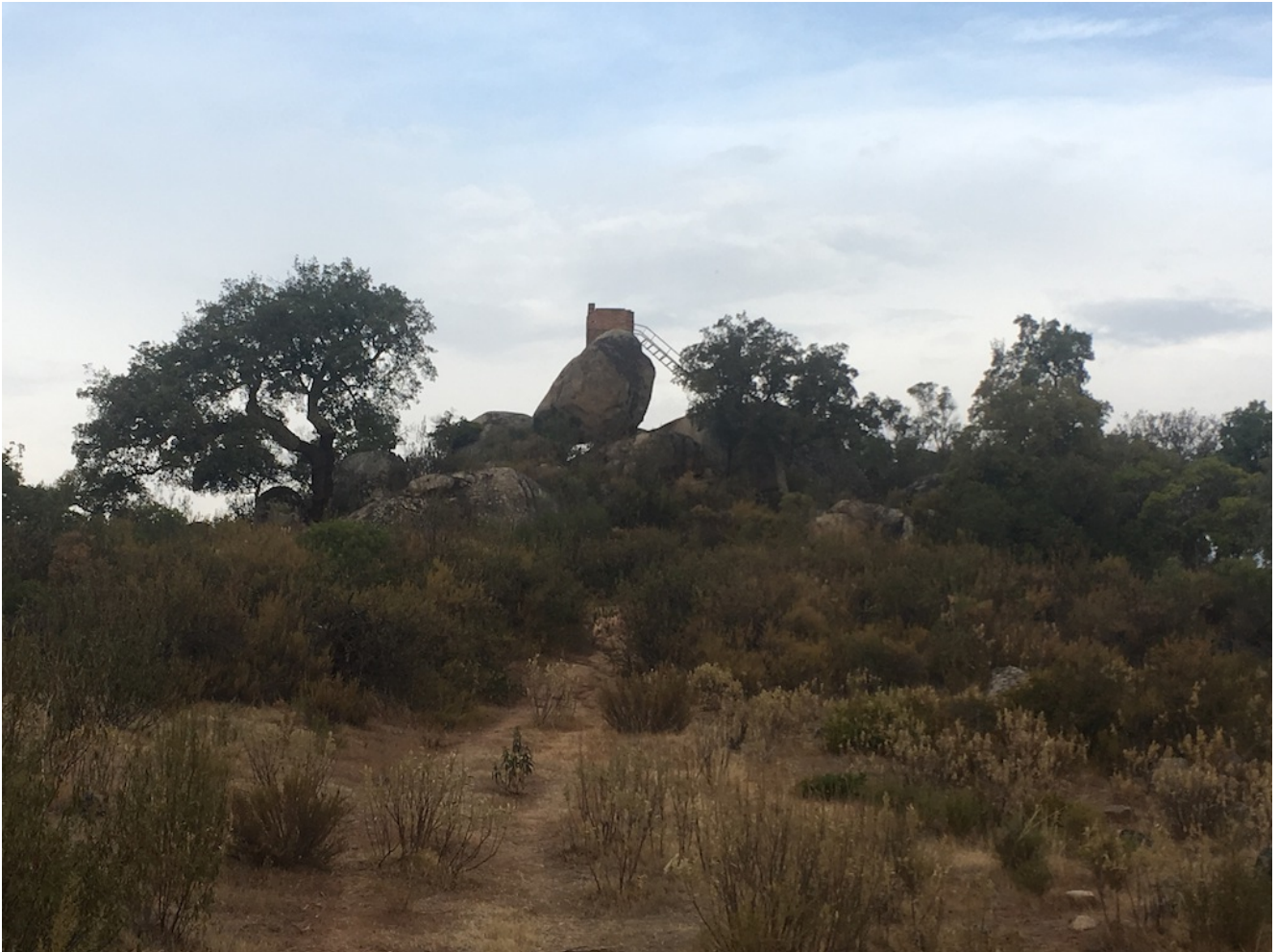
Mirador del Berrocal

El Berrocal es una finca situada en la localidad de Almadén de la Plata. Es un recorrido exigente para ser un nivel uno y marca el máximo de inclinación que tenemos en este nivel. Destaca por sus manadas de ciervos y su preciosa berrea que se puede escuchar en los amaneceres del mes de otoño.