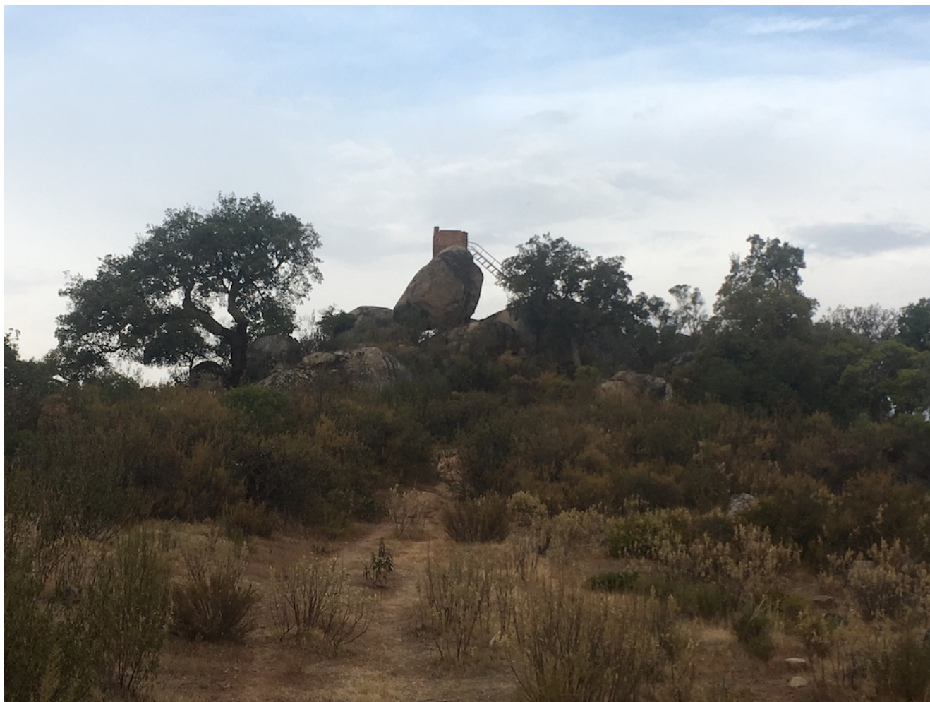
Mirador del Berrocal

El Berrocal es una finca situada en la localidad de Almadén de la Plata. Es un recorrido exigente para ser un nivel uno y marca el máximo de inclinación que tenemos en este nivel. Destaca por sus manadas de ciervos y su preciosa berrea que se puede escuchar en los amaneceres del mes de otoño.