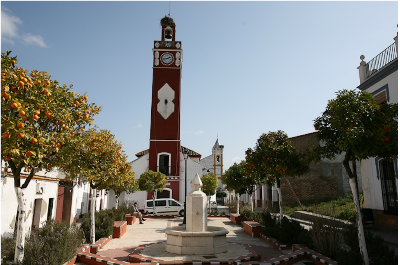
Almadén de la Plata

El precio de esta excursión es de 30€ con transporte y 20€ sin transporte (socios 10€ menos) Para venir con nosotros tienes que realizar el proceso de inscripción para ello tienes que hacer el pago por transferencia en nuestra cuenta del Banco Sabadell ES84 0081 7302 8200 0146 1452 y envíanos el resguardo al mail ( info@senderismosevilla.net ) con tu nombre y apellidos, número de DNI, fecha de nacimiento y un móvil de contacto.