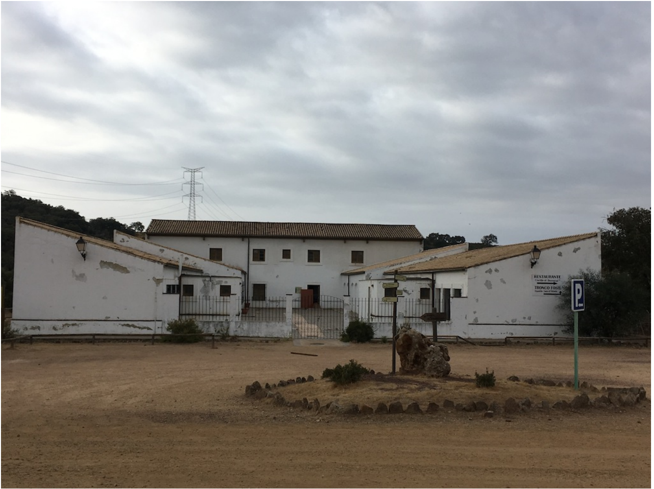
Centro de Visitantes Cortijo del Berrocal

Comienza el recorrido por el sendero del Berrocal por una bonita dehesa de alcornoques y piedras de granito. Desde el primer momento el camino nos regala con un gran repecho que seguro a más de uno se le atraganta.