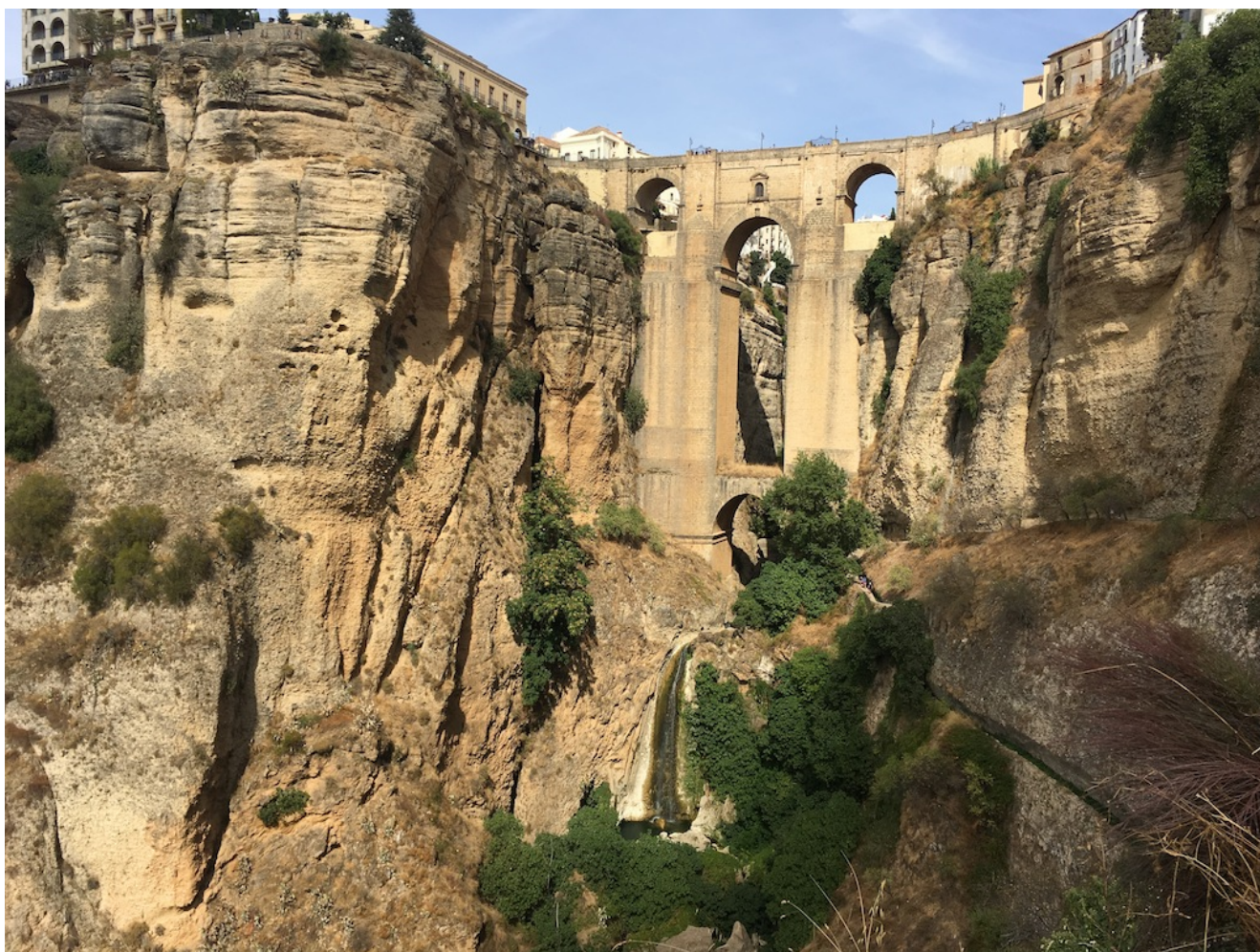
Puente Nuevo de Ronda

Nivel dos- Domingo 1 de mayo- Los caminos de Ronda es una bonita y completa excursión de dificultad moderada. Tiene un recorrido de 16 km y 500 metros de desnivel acumulado en subida. Pondremos un bus desde Sevilla y se puede llegar en coches particulares.