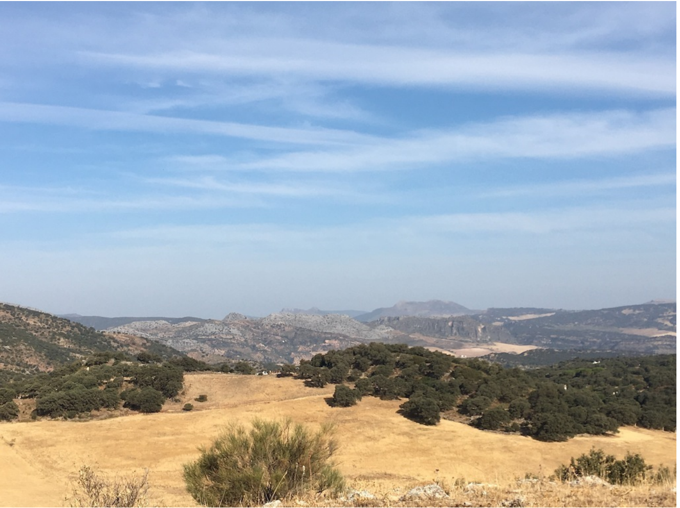
Vista desde el Cerro del Cincho