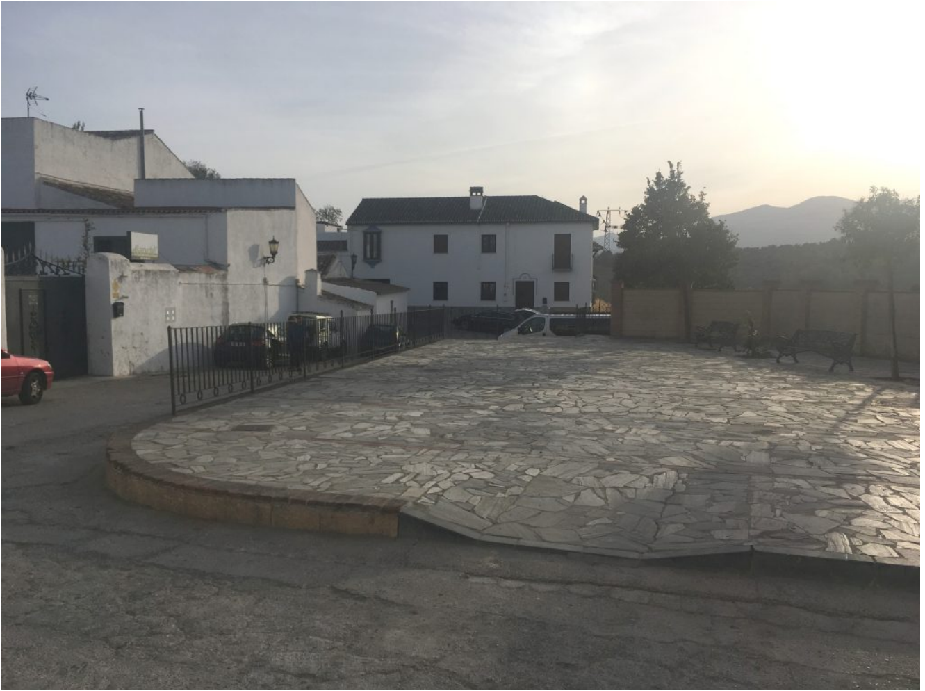
Punto de encuentro