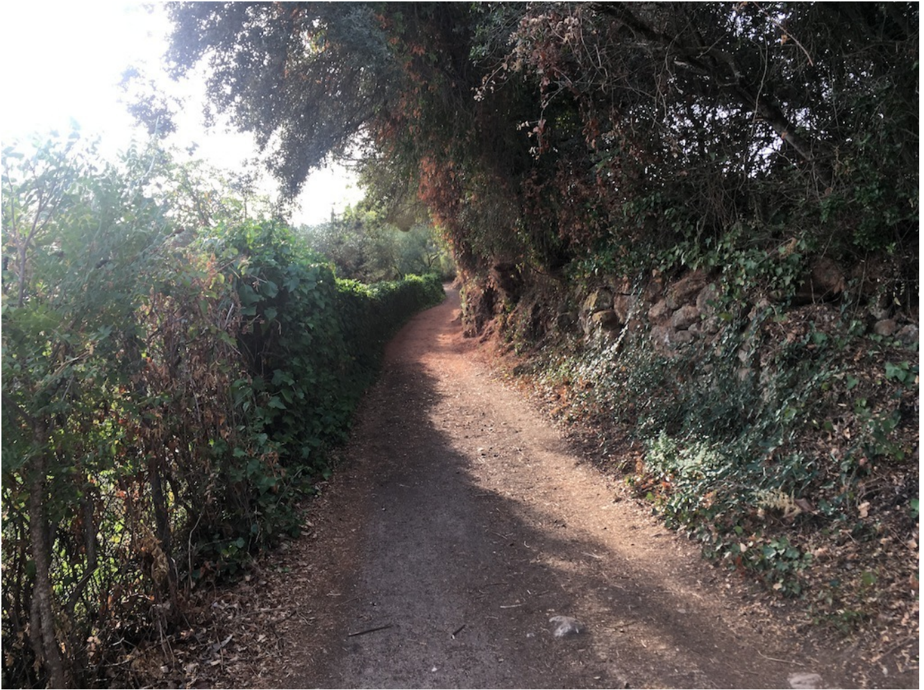
Camino junto al Arroyo Culebra