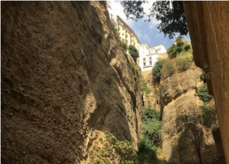
■ Puento Nuevo Ronda