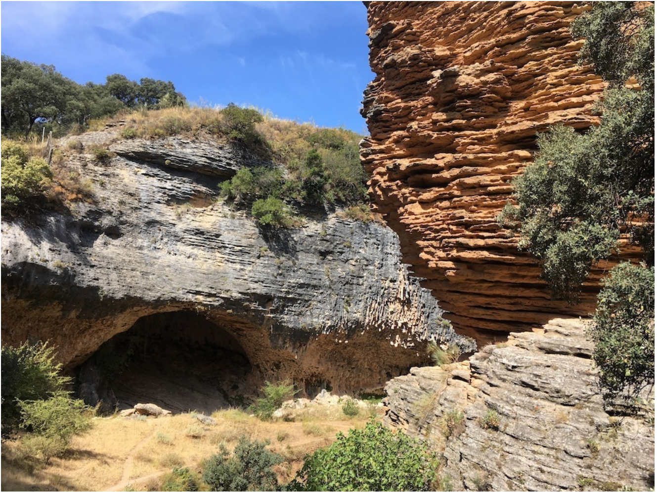
Cueva de los Aviones