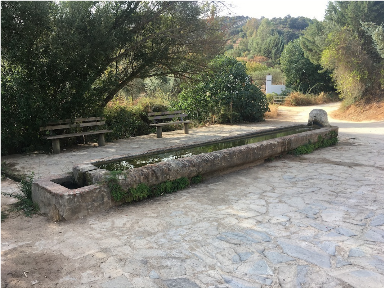
Pilón de Cartajima

Desde allí subiremos al Cerro del Cincho donde tendremos unas preciosas vistas de la sierra. Para después cruzar la carretera para iniciar una exigente subida que nos interna en la sierra donde tras el cruce de varias cancelas acabaremos llegando al punto de avituallamiento de fruta en el preciso lugar del Tajo del Abanico.