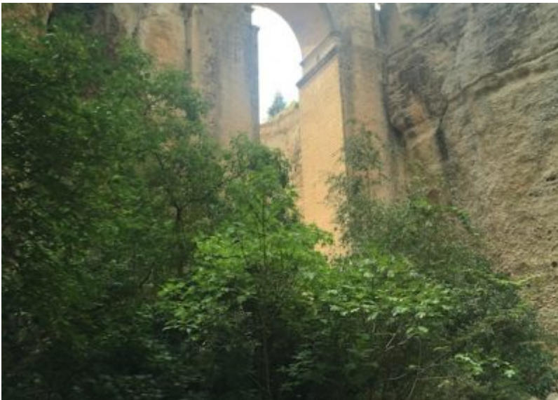
■ Puento Nuevo