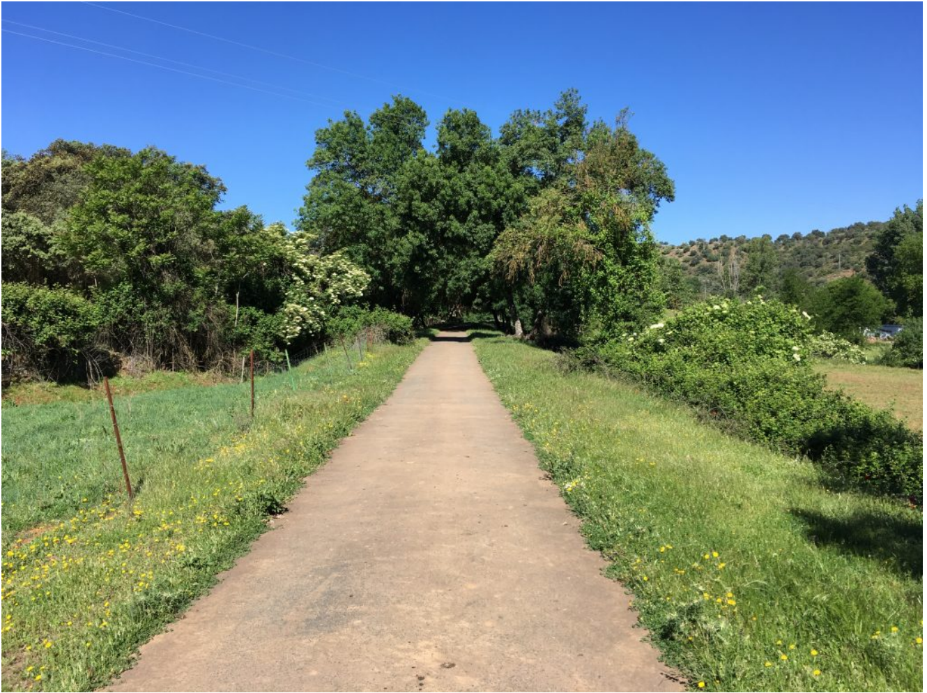
Camino de las cascadas

Empieza la ruta senderista atravesando el pueblo iremos al Nacimiento del Río Huéznar podemos contemplar a la fresca como el agua sale a la superficie provocando una surgencia o fuente que da lugar al Nacimiento del Río Huéznar.