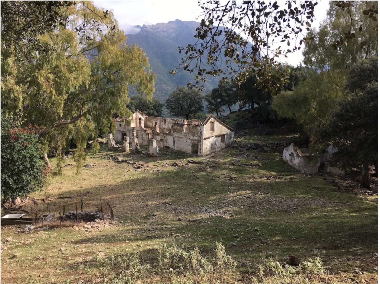
Casa en ruinas