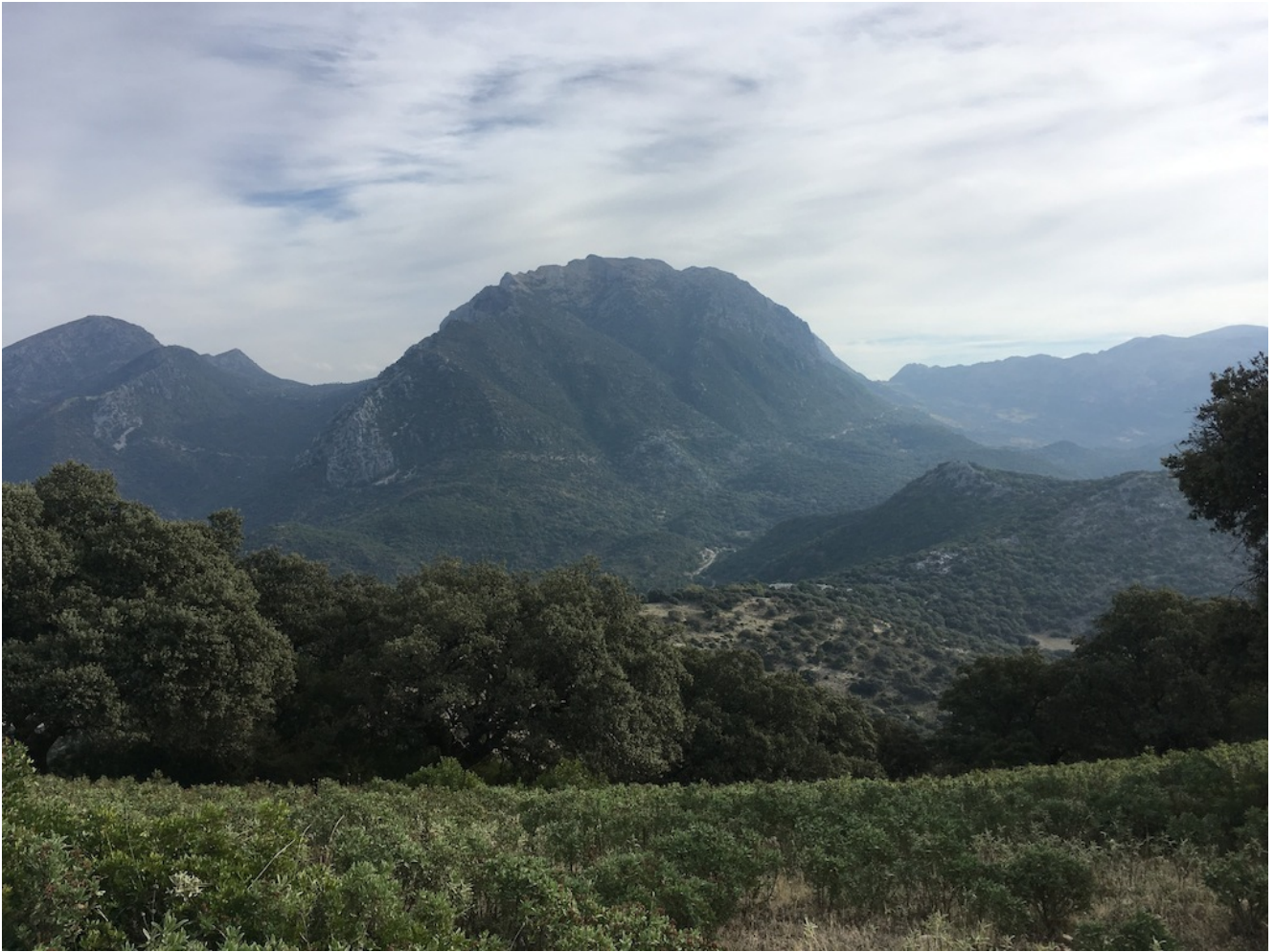
Vista de la Sierra de Grazalema