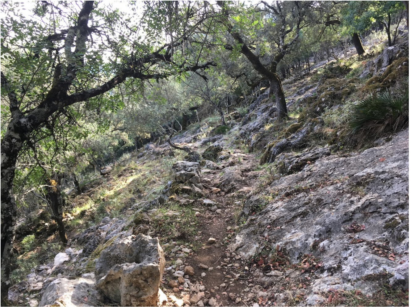
Descenso de Albarracin