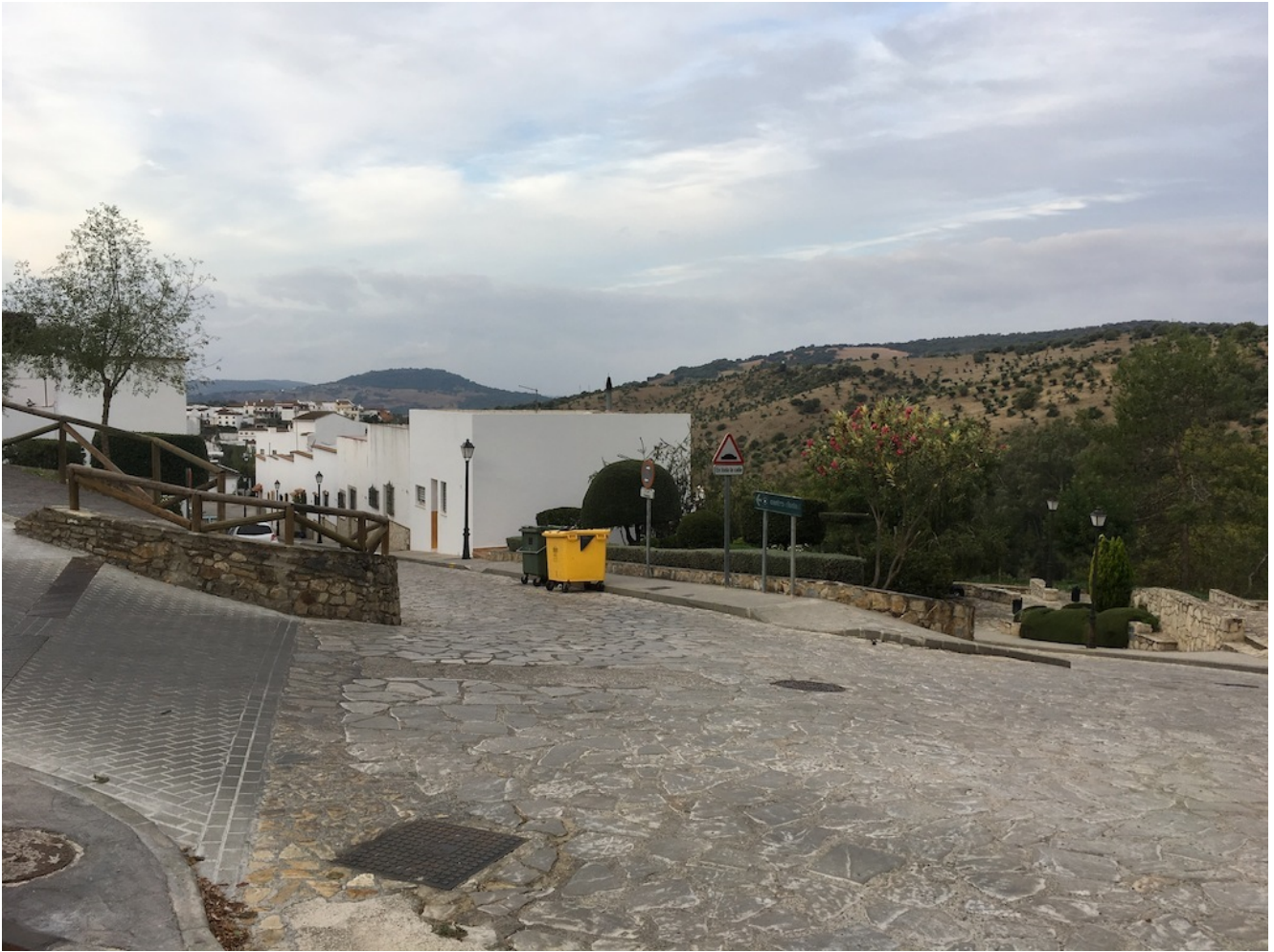
Parking cerca del Jardín Botánico

Comenzamos la subida a Albarracín por la parte de la carretera hacia Grazalema. Es una subida potente pero se hace bastante fácil ya que no es muy agresiva, salvo en su parte final, ya que no tiene un camino claro. Está la opción del cortafuegos que es muy inclinado o serpentear entre la maleza (escogimos esta) por lo que llegamos a la cima bastante llenos de arañazos.