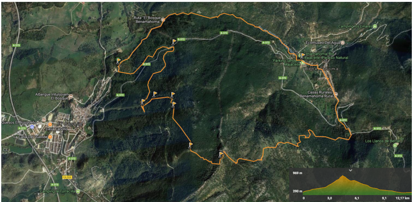
Track de la ruta