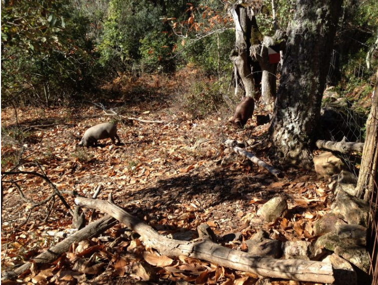
■ Cerdos ibéricos

Galaroza y Fuenteheridos otra vez. Los colores marrones y verdes, la frondosidad de los bosques, el olor de los alcornoques, encinas, castaños y pinos, los cerdos ibéricos, ovejas y aves de todo tipo son los mejores compañeros del senderista.