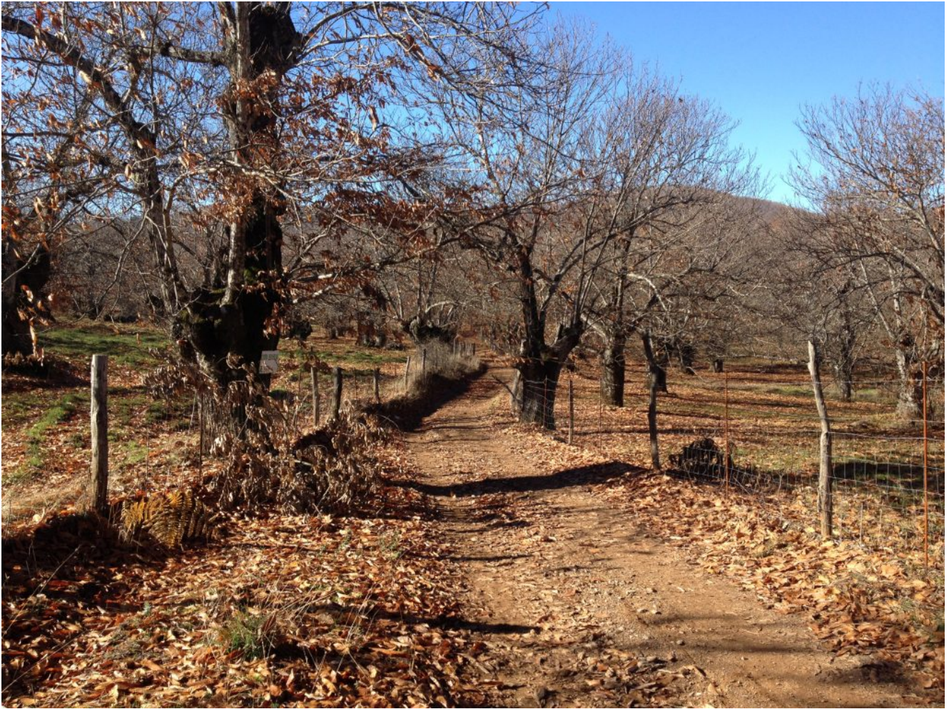
Camino de Fuenteheridos

Suponemos que sobre las 16.00 horas llegaremos al pueblo de Fuenteheridos para tomar todos juntos un refrigerio en algún bar de la plaza donde daremos por concluida nuestra bonita ruta circular por la Sierra de Aracena.