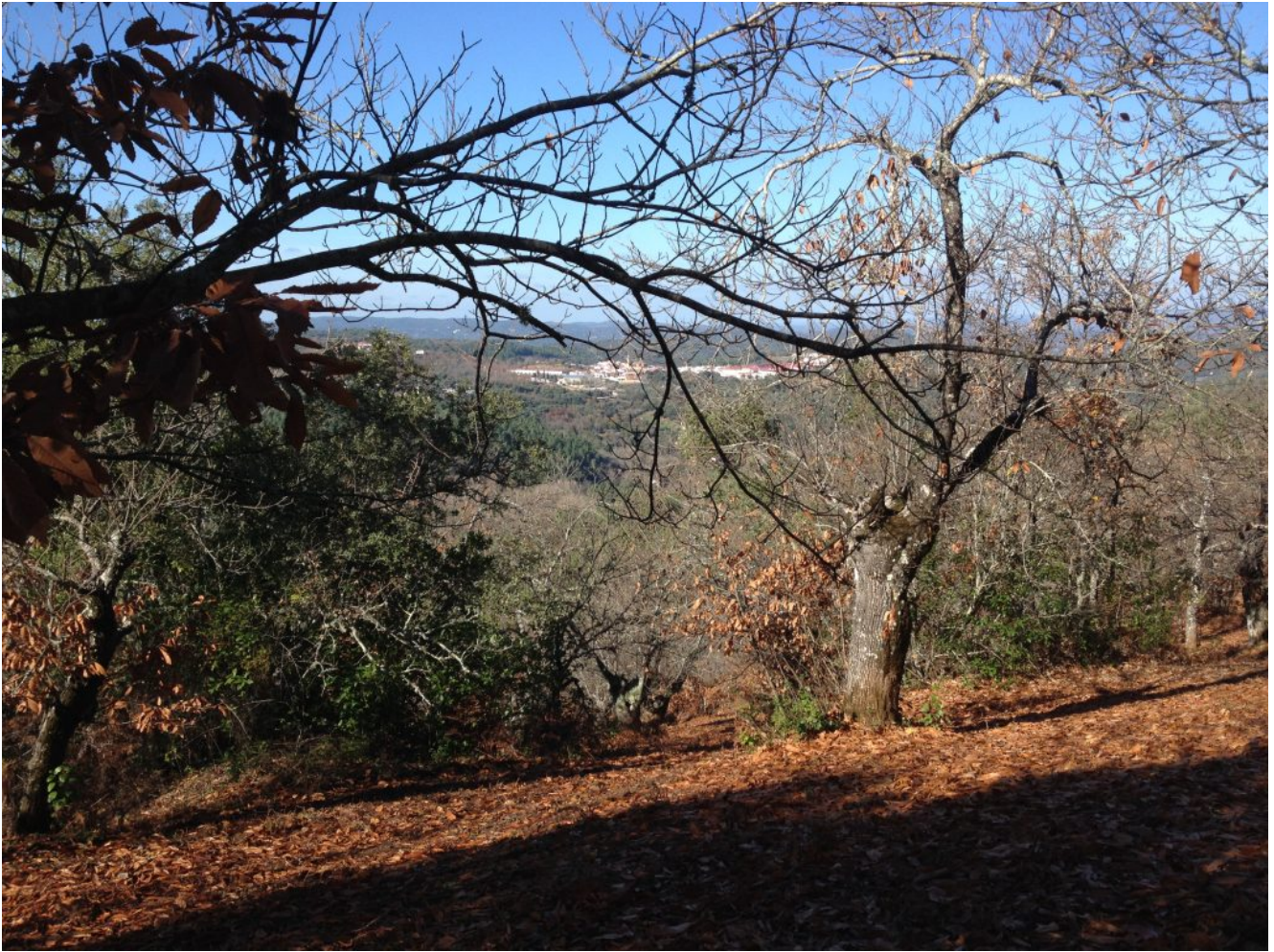
Vista de Galaroza

Dejaremos Galaroza a nuestra izquierda e iremos por la carretera 300 metros para tomar el antiguo camino a Fuenteheridos , otra imponente subida que culminaremos con una segunda parada para comer en cualquier campa al sol de las muchas que hay en el recorrido.