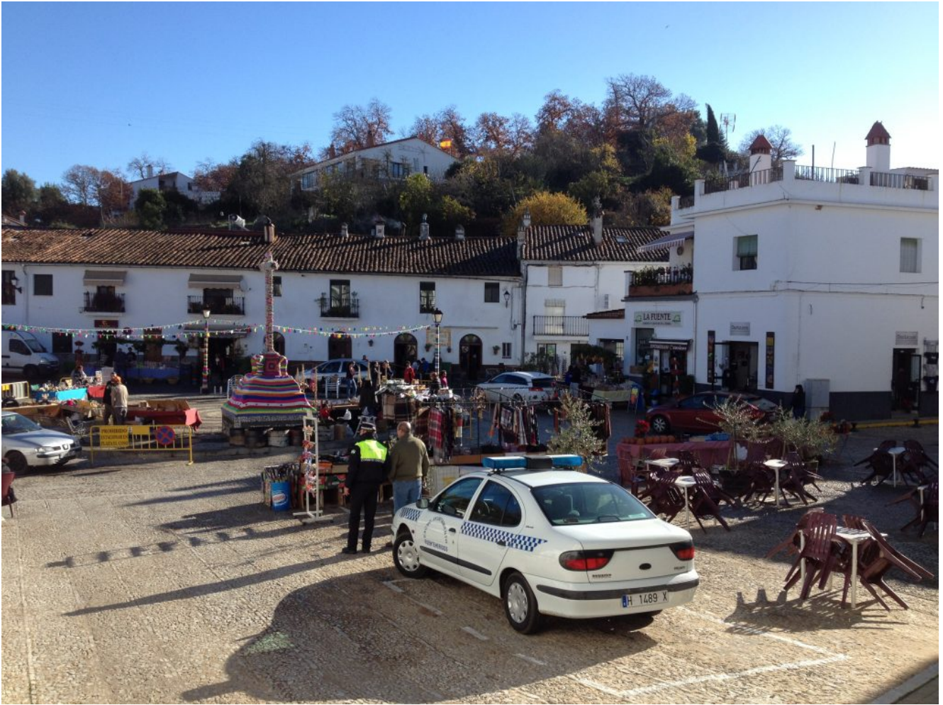
Plaza del Coso de Fuenteheridos, punto de encuentro

Nos pondremos en marcha con mucha energía para dirigirnos al pueblo de Castaño de Robledo , os recuerdo que tendremos que subir bastante ya que es el pueblo ubicado a mayor altura de la provincia de Huelva.