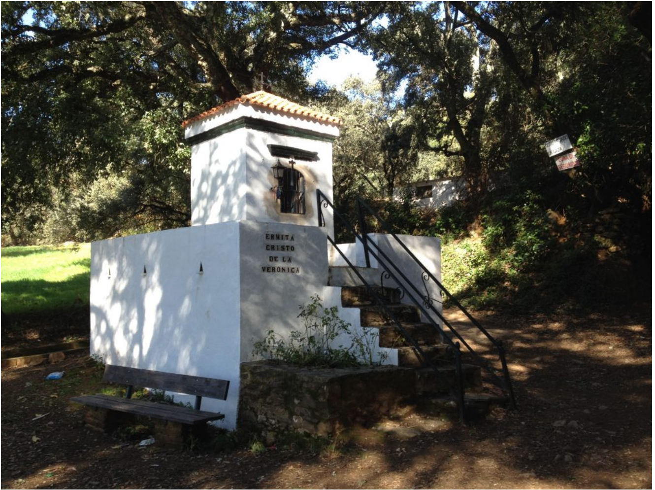
Cristo de la Verónica en Castaño del Robledo