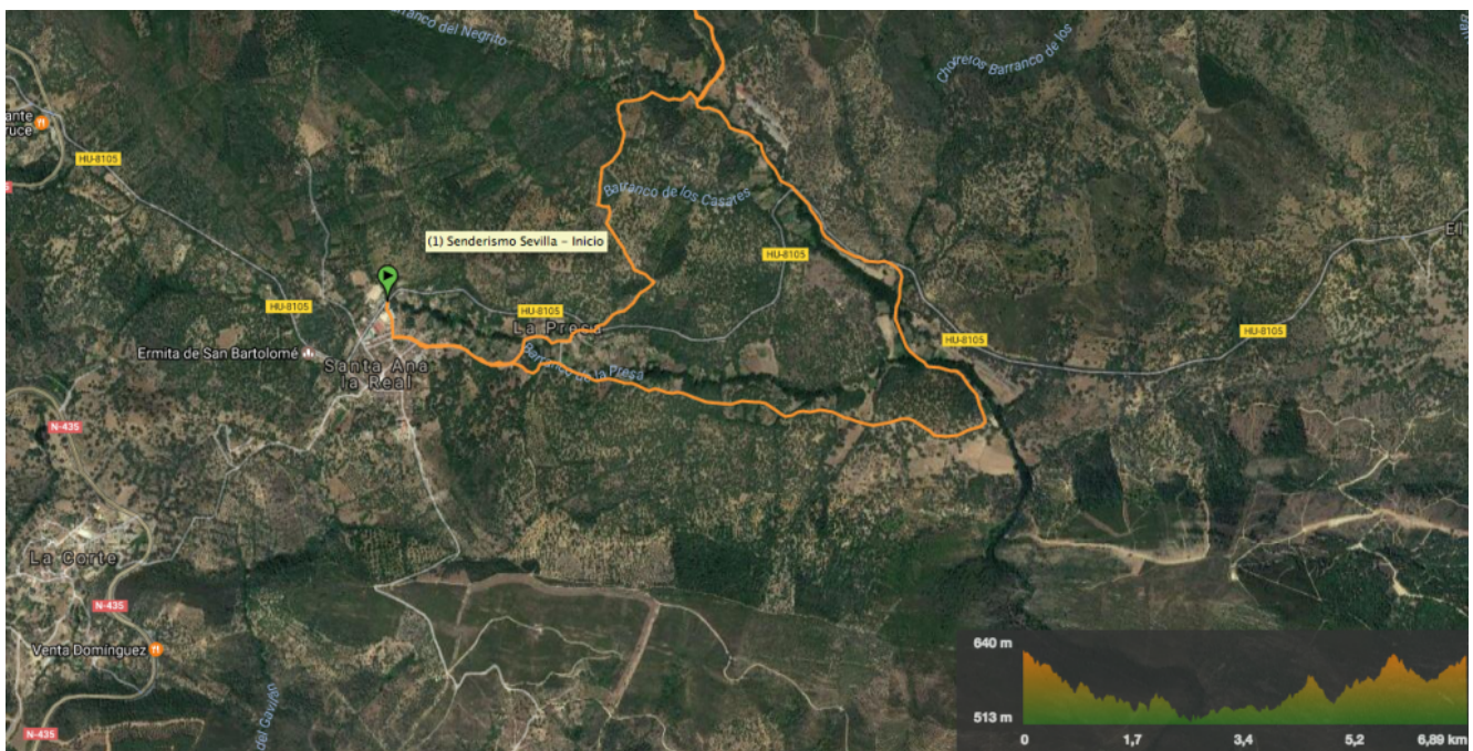
Track de la ruta