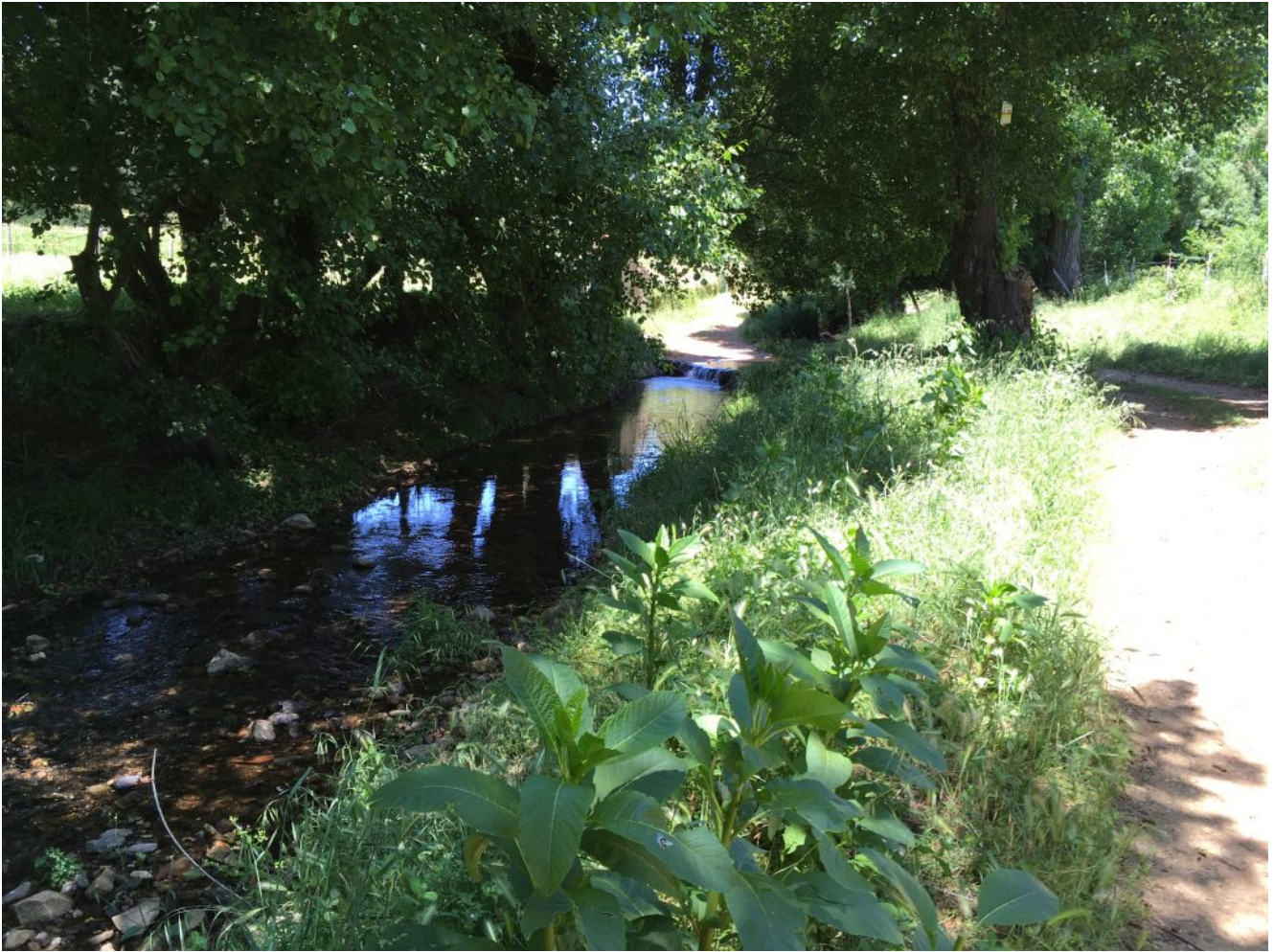
Rivera de Santa Ana

El precio de esta excursión es de 7€ para los adultos y 2€ para los niños (los del club gratis, por supuesto). Si quieres venir con nosotros tienes que realizar el proceso de inscripción para ello puedes hacer el pago en la propia excursión o por transferencia en nuestra cuenta de Caixa Bank ES57 2100 2827 5801 0018 5175 y envíanos el resguardo a nuestro mail ( info@senderismosevilla.net ) con tu nombre y apellidos, número de DNI, fecha de nacimiento y un móvil de contacto. Si os hacéis socios del Plan Family podéis ir toda la familia durante 365 días que dura el año por sólo 59,90€ en total. Pincha en Plan Family para ampliar esta información. Si tienes alguna duda en nuestro móvil 610907739 te informaremos. Consúltanos sobre las posibilidades de conseguir transporte desde Sevilla.