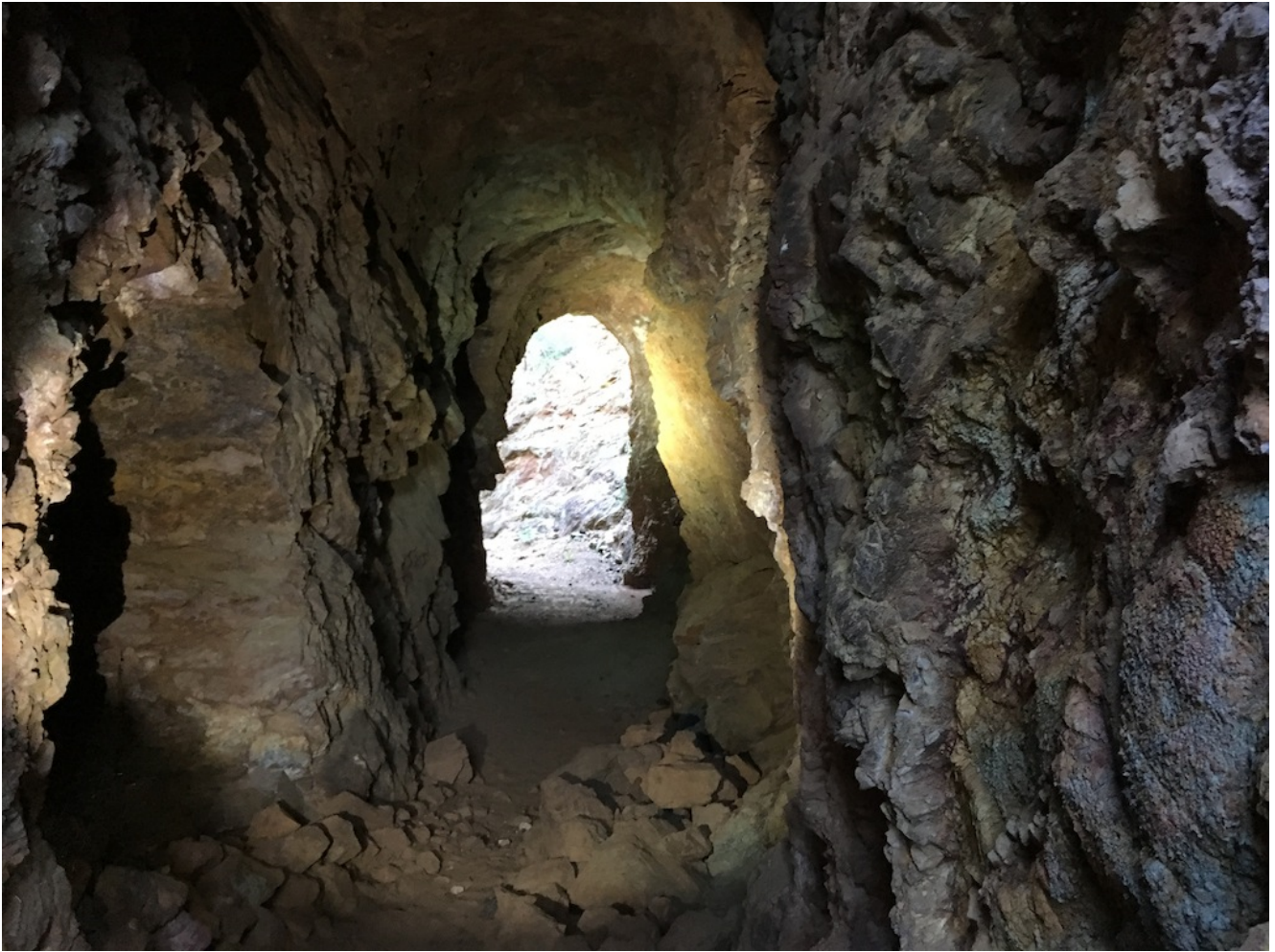
Interior de una mina

Después de la excursión podremos visitar la Feria de Productos Típicos y Artesanales de la Sierra Norte de El Pedroso, uno de los mayores acontecimientos gastronómicos de nuestra provincia. Miles de personas se acercan cada año a pasear por este entorno pedroseo, disfrutando de la gastronomía, del encanto natural y la belleza de la sierra norte de Sevilla para degustar y comprar los productos típicos de la Sierra Norte de Sevilla.