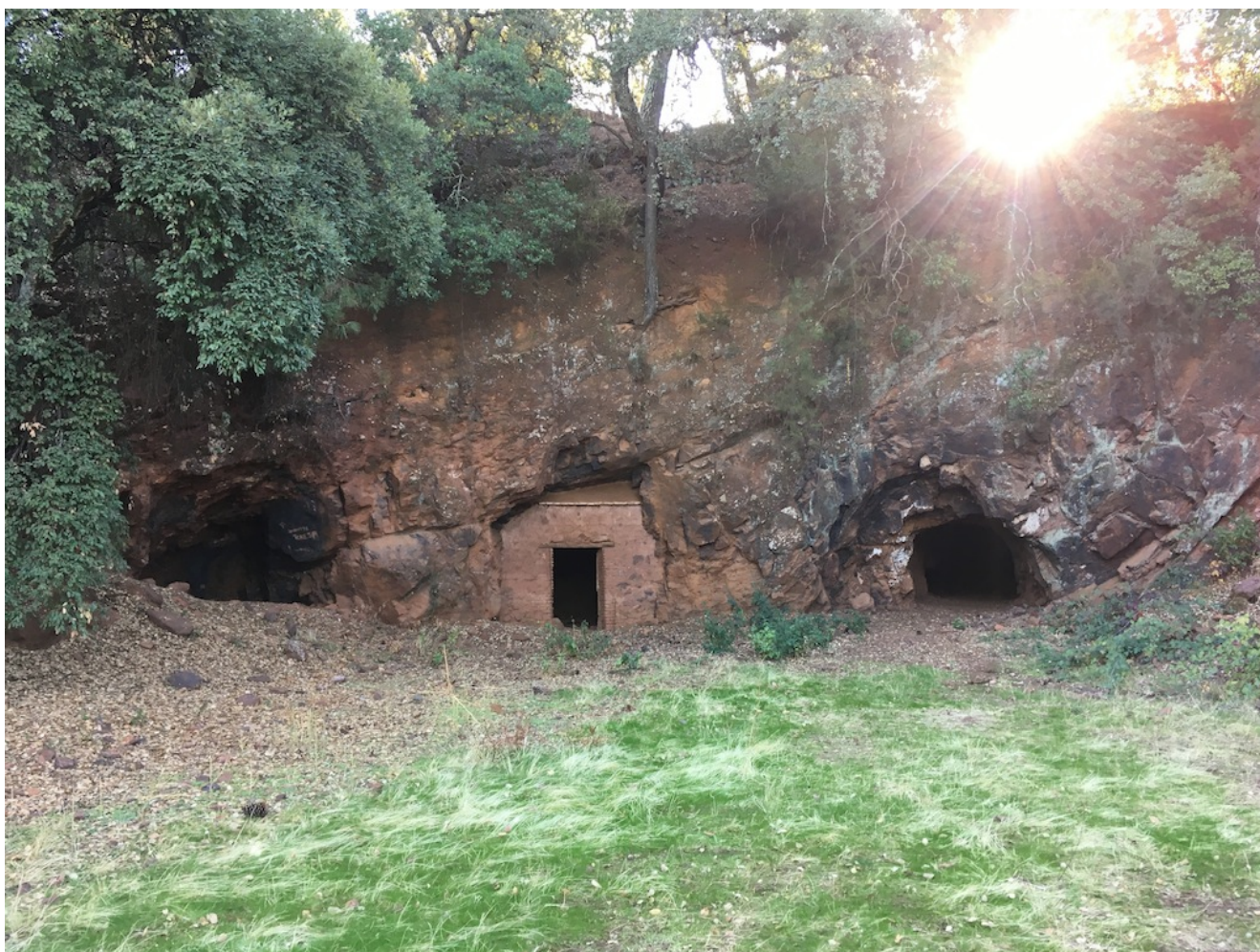
Entrada a las minas

importancia de los recursos que nos brinda su ecosistema y los grandes monumentos naturales que nos han dado un sitio privilegiado en el mapa del Turismo Activo y Cultural Español . Pero ahora queremos enseñarte, desde un punto de vista completamente nuevo, todo lo que nos ofrece este paraje natural.