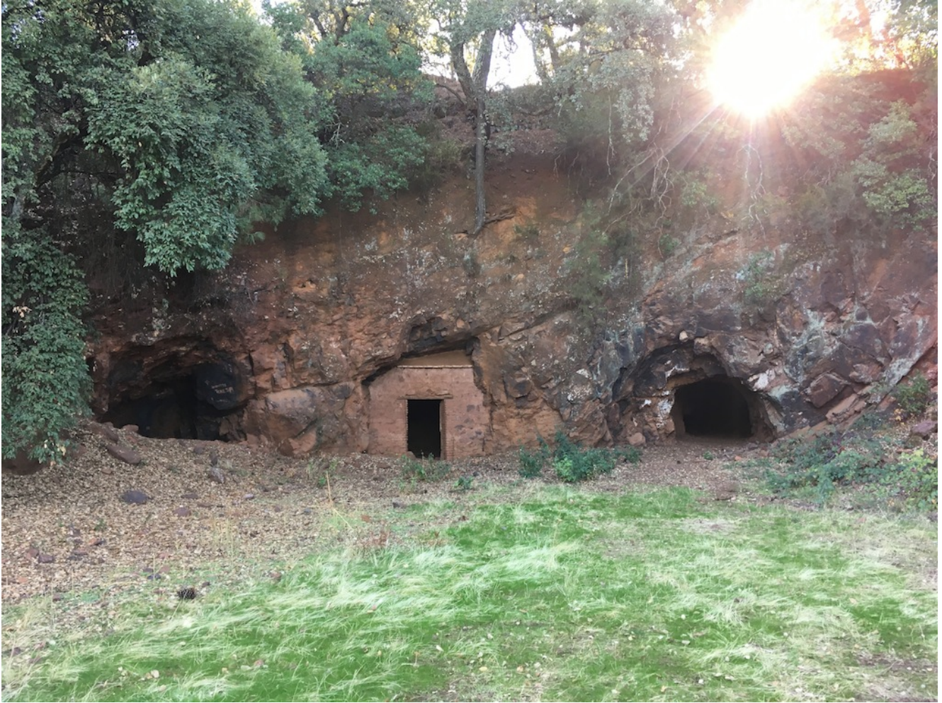
Entrada a las minas

completamente nuevo, todo lo que nos ofrece este paraje natural.