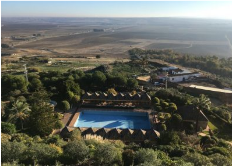
■ Instalaciones del Parador

Y finalmente iremos a ver la Necrópolis Romana de Carmona separados por diferentes grupos. Después dejaremos un par de horas libres para comer en la zona y sobre las 17 horas volveremos para Sevilla.