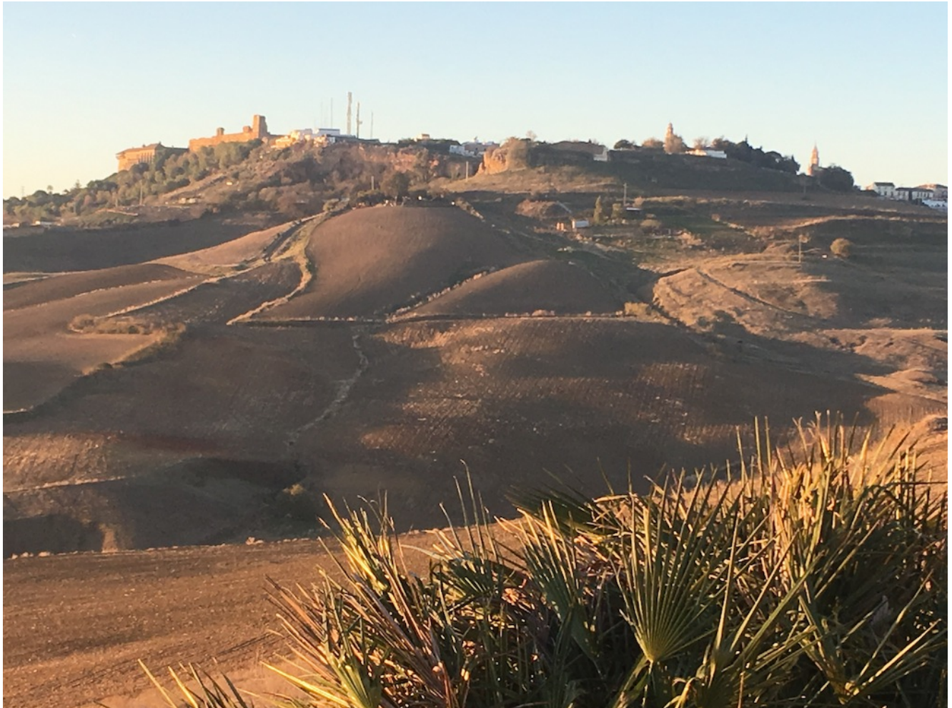
Vista de las Carmona desde las cuevas

Carmona es una de las ciudades más antiguas y con más historia de Sevilla ya que data de hace más de 5000 años. Fue poblada por tartesos, fenicios, romanos y árabes. Destaca como monumento principal su Alcazar convertido en Parador Nacional y que visitaremos en esta excursión.