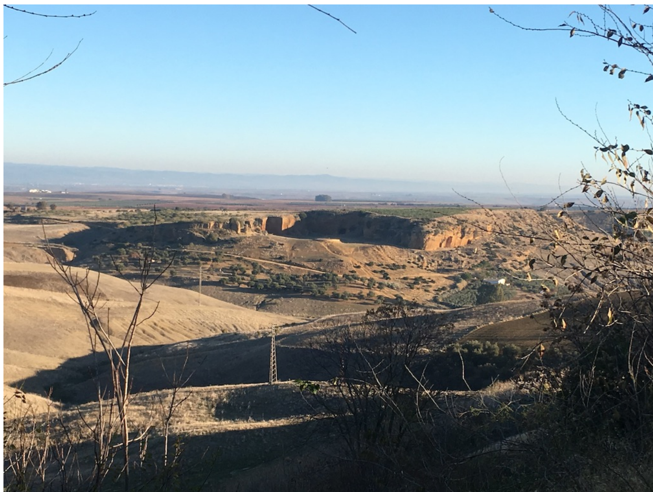
Vista de las cuevas desde Carmona[/caption]

Nivel uno- Jueves 6 de febrero de 2025. Conoce la Naturaleza de Nuestra Provincia: Las Cuevas de la Batida , una excursión por la ciudad de Carmona y sus alrededores, en la que visitaremos el casco urbano con su parador y las cuevas. Son 9 km de recorrido y 150 metros de desnivel acumulado en subida. Pondremos un transporte desde Sevilla y también se puede llegar en coches particulares.