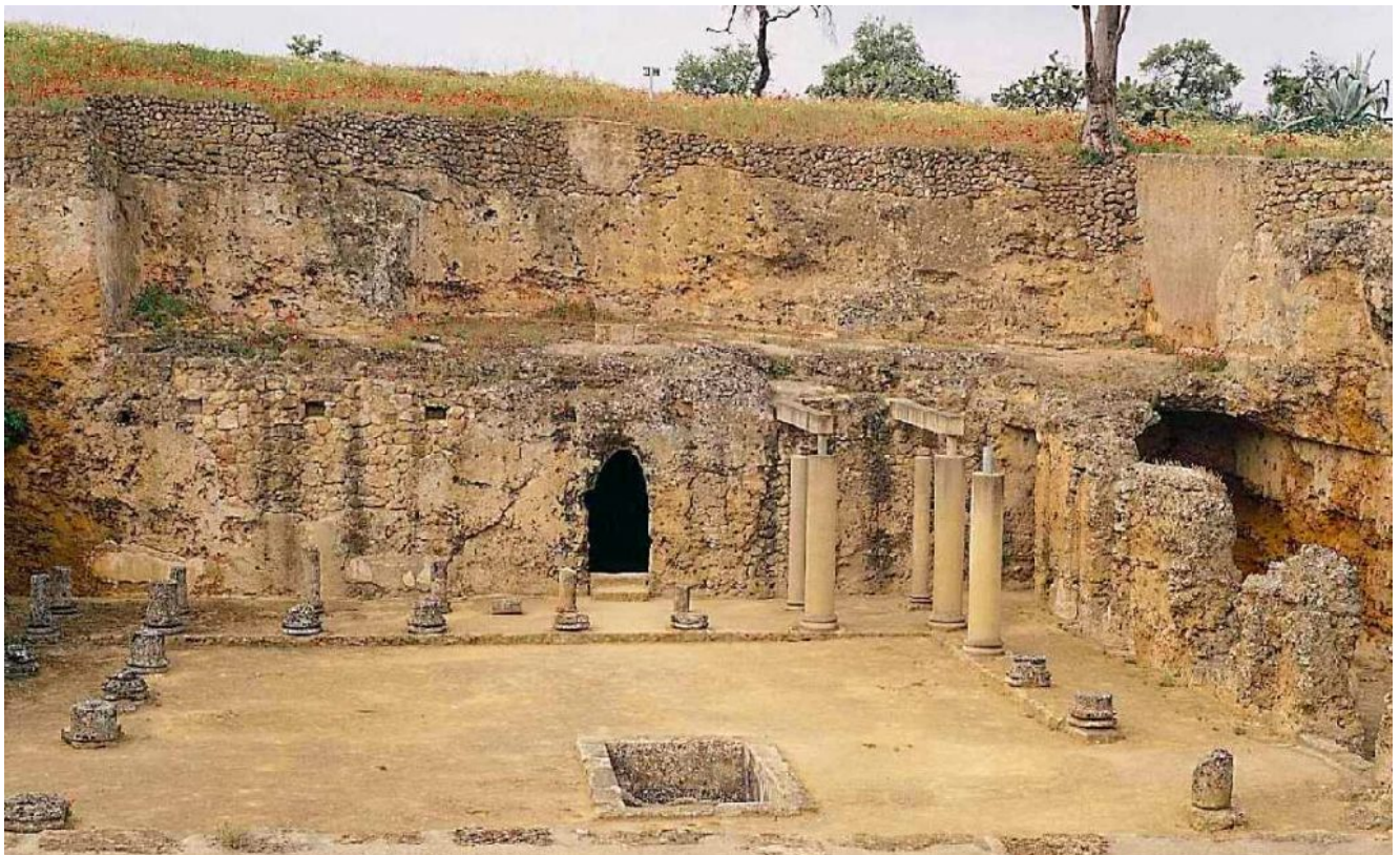
Necrópolis Romana de Carmona

Y finalmente iremos a ver la Necrópolis Romana de Carmona separados por diferentes grupos. Después dejaremos un par de horas libres para comer en la zona y sobre las 17 horas volveremos para Sevilla.