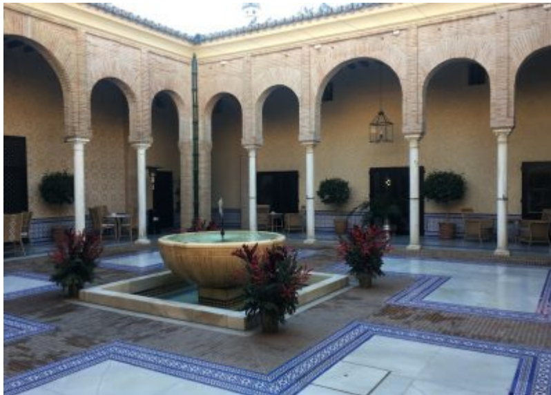
Patio del Parador