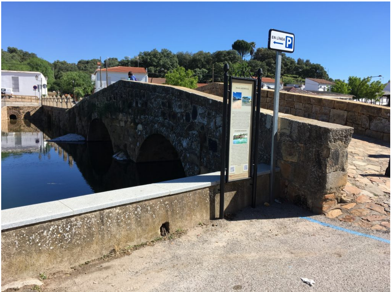
Puente Romano de Piedra

El final del último lado de este triángulo nos lleva a la Playa Artificial de San Nicolás del Puerto , construida sobre el lecho del río Galindón y donde podemos disfrutar con la contemplación del bello Puente Romano de piedra que sirve hoy en día para cruzar el mencionado río.