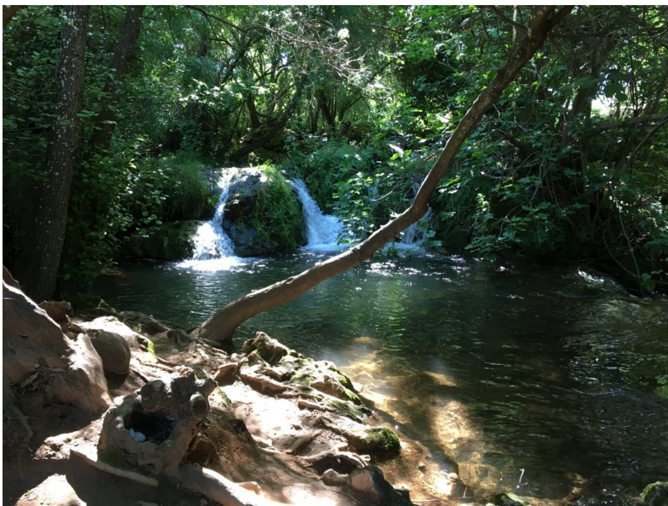
Cascadas del Huéznar

Después de disfrutar de este capricho de la naturaleza volveremos a San Nicolás del Puerto para comer en alguno de sus restaurantes, tomar el sol y bañarnos en la Playa Artificial . Aprovechando que estamos en este bello lugar apetece pasar algunas horas de la tarde allí, antes de volver a Sevilla.