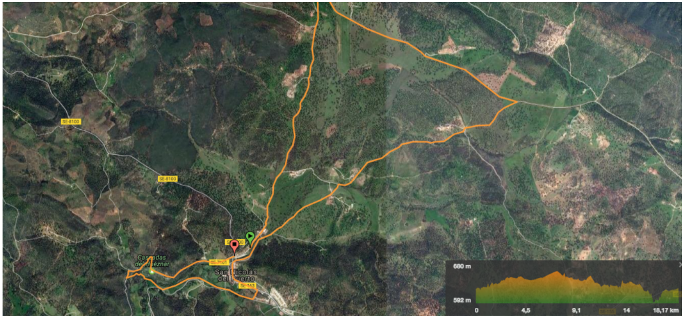
Track de la ruta