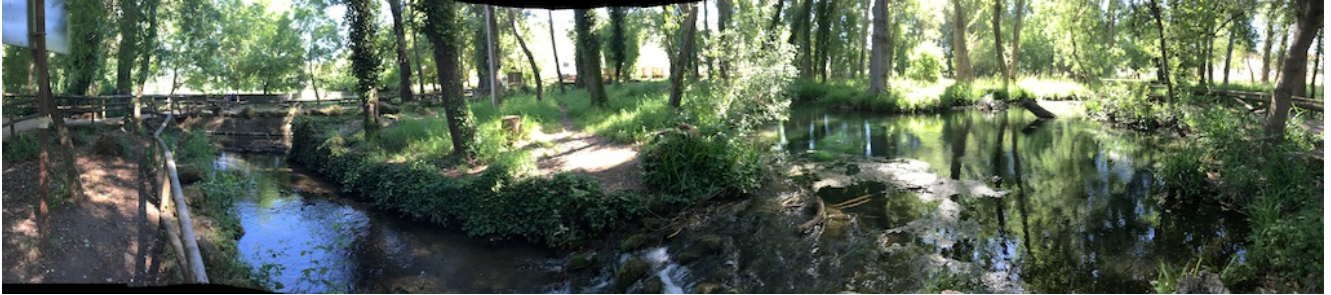
Nacimiento del Hueznar

Para terminar la temporada de primavera vamos a pasar un día en San Nicolás del Puerto el domingo 28 de mayo , donde haremos una excursión premium de unos 19 kilómetros a través del Sendero de las Dehesas para luego recorrer el Nacimiento y las Cascadas del Huéznar y acabar bañándonos en la Playa Artificial. Esta ruta la calificamos de moderada por su longitud.