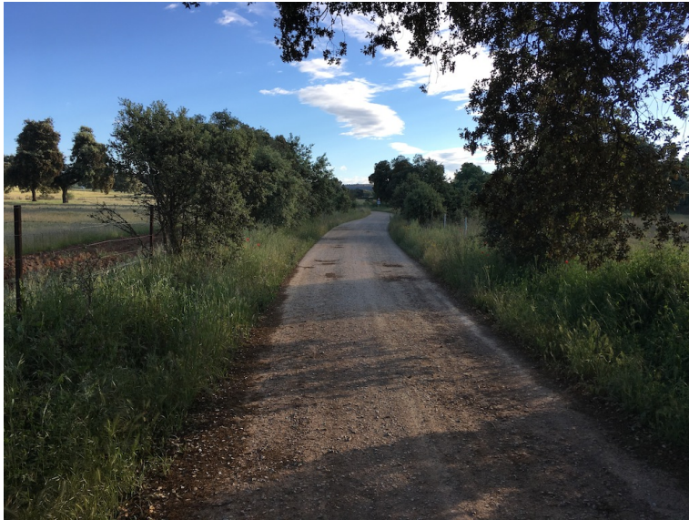
Sendero hacia el Hueznar