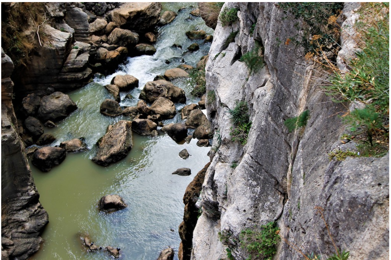
Prueba superada, compañeros.