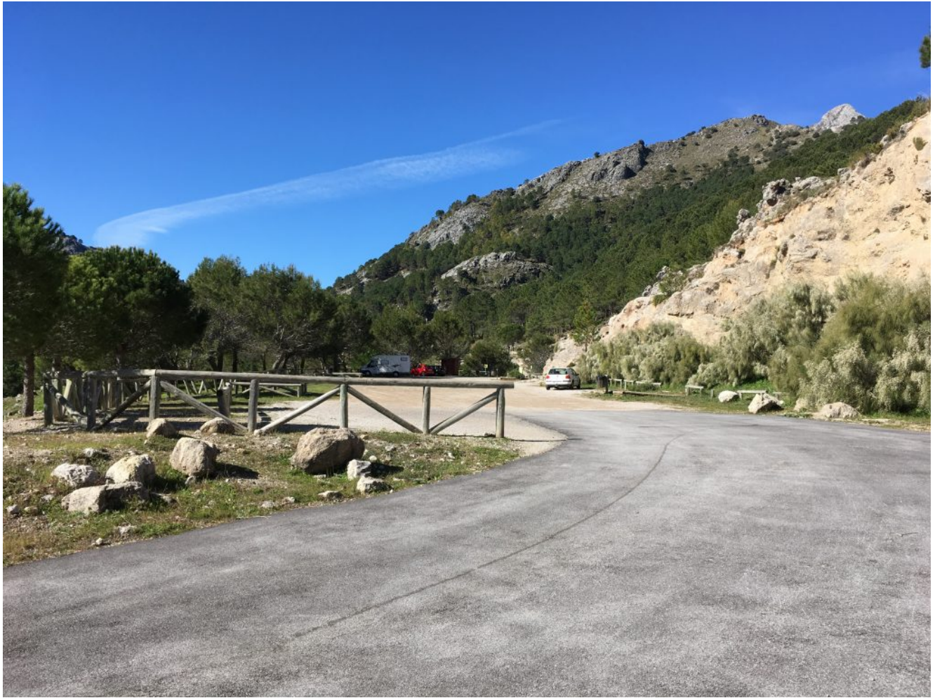
Parking del Pinsapar

Antes de hablar del recorrido de la excursión queremos hablar del protagonista de la excursión que es el pinsapo . El pinsapo es una especie arbórea, familia de las pináceas de las que apenas quedan algunos núcleos en la Sierra del Pinar de Grazalema, la Sierra de las Nieves y la Sierra Bermeja de Málaga.