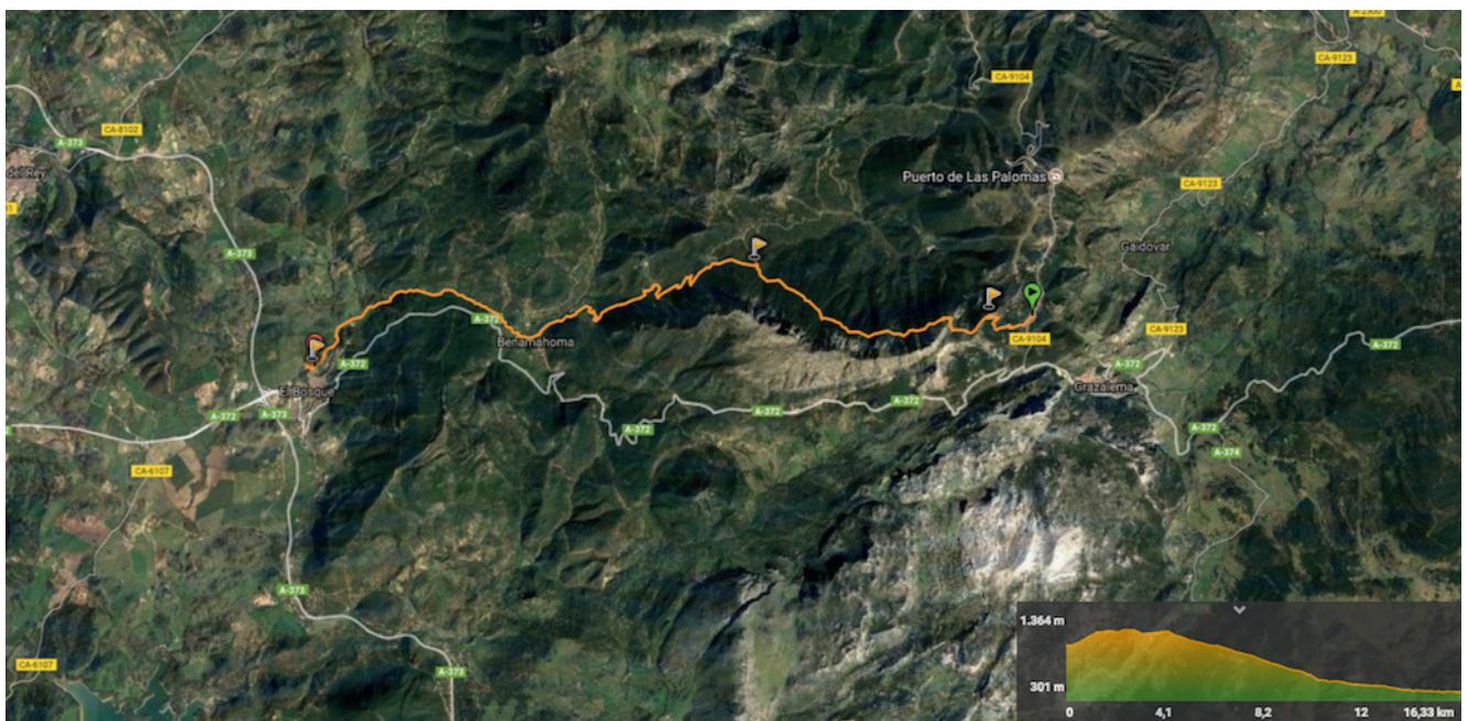
Track de la ruta