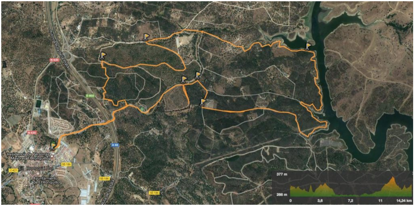
Perfil de la Ruta Los Brezales