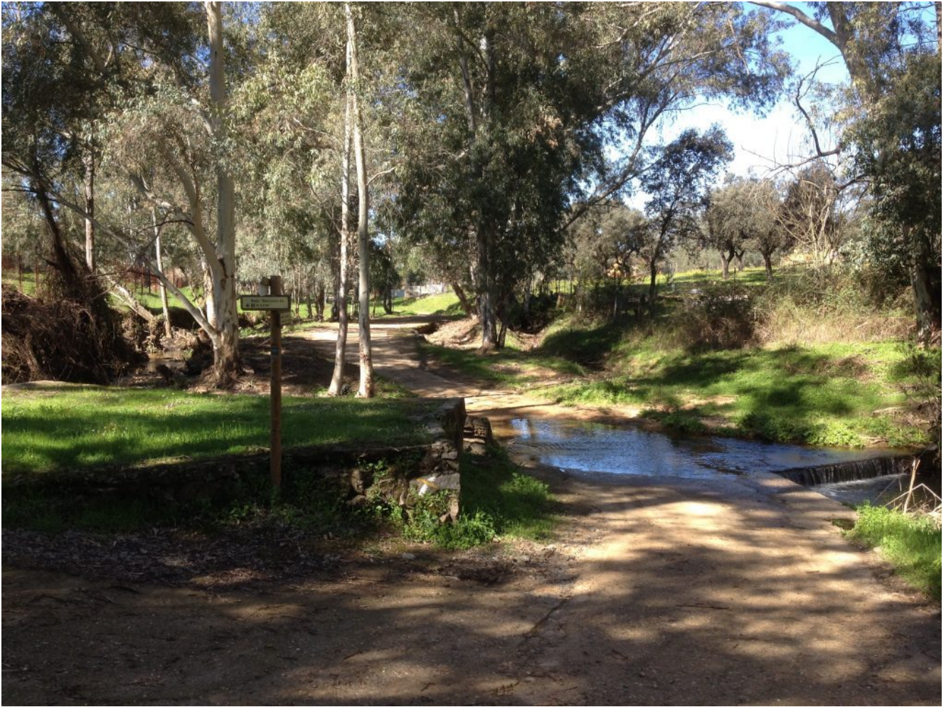
Umbría de Santa Fe

El precio de esta excursión en bus es de 20€ para los adultos y 15€ para los niños. Si vienes en tu coche el precio es de 8 y 3€ respectivamente. Los socios siempre 8€ menos. Si quieres venir con nosotros tienes que realizar el proceso de inscripción para ello puedes hacer el pago por transferencia en nuestra cuenta de Banco Sabadell ES84 0081 7302 8200 0146 1452 y envíanos el resguardo a nuestro mail ( info@senderismosevilla.net ) con tu nombre y apellidos, número de DNI, fecha de nacimiento y un móvil de contacto.