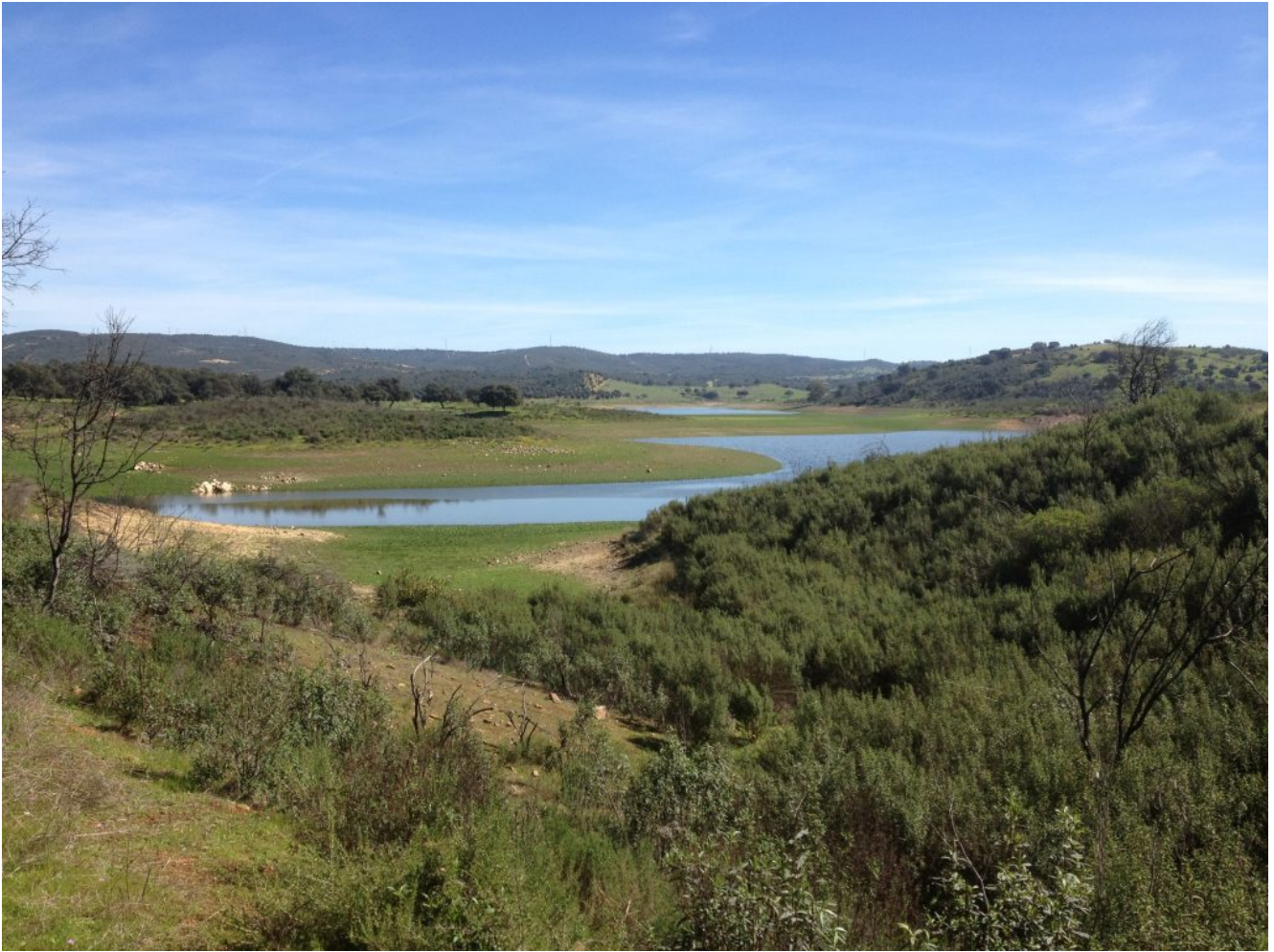
Panorámica del embalse de Cala

Caminaremos hacia el lugar denominado Umbria de Santa Fé , que ascenderemos para observar las preciosas vistas de la zona. Pararemos en el pantano a tomar nuestra fruta y allí podremos refrescarnos con su maravillosa agua.