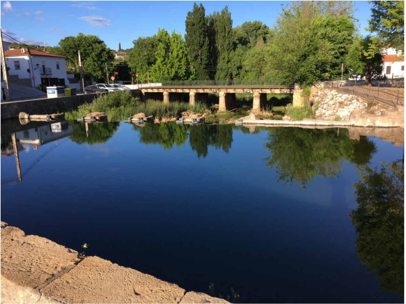
Playa del San Nicolás del Puerto

A las 18 horas será la hora de vuelta para Sevilla. El precio de esta excursión es de 20€ si vienes en autobús y de 8€ si vienes en coche (8€ menos los del Club) Para reservar plaza es obligatorio realizar el proceso de inscripción para ello puedes hacer el pago con tarjeta o por transferencia en nuestra cuenta de BBVA ES35 0182 3299 8102 0160 5087 y envíanos el resguardo a nuestro mail (info@senderismosevilla.net) con tu nombre y apellidos, número de DNI, fecha de nacimiento y un móvil de contacto.