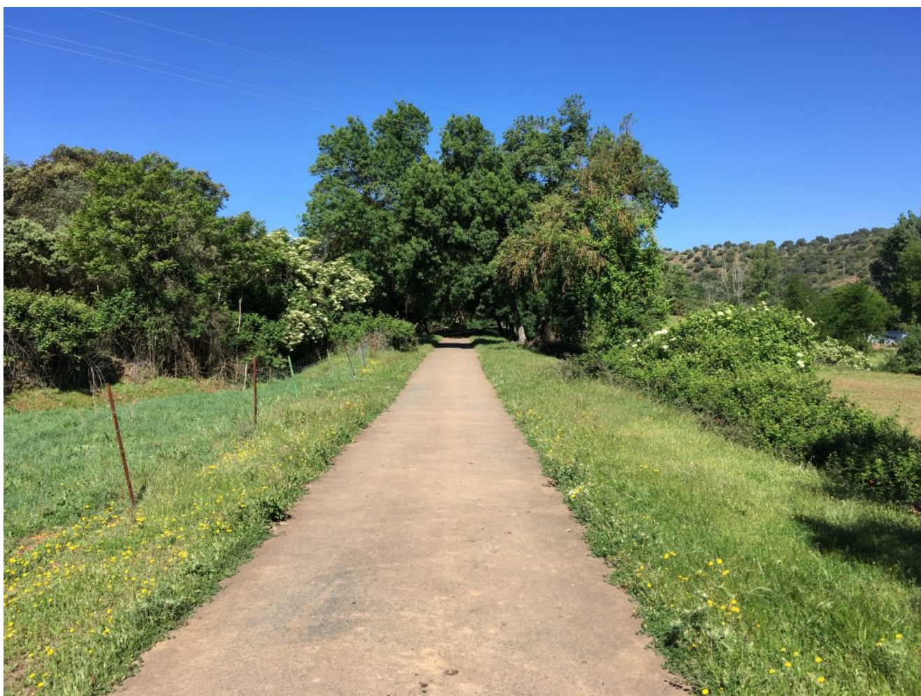
Camino de las cascadas

Feria y a las 8.45 en la Cervecería Ronda el Alamillo (hace parada para desayunar) Quedaremos a las de a las 11 horas en el Restaurante Atarazana, ubicado junto a la Playa Artificial de San Nicolás del Puerto y cuyas coordenadas gps son 37.996529, -5.653015. Queremos avisar que el trayecto desde Sevilla es largo y puede costar unas dos horas de viaje y cuando se llega a San Nicolás del Puerto no hay cobertura de móvil por lo que recomendamos que los que venís en coche no salir de Sevilla más tarde de las 9 horas.