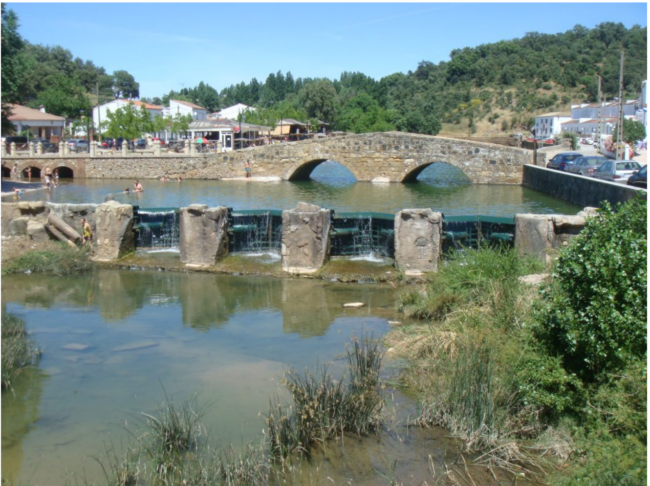
San Nicolás del Puerto

Nivel uno- El sábado 30 de noviembre os proponemos una excursión a las Cascadas del Huéznar en San Nicolás del Puerto. Es una ruta de nivel uno con 10 kilómetros de longitud y 150 metros de desnivel acumulado en subida ideal para recorrer con toda la familia y para la que pondremos un bus desde Sevilla además de poderse llegar en coches particulares.