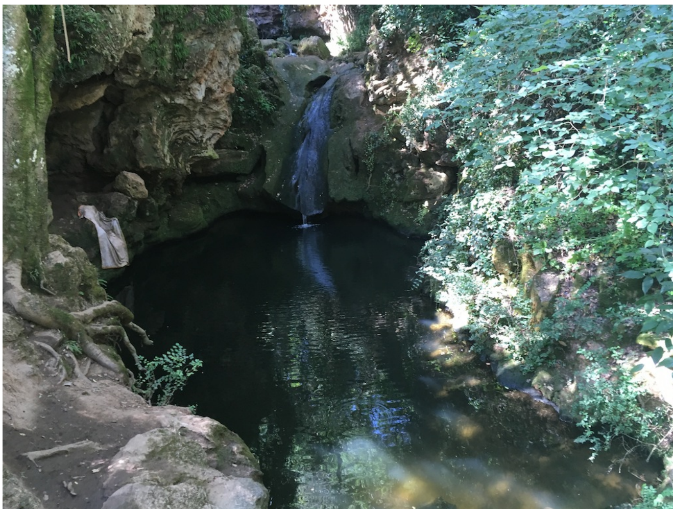
Baños de Popea

espesa vegetación y su humedad hacen de este un lugar muy bonito. Está ubicado en Santa María de Trassierra, localidad que está a 11 kilómetros de Córdoba capital.