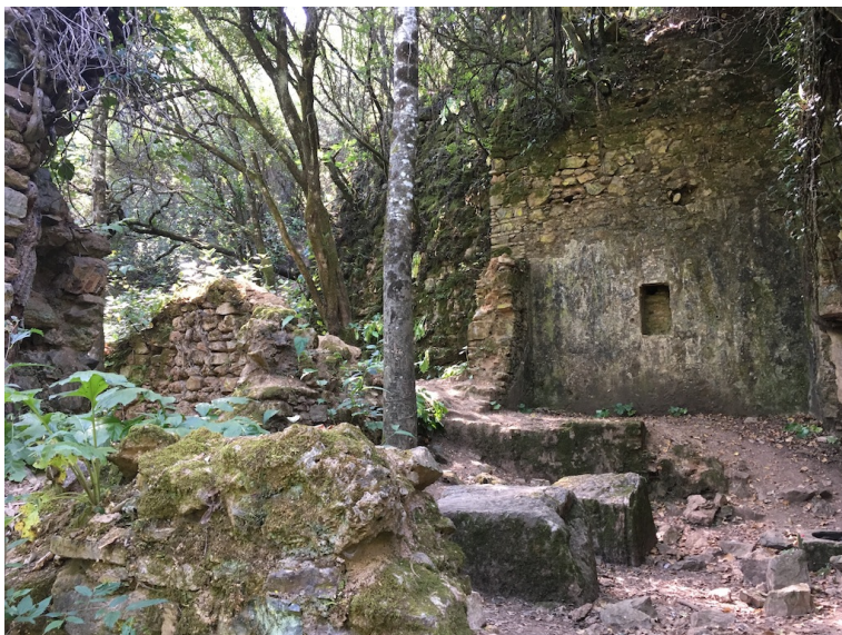
■ Molino en ruinas

El precio de esta excursión con bus es de 25€ no socios, 15€ socios y niños. Si vas por tus medios 15€ no socios, 5€ socios y niños. Si quieres venir con nosotros tienes que realizar el proceso de inscripción, para ello puedes hacer el pago por tarjeta en el botón de abajo o por transferencia en nuestra cuenta Banco Sabadell ES84 0081 7302 8200 0146 1452y envíanos el resguardo a nuestro mail ( info@senderismosevilla.net ) con tu nombre y apellidos, número de DNI, fecha de nacimiento y un móvil de contacto. Más info: La hora de vuelta será a las 16,30 horas aproximadamente salida de Trassierra y se recomienda ir ataviados con ropa de senderismo para caminar y llevar ropa de baño. También es necesario traer algún bocadillo para comer, algo de fruta y mucha agua.