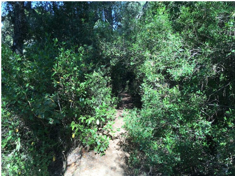
■ Recorrido maleza