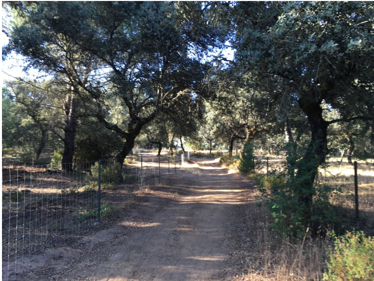
■ Recorrido alcornoques