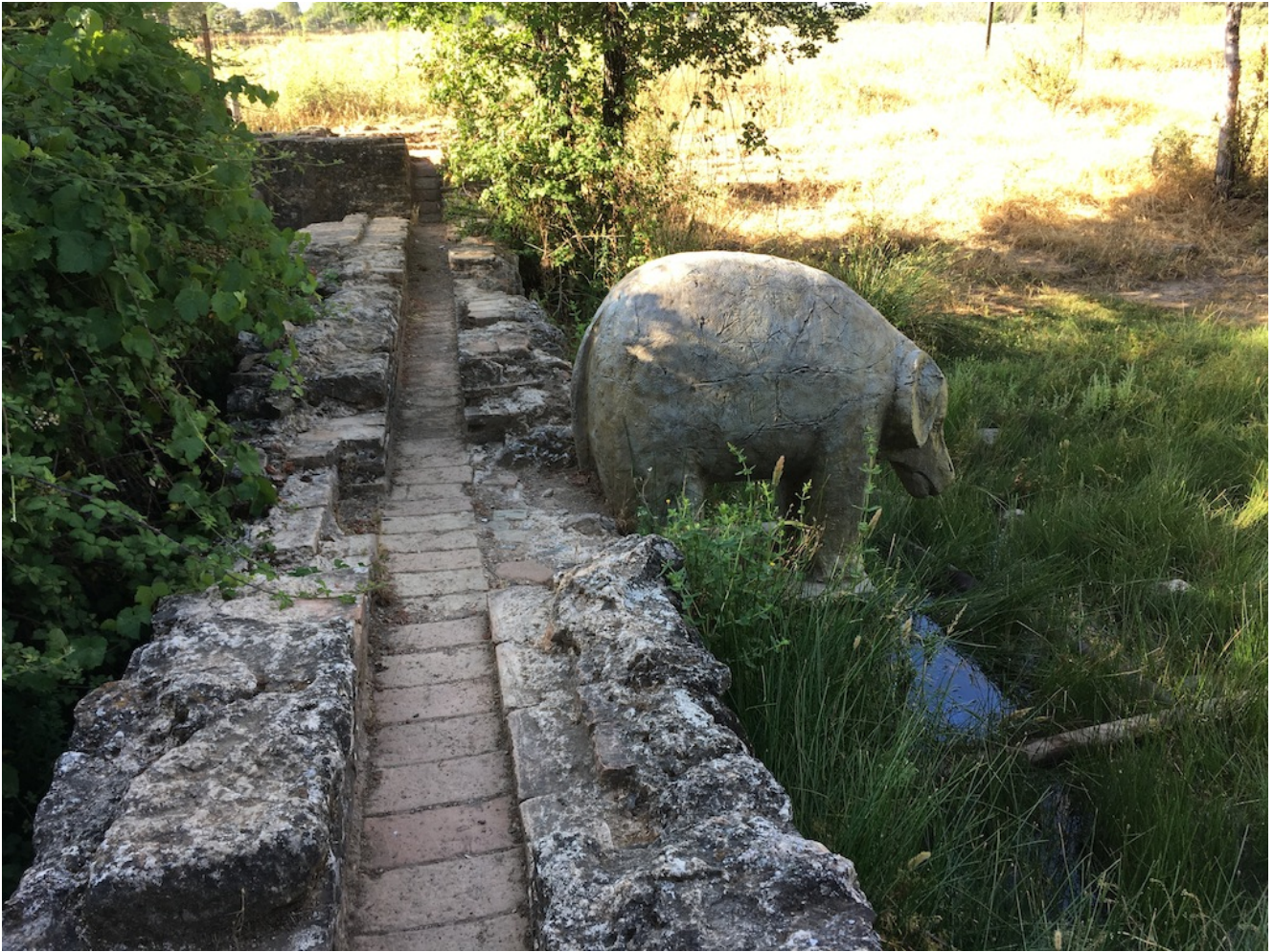
Fuente del Elefante

El camino cada vez es más agreste hasta que oímos por primera vez las aguas del Arroyo Bejarano . La tupida vegetación esconde el camino hasta que llegamos a esta preciosa charca que podemos ver en la imagen.