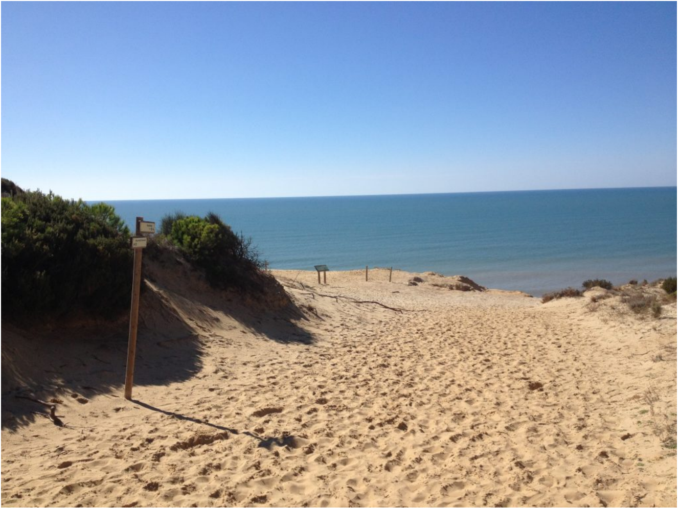
Barranco del Asperillo