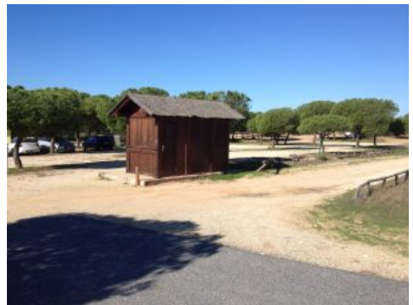
Quedamos en la caseta de madera

Comenzamos en la cabaña de madera de Cuesta Maneli en el km 42 de la A 494, en el tramo de la carretera que va desde Matalascañas a Mazagón, allí se toma la vía verde y se sigue paralela a la carretera durante 4 km y medio, hasta que