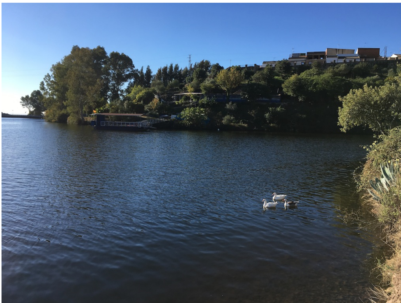
Embalse de Bembezar

Nivel dos- El sábado 30 de septiembre de 2023 vamos a realizar la excursión Kayak y sendero de los Ángeles , una ruta lineal de ida y vuelta de nivel dos bajo de 12 km y 250 metros de desnivel acumulado en subida siguiendo el cauce del embalse de Bembezar. Después de la excursión haremos una actividad de kayak por el pantano. Pondremos autobús desde Sevilla como siempre y se puede llegar en coches particulares.