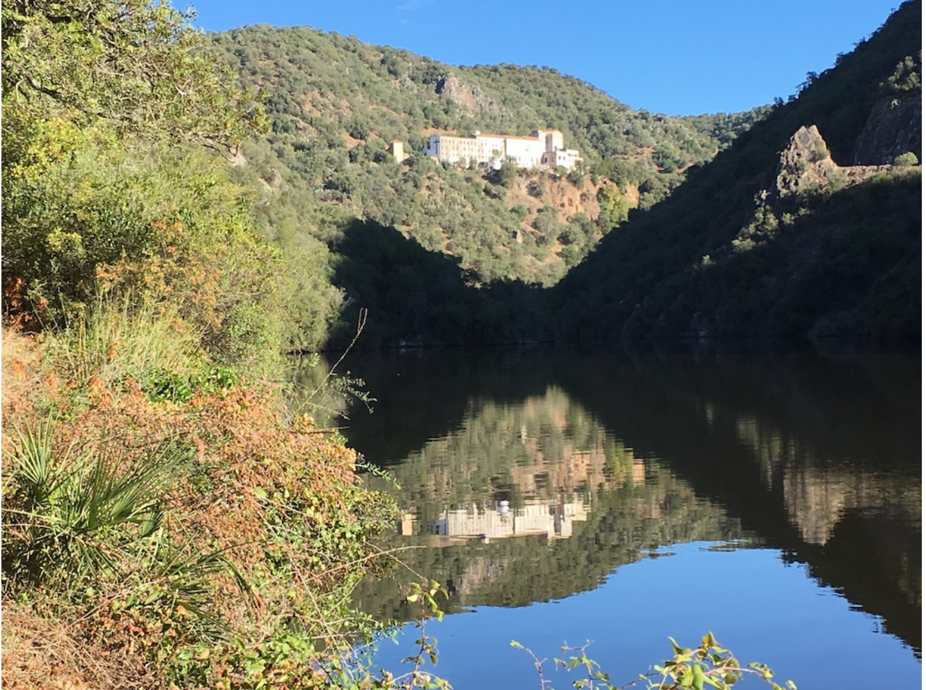
Seminario de los Ángeles

de Córdoba y nos lleva hasta el Seminario de los Ángeles, un antiguo convento construido en una atalaya sobre el Bembezar y que data del siglo XV en honor de la Reina de los Ángeles y que ha llegado a nuestros días deshabitado y proyecto de rehabilitación.