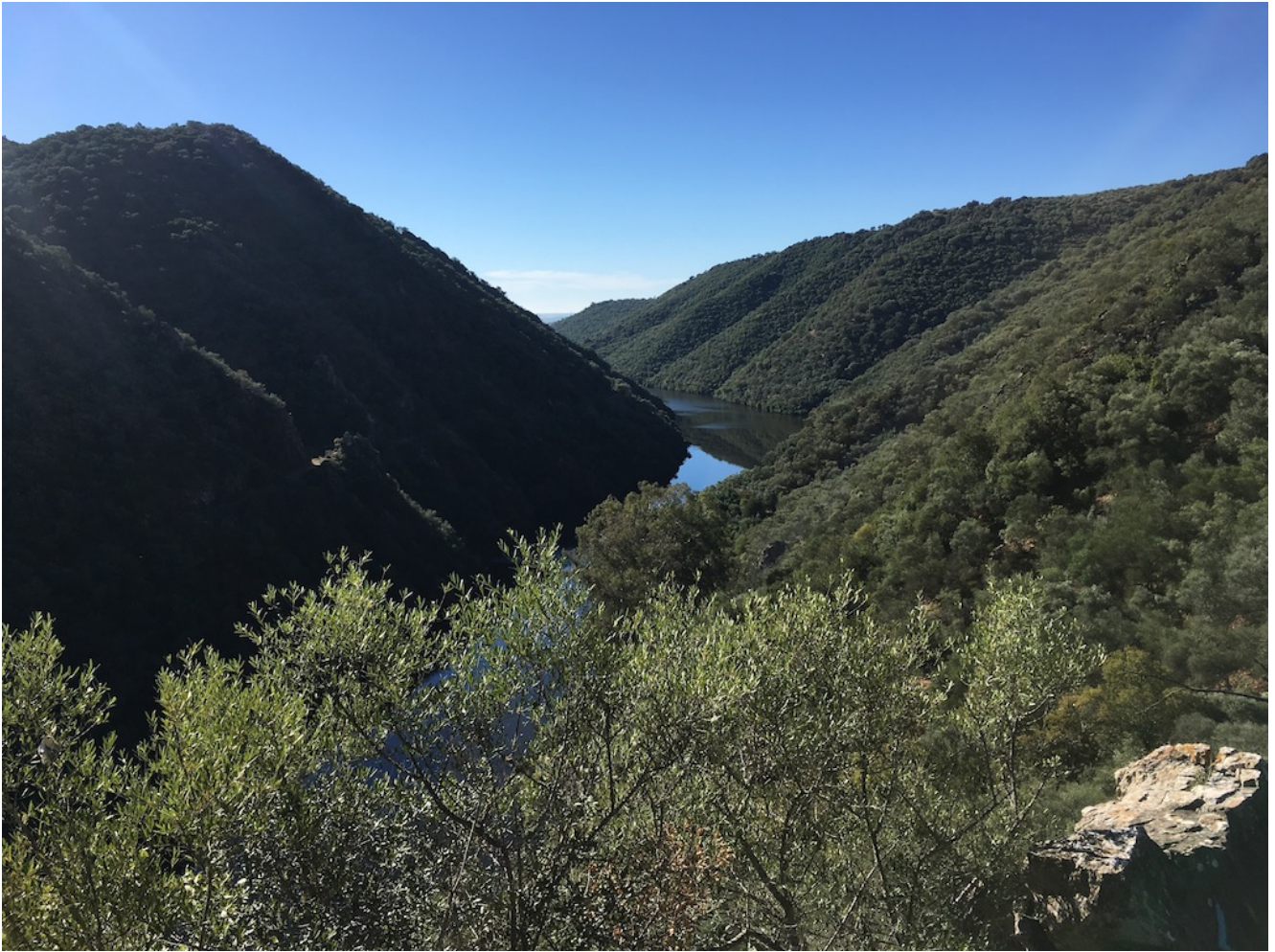
Vista desde la Cruz