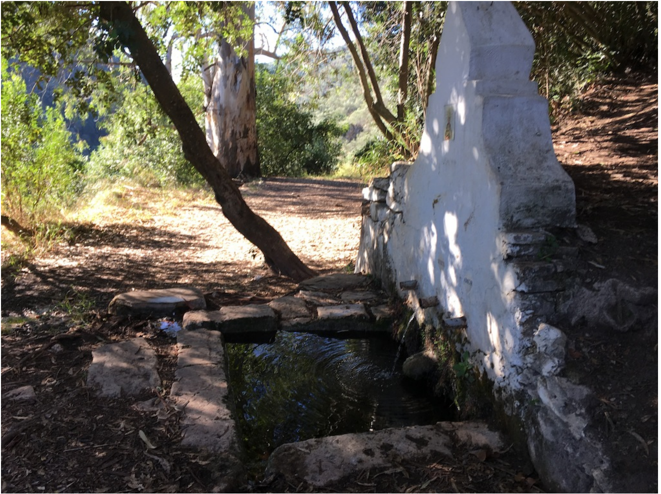
Fuente del Amor, Salud y Amistad

Desde allí hasta la cruz, desde la que las vistas del embalse y el santuario son magníficas. Tras una parada en este lugar seguiremos ruta hasta el santuario donde pararemos a comer los bocadillos que cada uno llevemos.