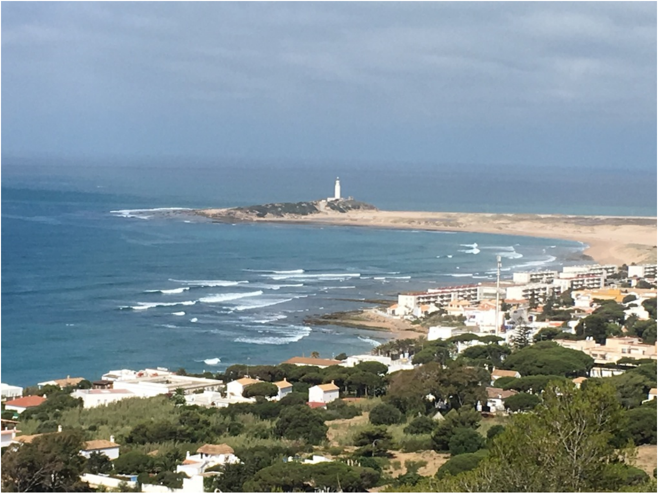
Cabo de Trafalgar

Descenderemos hacia la preciosa población costera de Caños de Meca donde recorreremos por la playa las preciosas calas de esta localidad hasta llegar al Parque Natural de la Breña y Marismas del Barbate para llegar al Sendero del Acantilado.