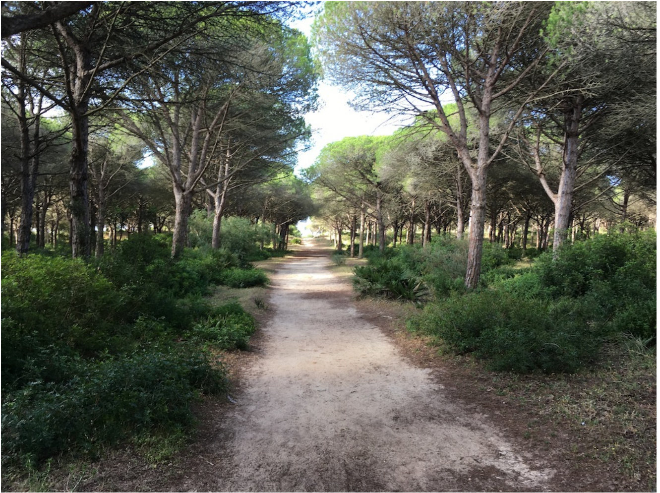
Sendero Torre del Tajo

Pero mención especial queremos dedicar a los aromas de la Breña . El aroma del pino se mezcla con el romero, la lavanda y la melosa dando a este bosque mediterráneo un olor muy peculiar.