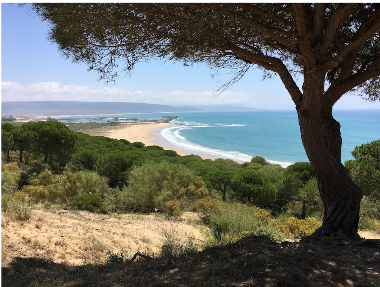
Vista de Barbate

Niveles uno y dos- La Breña de Barbate es una fantástica excursión que, debido a su éxito, volvemos a programar para el sábado 30 de abril . El nivel uno es un bonito recorrido junto al mar de 8,5 km y 116 metros de desnivel positivo acumulado entre las localidades gaditanas de Caños de Meca y Barbate y catalogado de nivel uno. El nivel dos es un recorrido de 14 km y 250 desnivel circular entre Barbate y Caños de Meca. Pondremos un bus desde Sevilla (obligatorio para el nivel uno) y el nivel dos se puede hacer también en coches particulares.