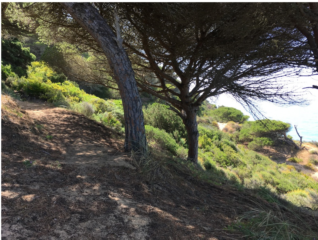
La Breña de Barbate

El Parque Natural de la Breña y Marismas del Barbate se localiza en los municipios de Barbate y Vejer de la Frontera, en la costa atlántica de la provincia de Cádiz. Es un paisaje espectacular que deleita los sentidos, en el que contrastan el verde de los pinos, con el azul del mar y el amarillo de la arena en el camino.