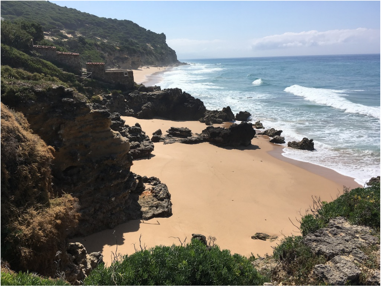
Calas de Caños de Meca

El Sendero del Acantilado tiene 7 kilómetros de longitud y es otra joya de la naturaleza, a 100 metros de altitud recorre la playa de la Yerbabuena un sendero arenoso bajo los pinos piñoneros y enebros costeros, con el mar al fondo reconfortándonos con su brisa. Allí encontramos gaviotas, garcetas y garcillas. Un espectáculo para nuestros sentidos.