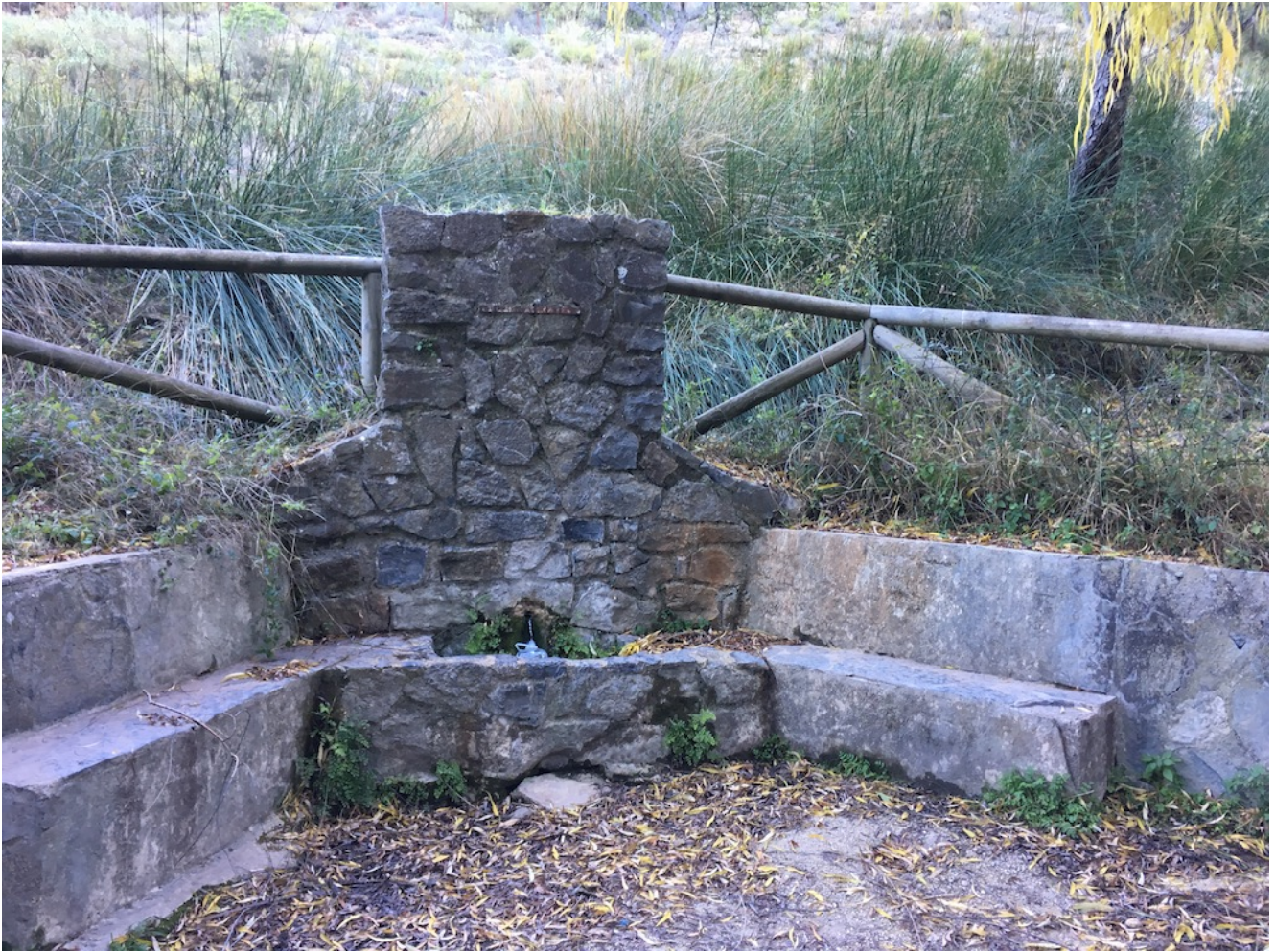
Fuente del Descansadero

Seguimos subiendo y recorriendo bellísimos parajes muy húmedos. Nos desviamos de la senda para llegar a las ruinas de la Torre Árabe, allí con unas vistas fenomenales del Albarracín será el lugar perfecto para nuestro avituallamiento de fruta.