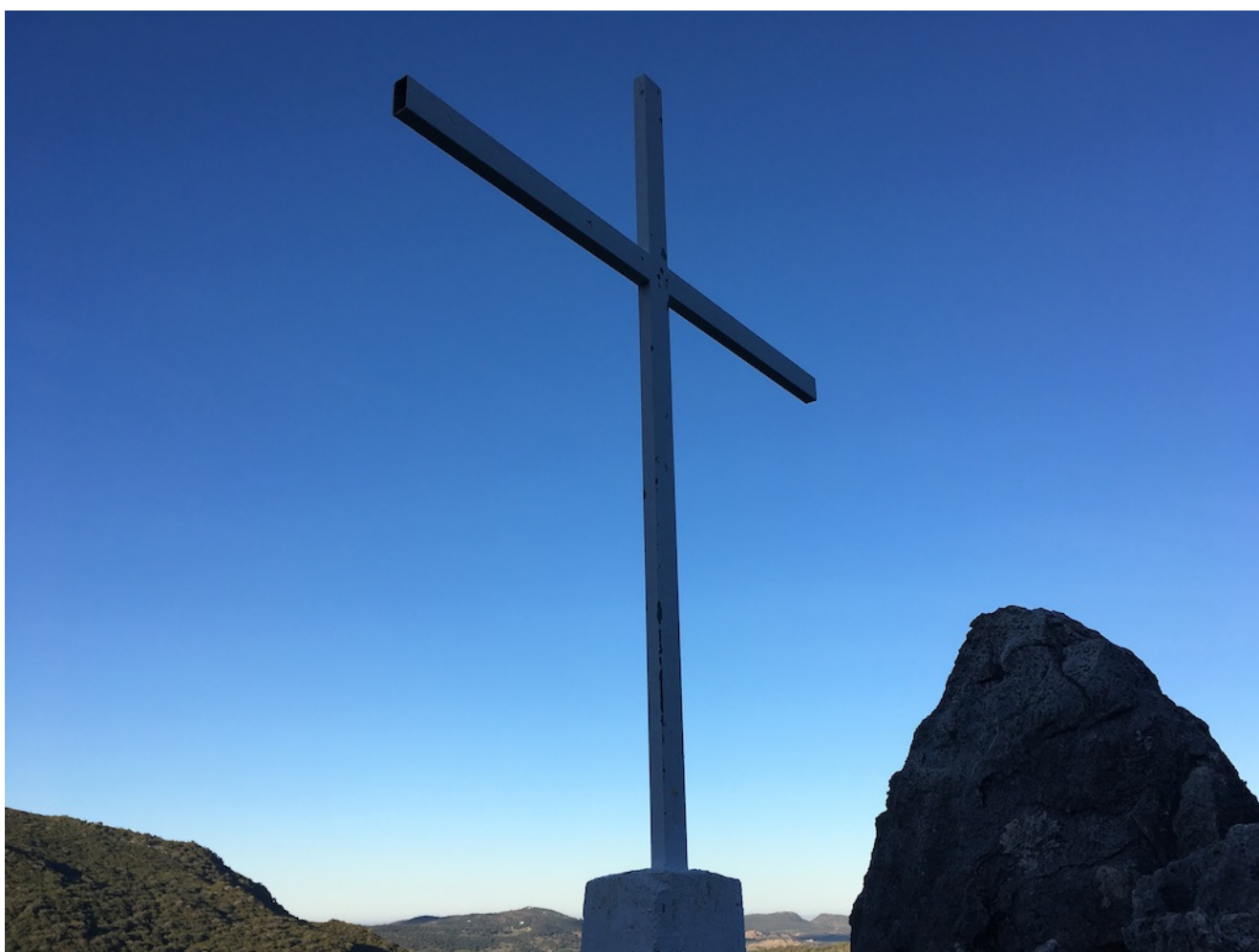
Cruz de la Atalaya

Nivel dos- 11 de Febrero. El domingo 11 de febrero seguimos nuestras excursiones de nivel dos con la circular de La Cruz de la Atalaya, una ruta que comienza y termina en El Bosque pasando por la Cruz de la Atalaya de Benamahoma. Son 17 km y 600 metros de desnivel acumulado en subida que la hacen una preciosa ruta de nivel dos para la que pondremos un autobús desde Sevilla.