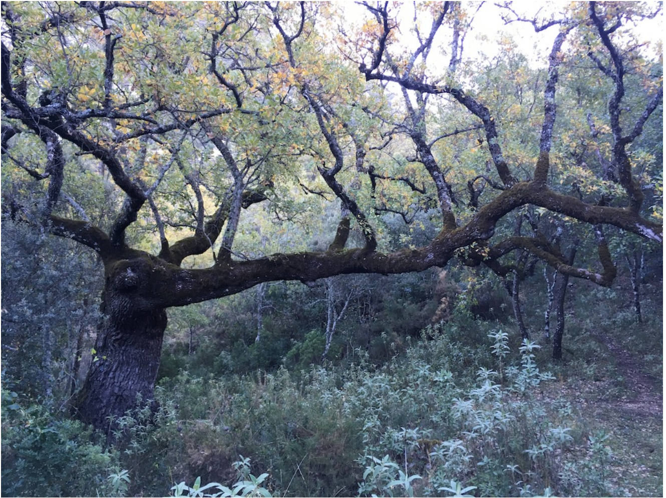
Arbol junto a la Fuente de Tarazón

Otro punto importante del recorrido son las Caleras , que son construcciones antiguas donde se obtenía la cal artesanalmente. Podemos observar varias en el trayecto de hoy, aunque todas han llegado a nuestros días en estado de ruinas.