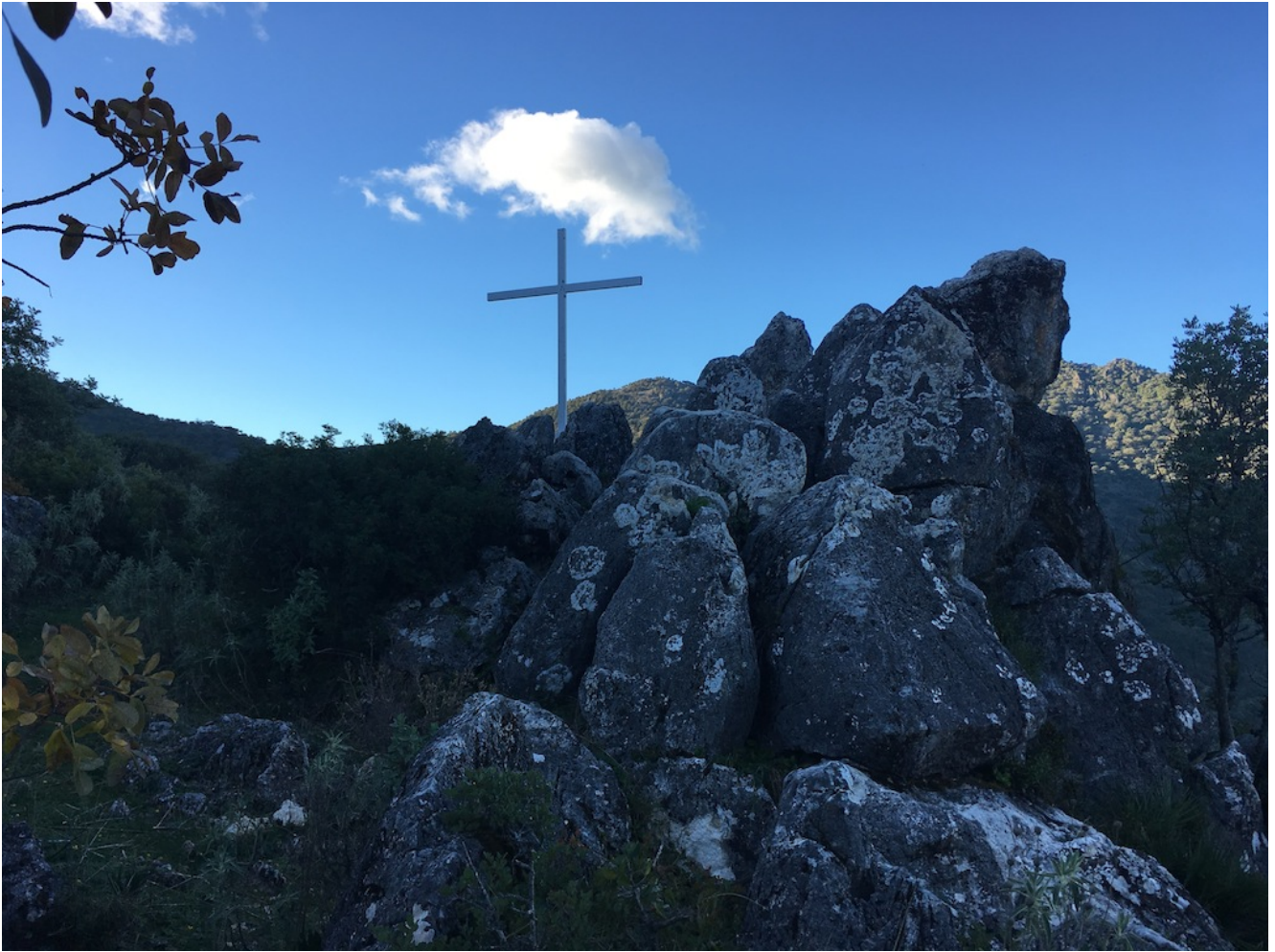
Cruz de la Atalaya de Benamahoma

Bajamos de la atalaya por la plaza de toros de Benamahoma , desde nos dirigiremos al lugar de comida de nuestros bocadillos. Posteriormente terminaremos nuestra ruta circular bajando por el río Majaceite hasta El bosque.