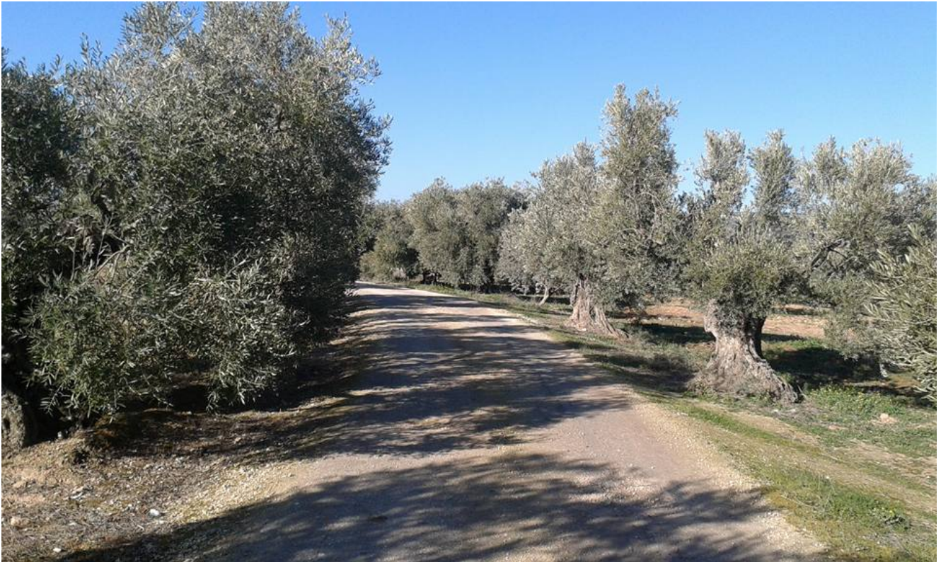
Detalle de la ruta

Pararemos a comer unos bocadillos en el merendero que hay en el camino y después de la excursión los integrantes de la Asociación de Senderismo Andarines nos enseñaran la bonita localidad de Los Corrales.