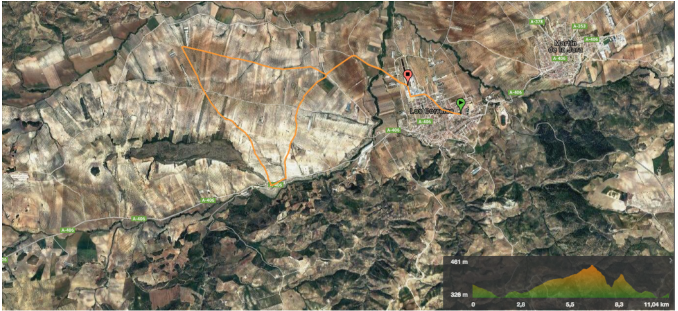
Track de Wikiloc