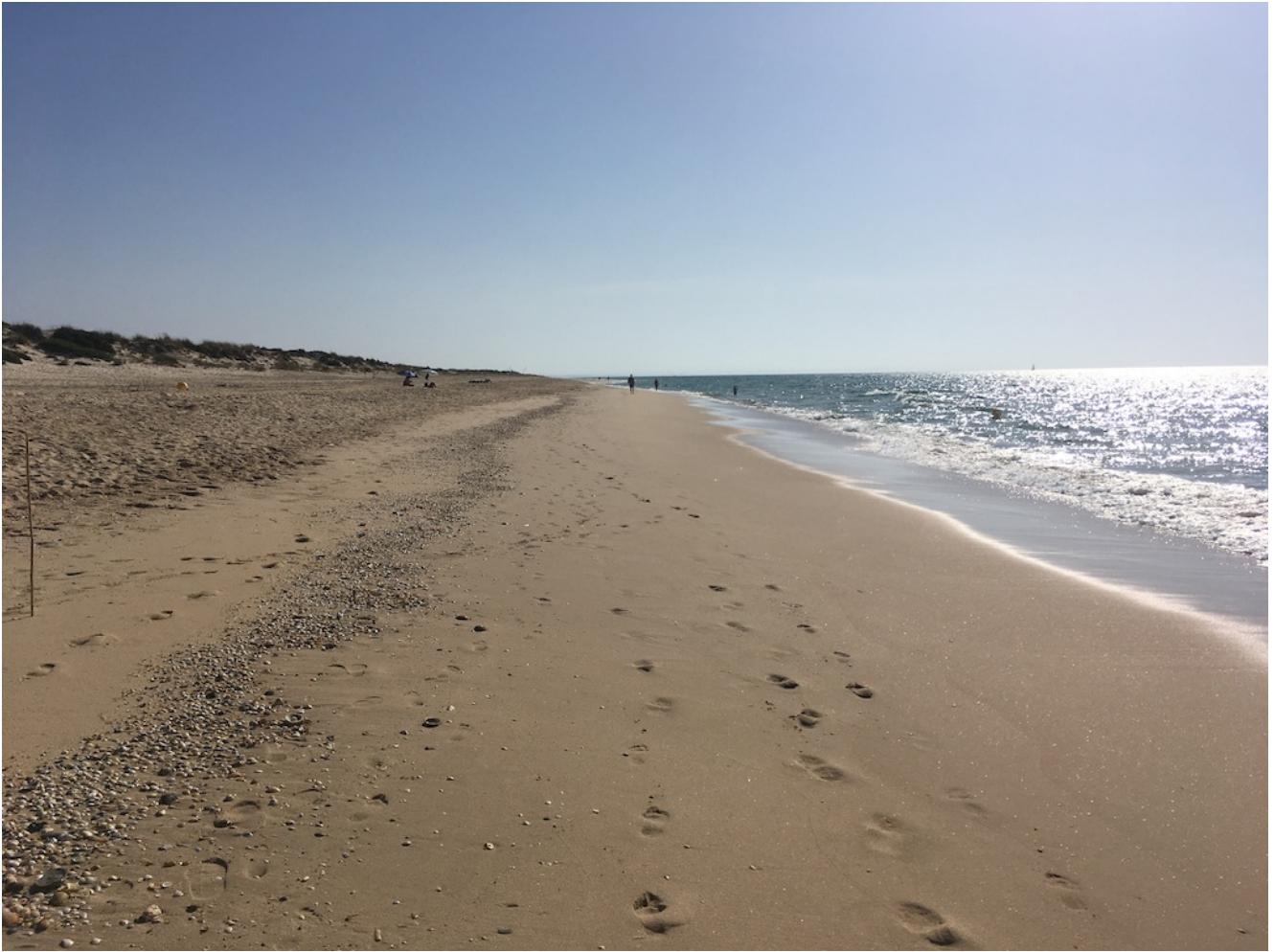
Praia de Terra

La última etapa de la excursión la realizaremos en el Ferry que una Isla de Tavira con Tavira. Son 4,2 kilómetros de agradable paseo por el canal y que nos llevan al puerto de Tavira. Una vez allí cada cual será libre de buscar algún restaurante para probar la especialidad de la zona: el pulpo, o ir hacia los coches para volver a Sevilla.