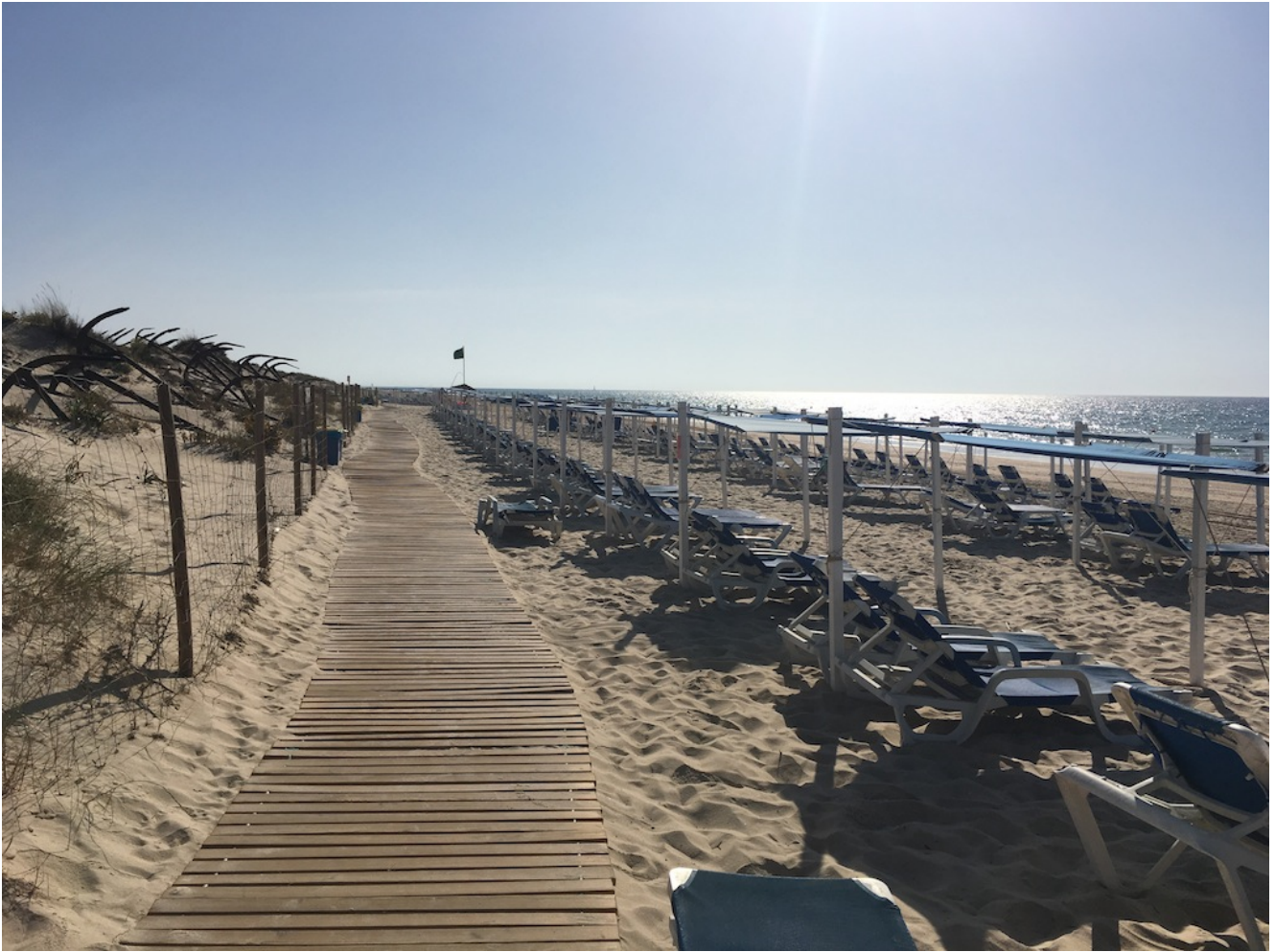
Praia Do Barril

Quedaremos a las 7.30 horas en la Gran Plaza, 7.45 horas en José Laguillo, 8 horas en la Cervecería Ronda el Alamillo pararemos a desayunar y la vuelta será saliendo desde Tavira a las 18 horas.