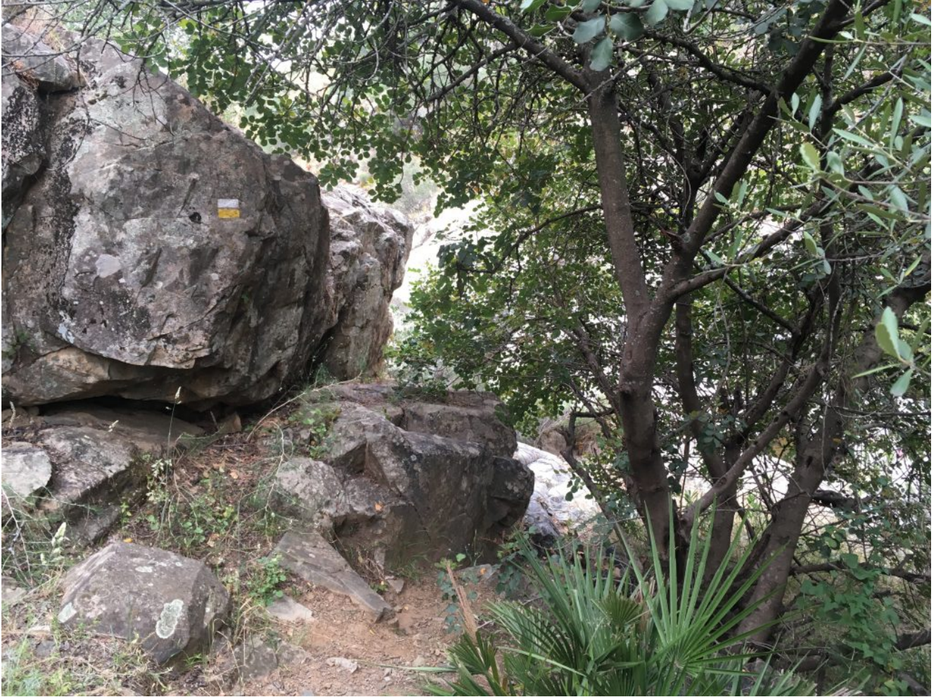
Camino entre granito

El paraje de Las Calderas se compone de cuatro piscinas naturales sobre la roca de granito en las que hay diferentes cascadas y todas estas ollas o calderas está permitido el baño. De hecho nosotros aprovecharemos para reponer fuerzas después con un tentempié que traeremos cada uno.