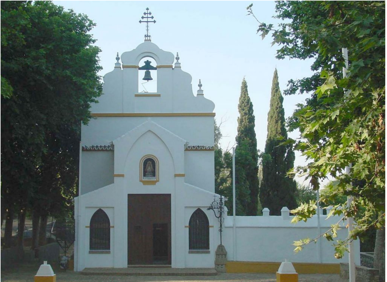
Ermita Aguas Santas

Seguimos por el Parque Forestal Javier Tirado (toma su nombre de un forestal muerto en la extinción de un incendio) y cuya entrada vemos en la imagen de abajo y tomamos un sendero que se va adentrando en la espesura hasta llegar al arroyo de los Siete Arroyos donde iremos recorriendo las distintas ollas que componen las calderas.