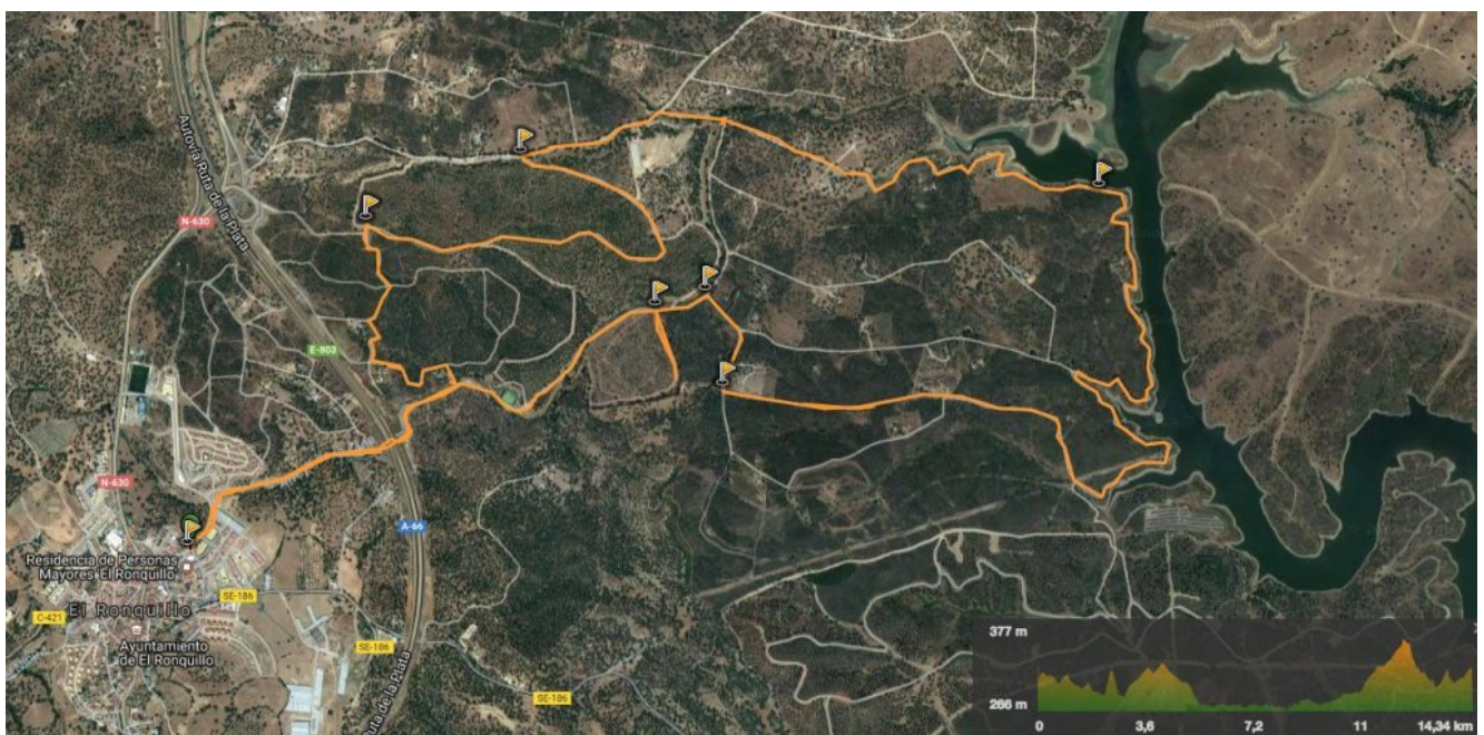
Perfil de la Ruta Los Brezales