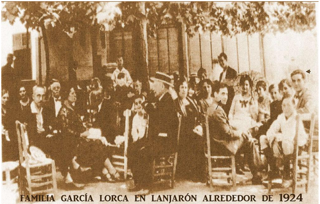
FAMILIA GARCÍA LORCA EN LANJARÓN ALREDEDOR DE 1924