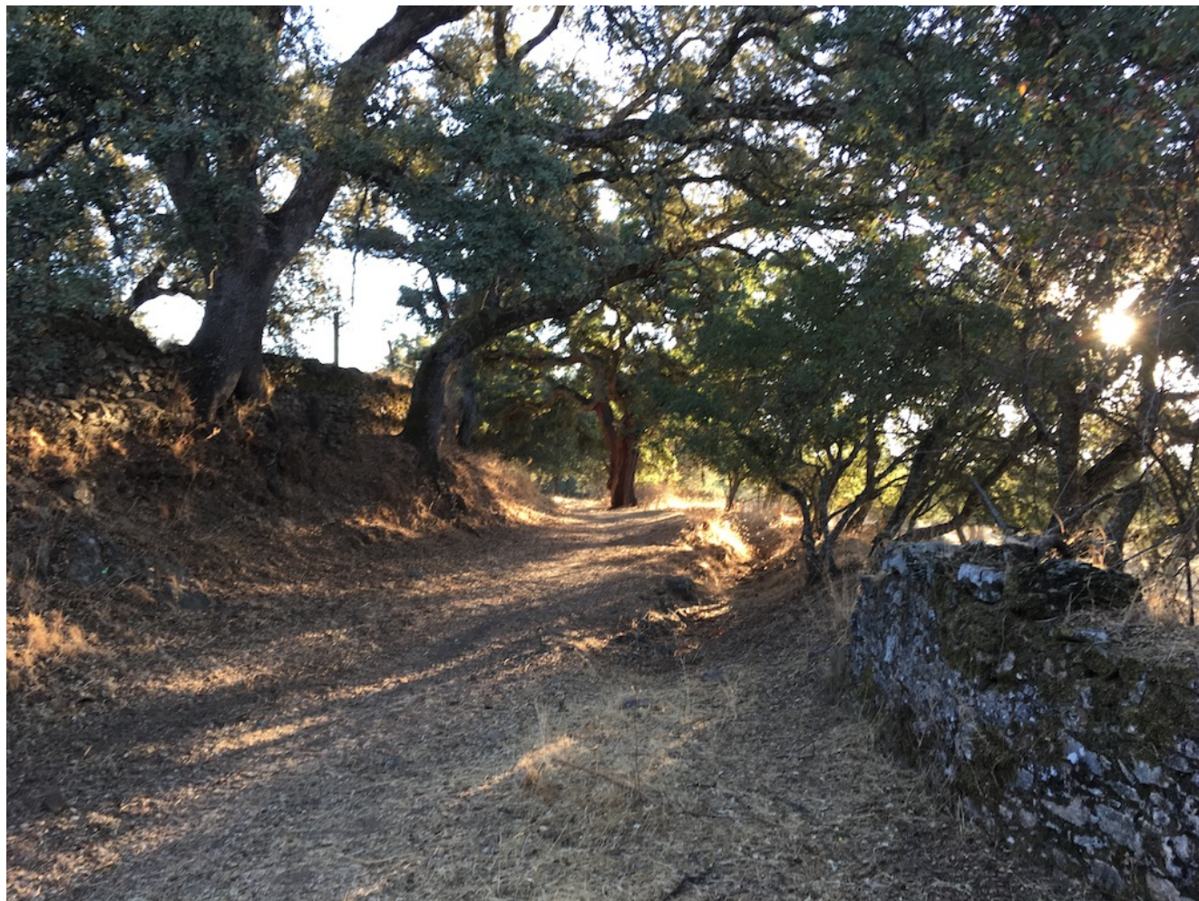
Sendero entre alcornoques

piedra, vallados y pequeñas huertas hasta que progresivamente se va estrechando y discurre flanqueado por encinas y alcornoques de gran porte, a veces en el mismo centro del sendero.