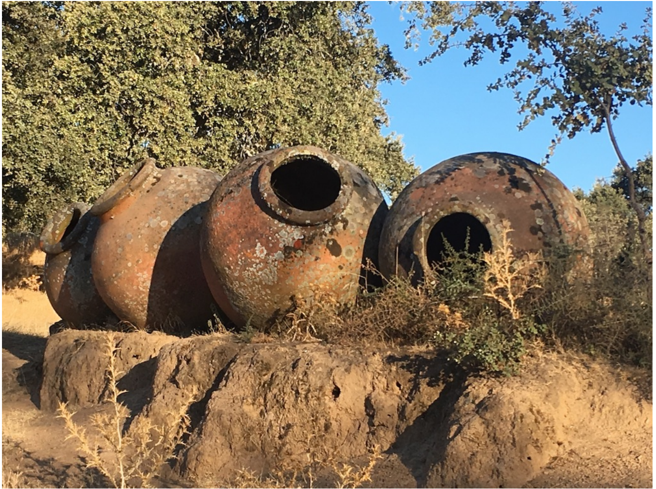
Estampas del camino