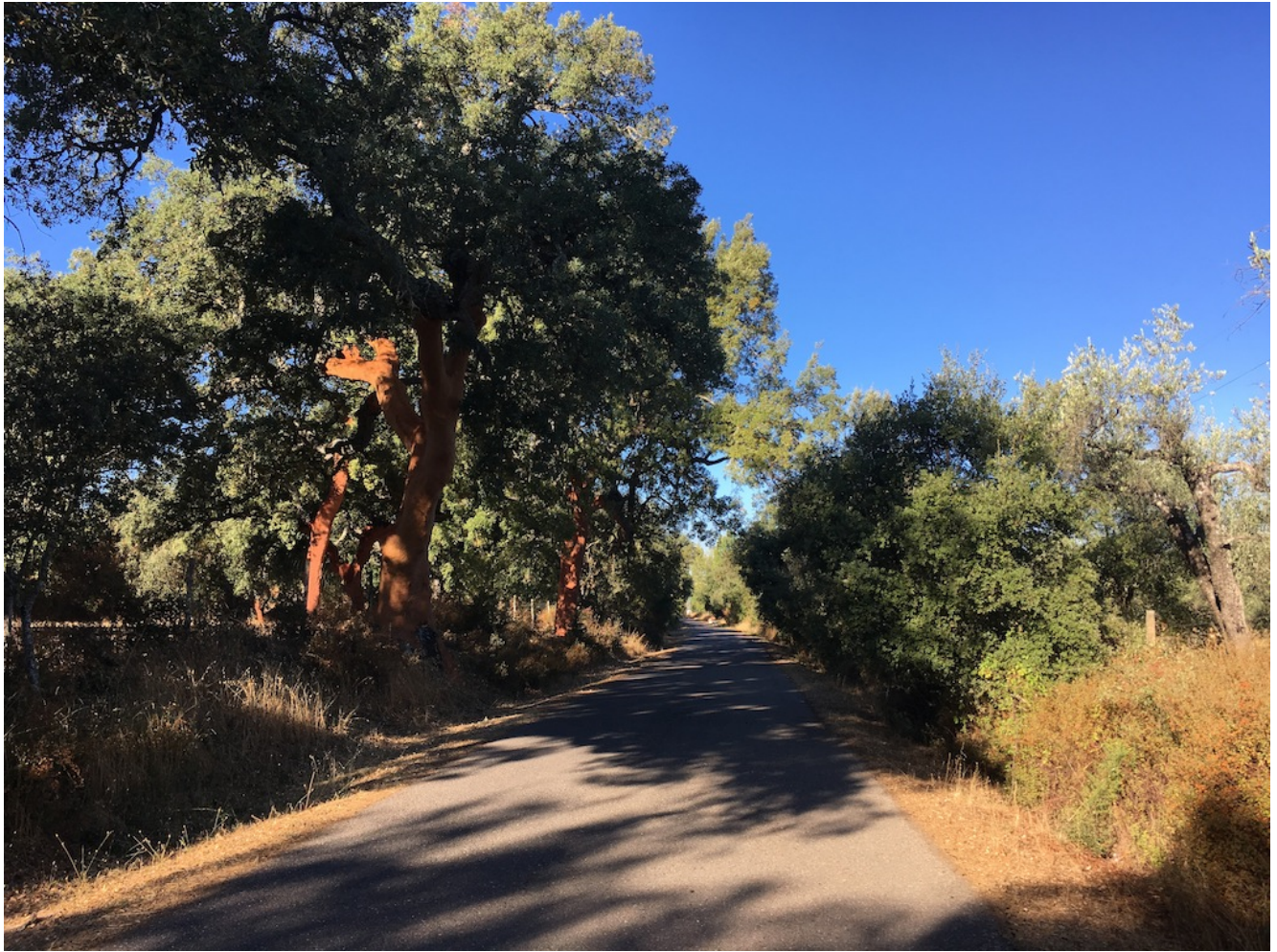
Carril de las Navas