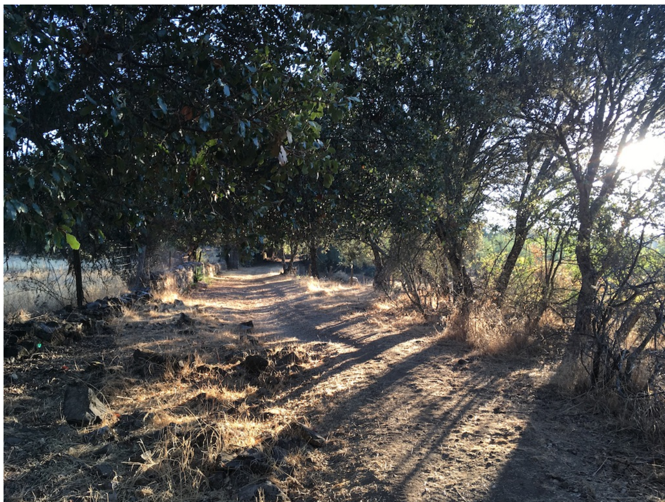
Senderos los Carros de Alanís

Nivel uno- Jueves 15 de mayo de 2025. Conoce la Naturaleza de Nuestra Provincia: Los Carros de Alanís es una excursión circular de nivel uno de unos 9 km de longitud y 85 metros DAP. Es ideal para principiantes y para realizar de forma consciente. Pondremos transporte desde Sevilla para el desplazamiento y se podrá venir en coches particulares.