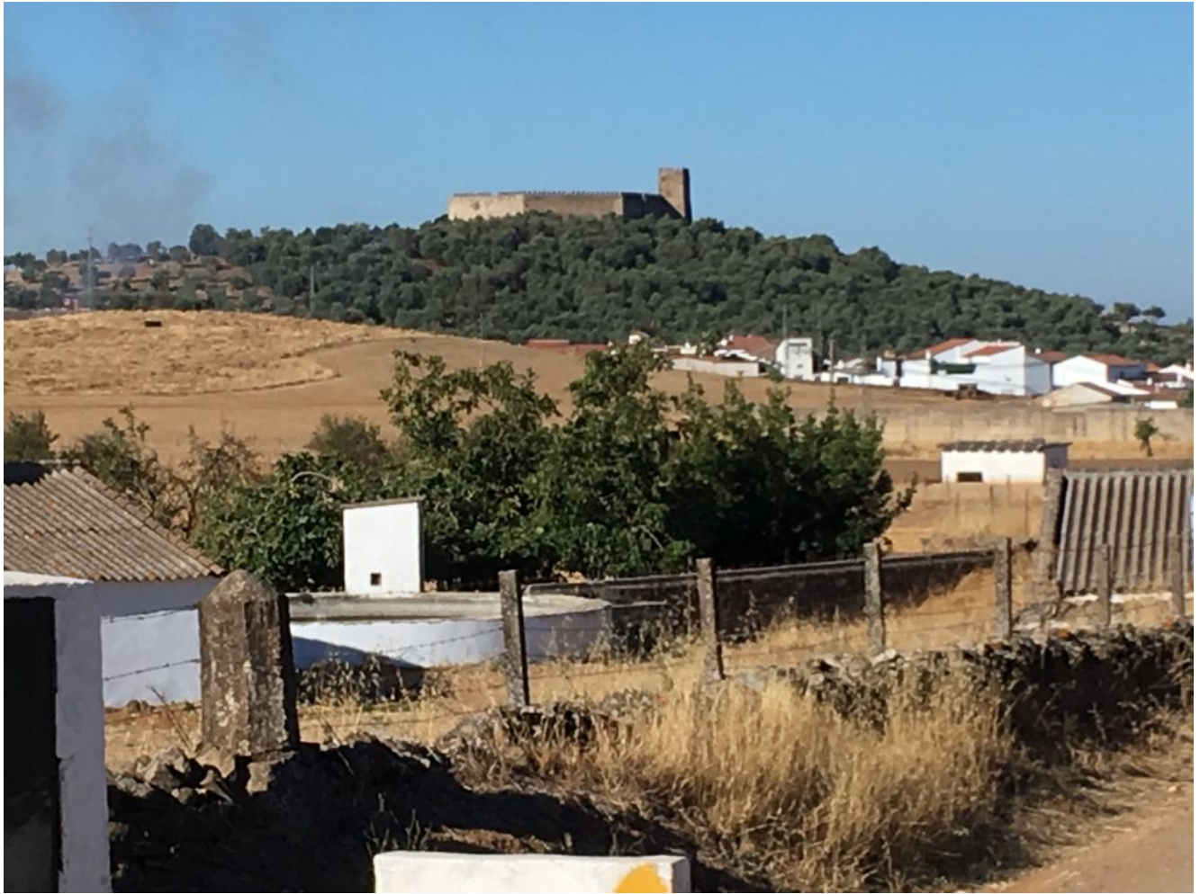
Castillo de Alanís al fondo

El precio de esta excursión con transporte es de 32€ y 18€ sin transporte (socios y niños 10€ menos). Para venir con nosotros tienes que realizar el proceso de inscripción para ello tienes que hacer el pago por transferencia en nuestra cuenta Banco Sabadell ES84 0081 7302 8200 0146 1452y envíanos el resguardo al mail ( info@senderismosevilla.net ) con tu nombre y apellidos, número de DNI, fecha de nacimiento y un móvil de contacto. Sobre las 16 horas regresaremos al autobús que nos traerá de nuevo a Sevilla.