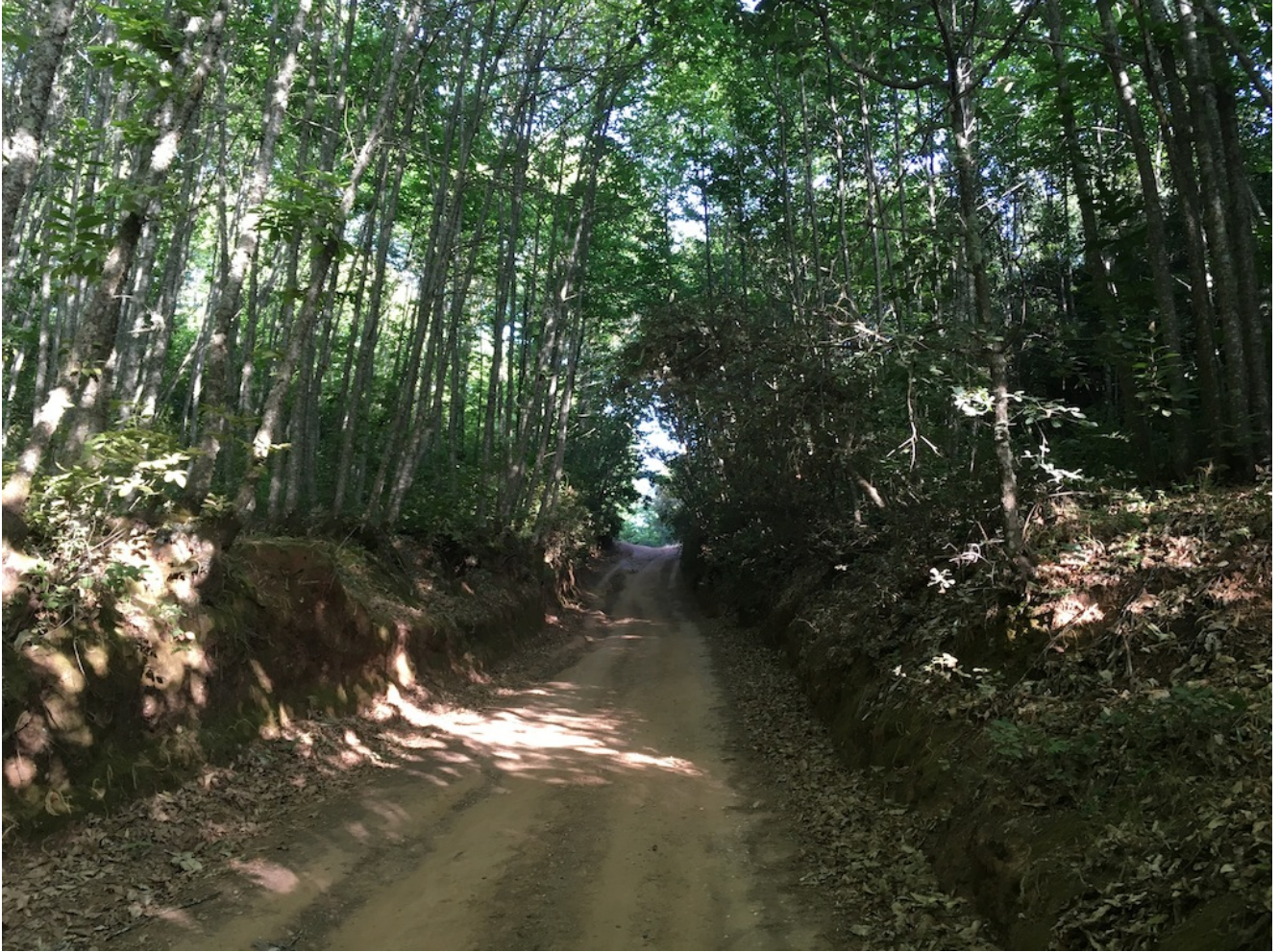
Castaños en Costantina

Debido a las obras cambiamos el punto de encuentro para los que vienen en coche el sábado 30 de septiembre a las 10.00 horas. Antes era Ayuntamiento de Constantina, el punto de encuentro pasa a ser el Paseo de la Alameda, en el lugar que vemos en la imagen de abajo y cuyas coordenadas GPS son 37.877997, -5.621803. Para los que vengan en autobús en las paradas habituales que detallamos al final de este artículo.