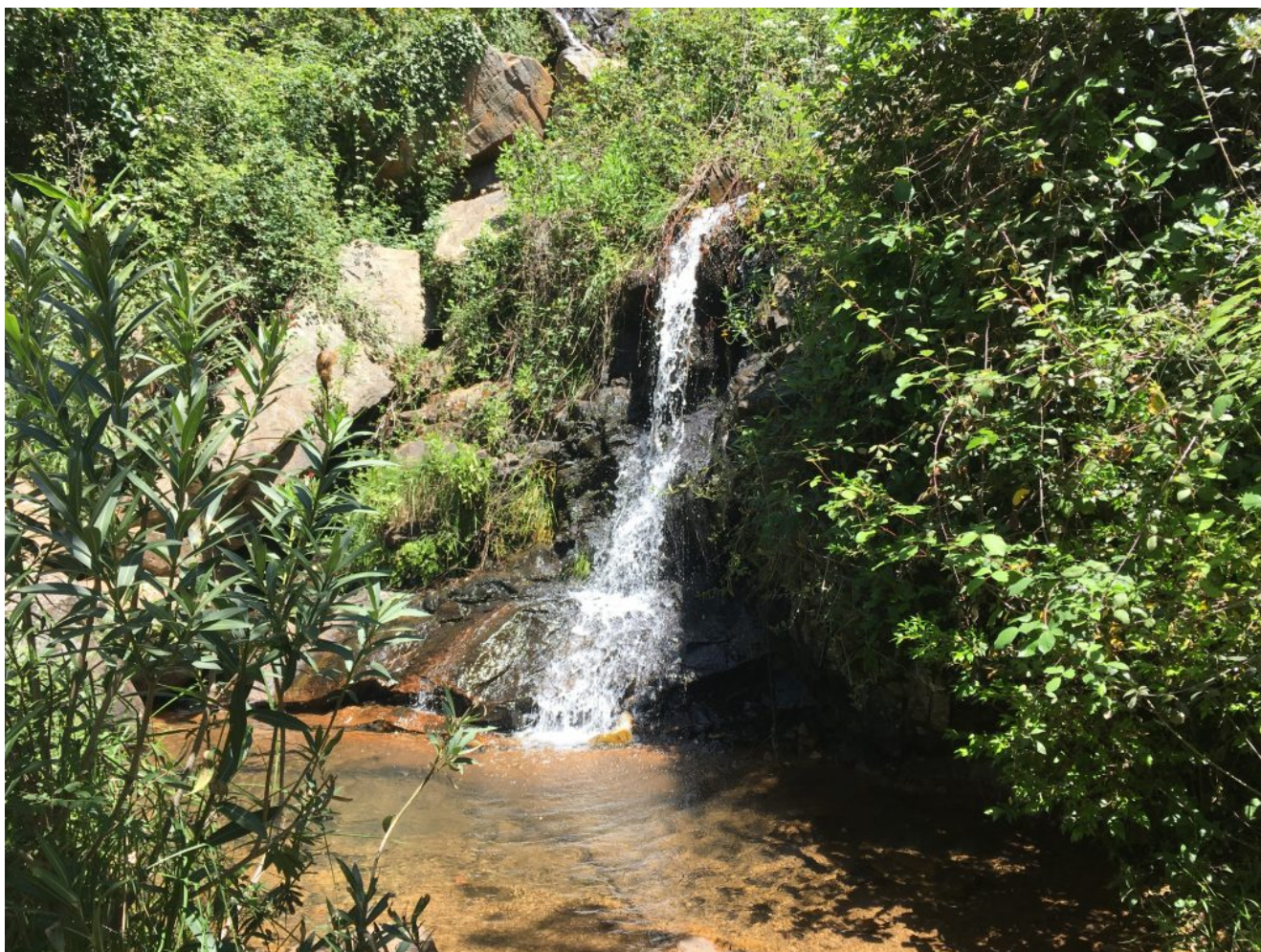
Chorros del Joyarnacón

Nivel dos: El jueves 7 de abril vamos a realizar un sendero en Santa Ana la Real: Los Chorros de Joyarancón . Además visitaremos el Bosque de las Letras, haciendo un ruta de las que hacen afición. Es una circular de 10 kilómetros y 250 metros de desnivel para la que pondremos un bus desde Sevilla además de poderse acceder en coches particulares.