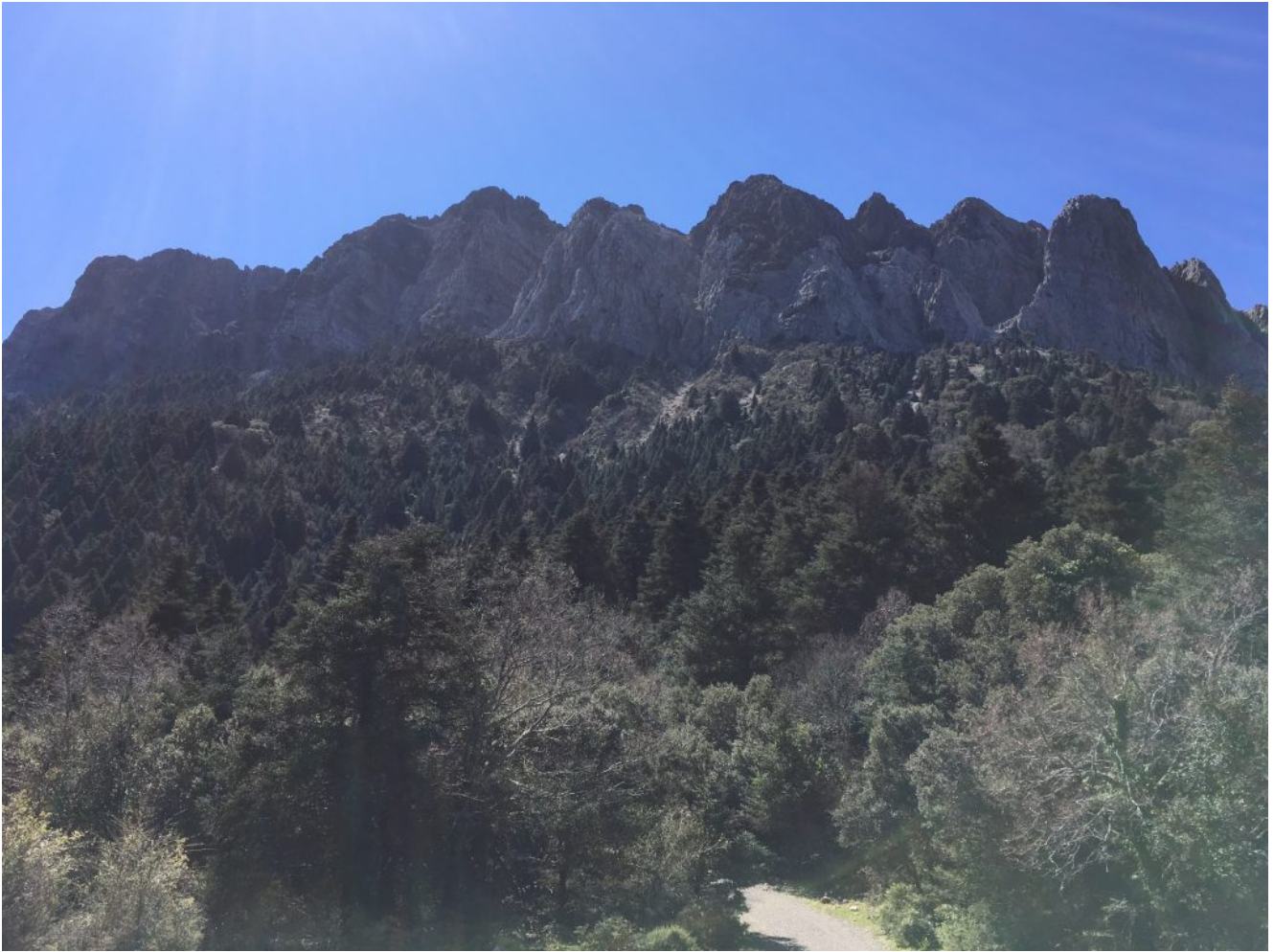
Pico del Torreón

Los del nivel tres bajaran en el pueblo de El bosque, harán el Majaceite y comenzarán una dura ascensión hacia el Pinsapar. Hacer esta etapa al revés requiere cierta preparación en la subida de cuestas, siendo muy importante el conseguir un buen ritmo constante de subida. Cuando pasamos el Llano de los Vientos, donde tomaremos nuestra fruta, la cosa se complica hasta llegar al Pinsapar. De ahí cuesta abajo hasta el parking del Pinsapar. Intentaremos llegar a tiempo de comer en El Bosque con nuestros compañeros (dependerá de los ritmos de los grupos).