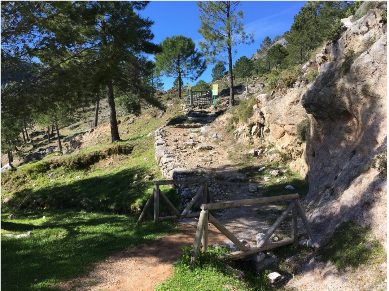
Comienza la subida al Puerto de las Cumbres