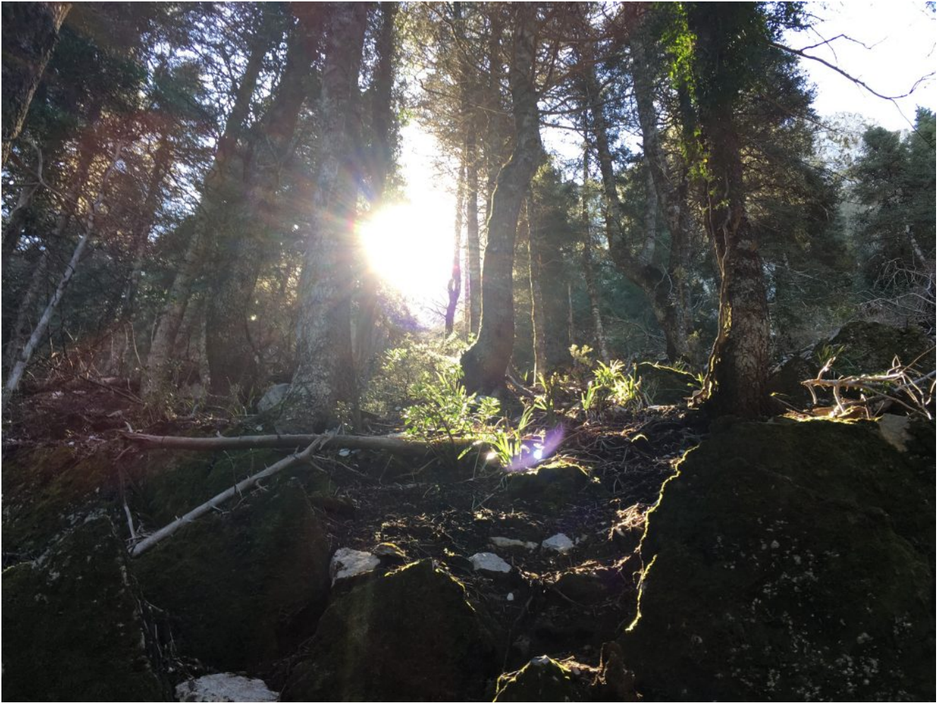
Bosque de Pinsapos

Es una reliquia descendiente de antiguas especies cuaternarias y está emparentado con algunas especies de abetos del norte de Marruecos pero endémica de estas zonas de Andalucía. Su hábitat son las laderas de las montañas protegidos del sol y el exceso de luz y en sus bosques hacen que descienda la temperatura, por lo que es ideal para recorrer en esta época del año. Están en peligro de extinción por lo que pedimos por ellos especial respeto y protección.