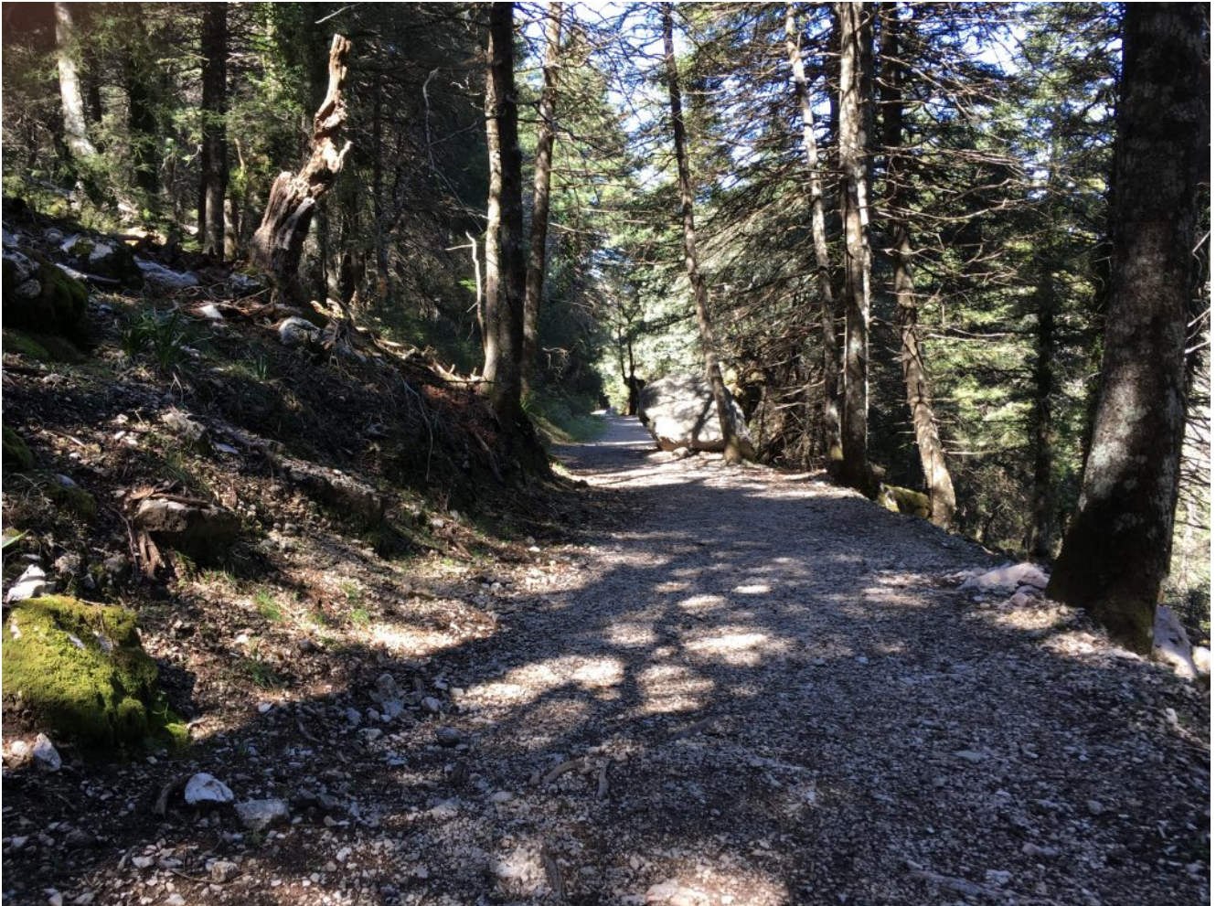
Saliendo poco a poco del Pinsapar

forestal. Vamos dejando atrás los pinsapos y encontrando especies de pinos y quejigos. Llegamos al lugar conocido como el Llano de los Vientos situado a escasos metros del Puerto del Pinar, un buen lugar para la parada de avituallamiento (que no de comida).