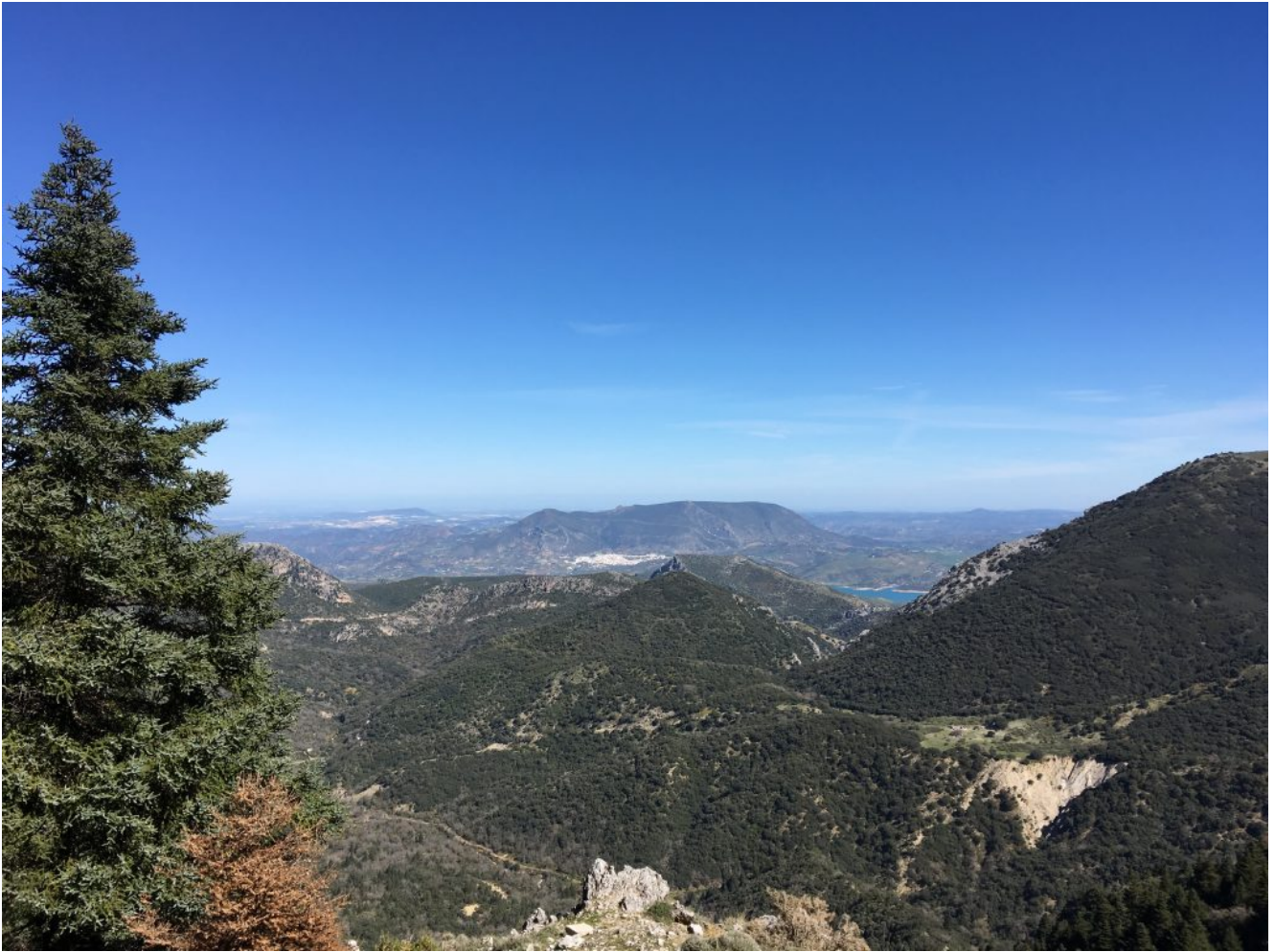
Vista de Zahara de la Sierra