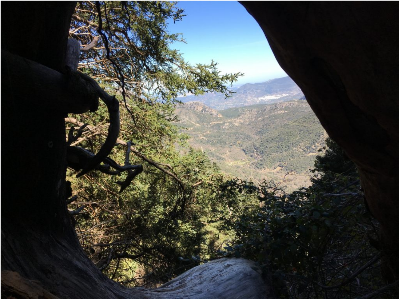
Paisaje entre troncos