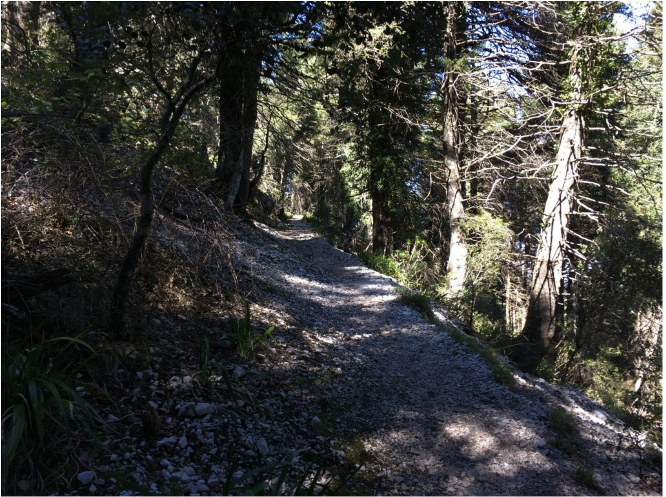
Sombrío camino entre pinsapos