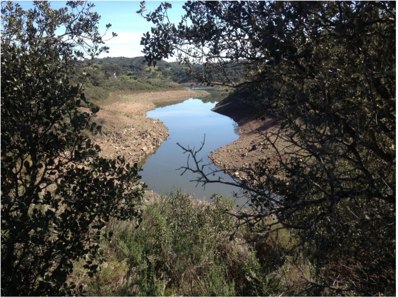
Embalse de Cala