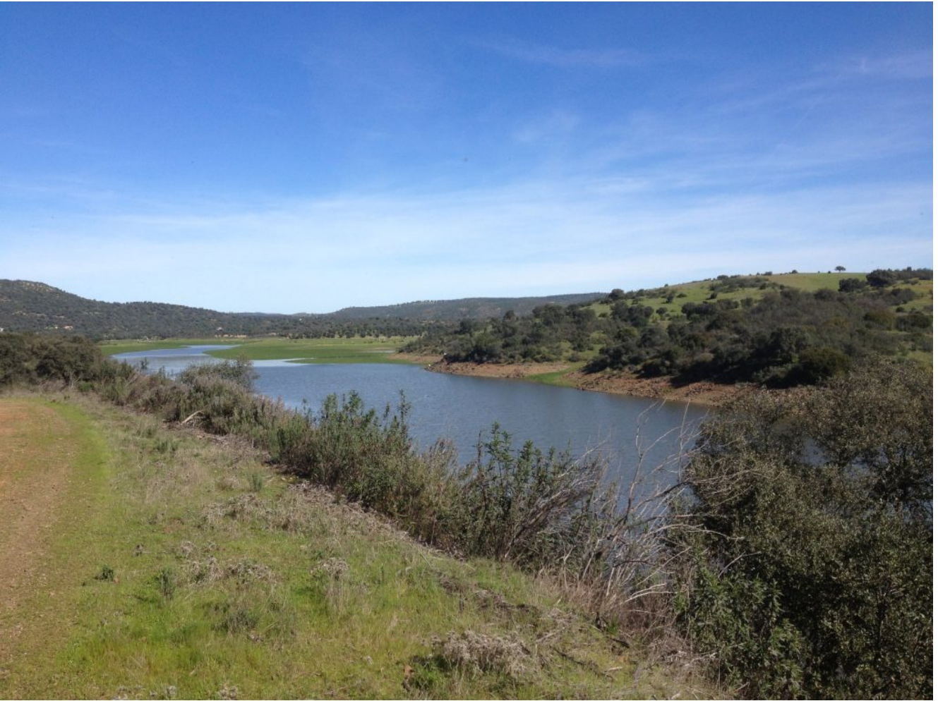
Vista del Embalse de Cala