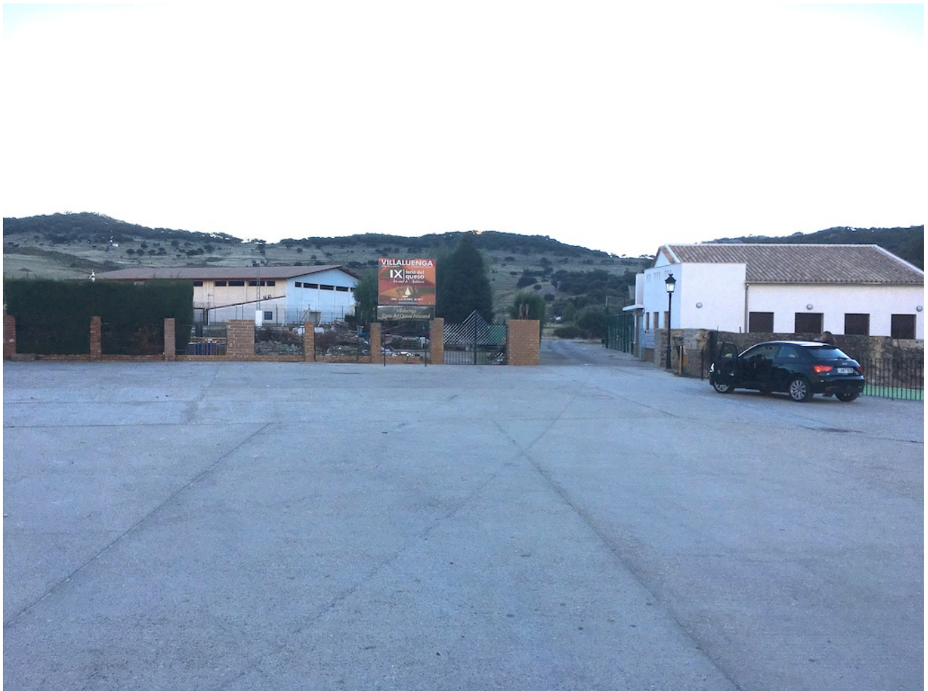
Lugar de quedada

Para la recogida en nuestro transporte quedaremos en nuestras habituales paradas: 7:30 Gran Plaza (marquesinas del bus junto a la boca de metro), 7.45 José Laguillo (puerta del Hotel Catalonia Santa Justa) y 8.00 Cervecería Ronda el Alamillo. Recomendamos llegar antes de la hora porque el transporte sólo espera 5 minutos de cortesía como máximo. Pararemos a desayunar por el camino. Quedaremos a las 10.45 horas en la calle Albarada que es el lugar que se ve en la imagen y cuyas coordenadas de GPS son 36.696954, -5.381215.