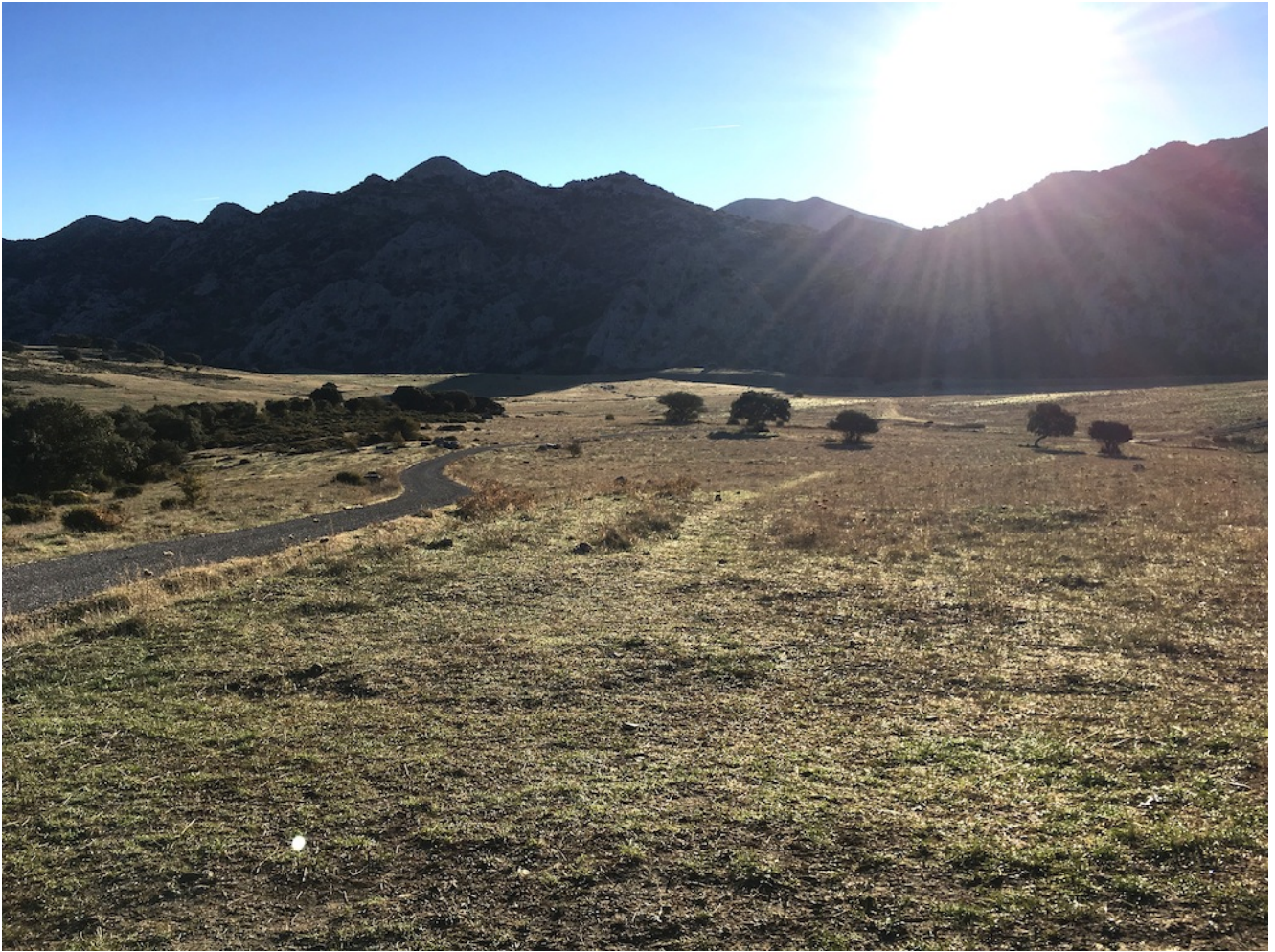
Sierra de Líbar con el Torcal de Cancha Bermeja

Recorreremos los Llanos del Republicano para llegar a la falda del macizo de Líbar, donde encontraremos la Sima del Republicano profundo orificio por el que se cuele el agua, actuando como un desagüe natural del valle.