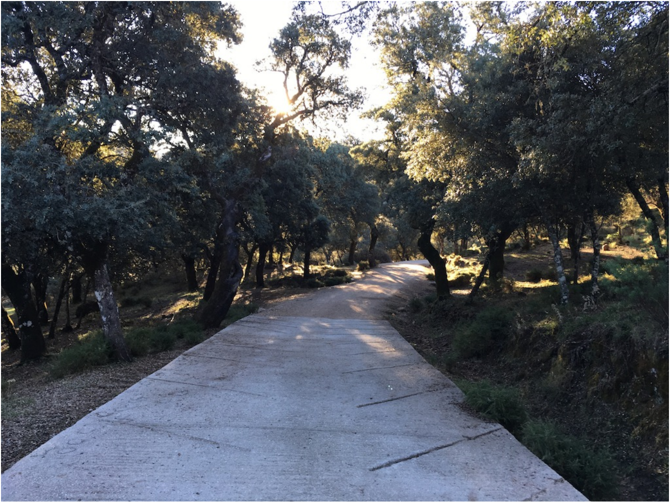
Camino de los llanos entre encinas

Cuando llegamos a los Llanos del Republicano una preciosa vista de la Sierra de Líbar con el Torcal de Cancha Bermeja se alza ante nuestros ojos . Es un valle de naturaleza caliza de grandes dimensiones, alargado y cerrado por laderas escarpadas.