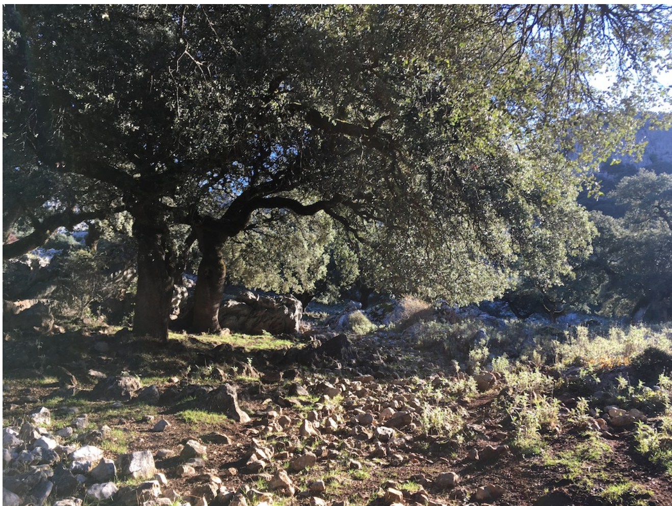
Sierra del Mojón Alto

Nivel uno- Domingo 5 de marzo de 2023. Los Llanos del Republicano es un nivel uno de 10 km y 190 metros de desnivel acumulado en subida. Si te gusta la Sierra de Grazalema y no estás preparado para grandes cumbres esta es un buena excursión para ti ya que une el precioso paisaje de esta sierra con una ruta bastante sencilla de realizar, siempre teniendo en cuenta que es un nivel uno alto. Como siempre pondremos un bus desde Sevilla y permitiremos también el llegar con coches particulares.