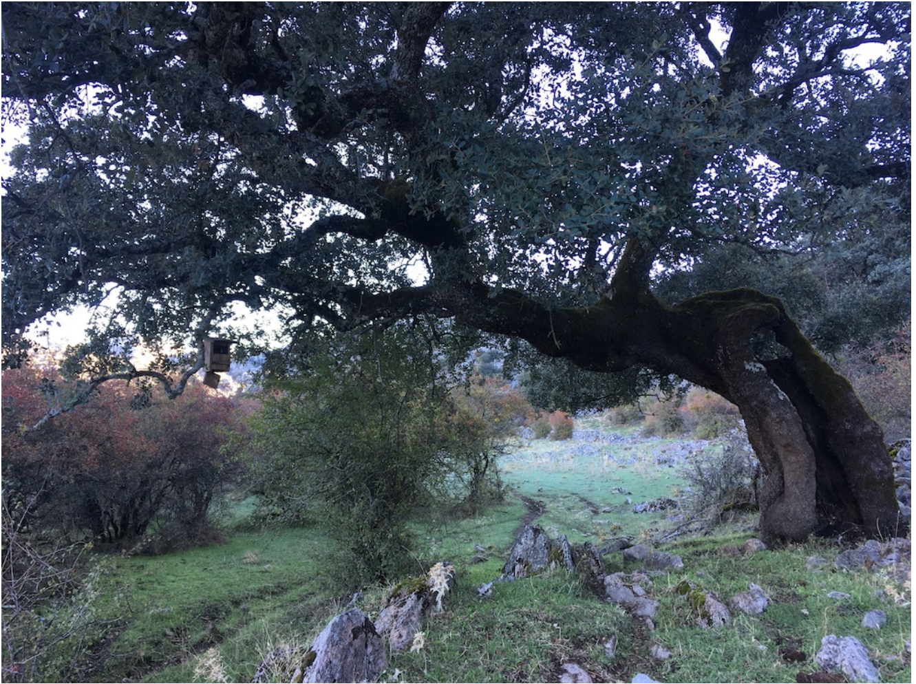
Llegando a la Sima del Republicano