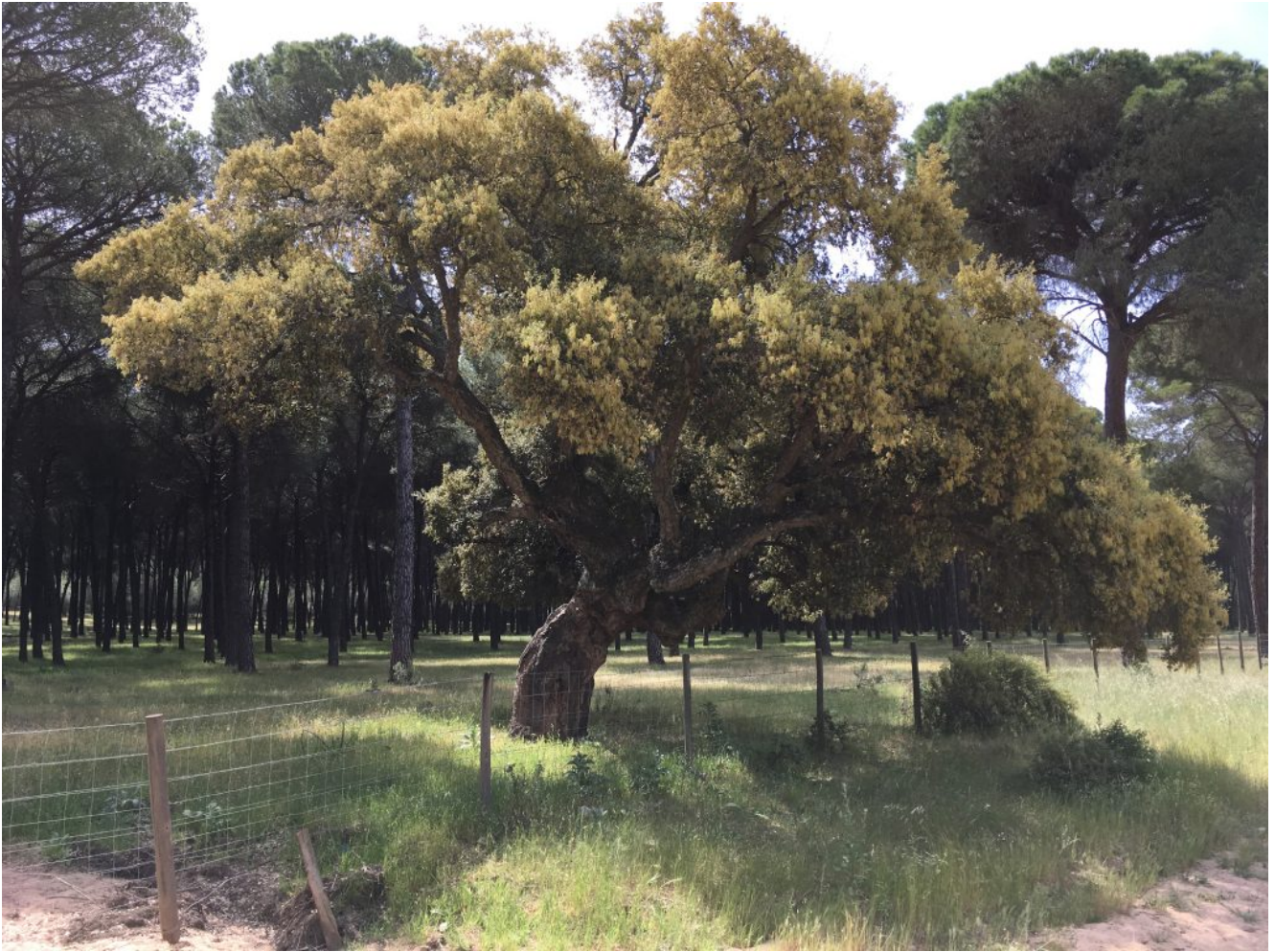
Multitud de especies vegetales