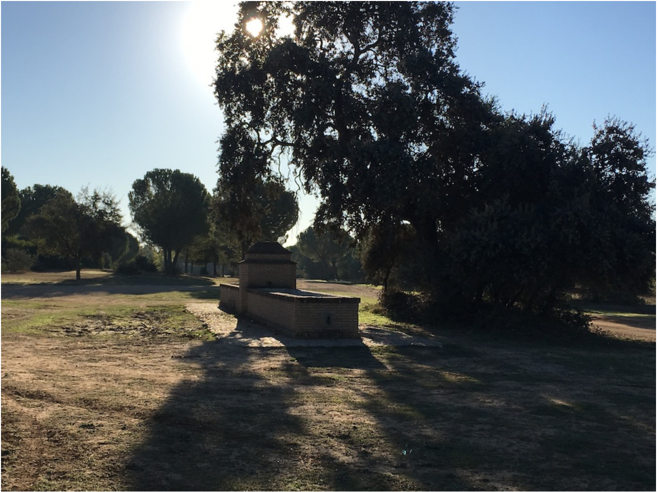
Vado del Quema

Poco a poco irá oscureciendo conforme vamos llegando al Vado del Quema. Esperamos llegar allí sobre las 21 horas y la hora de oscurecer es la 21.45. Esperaremos ese rato cenando unos bocadillos (que traeremos cada uno) untos junto al río Guadamar.