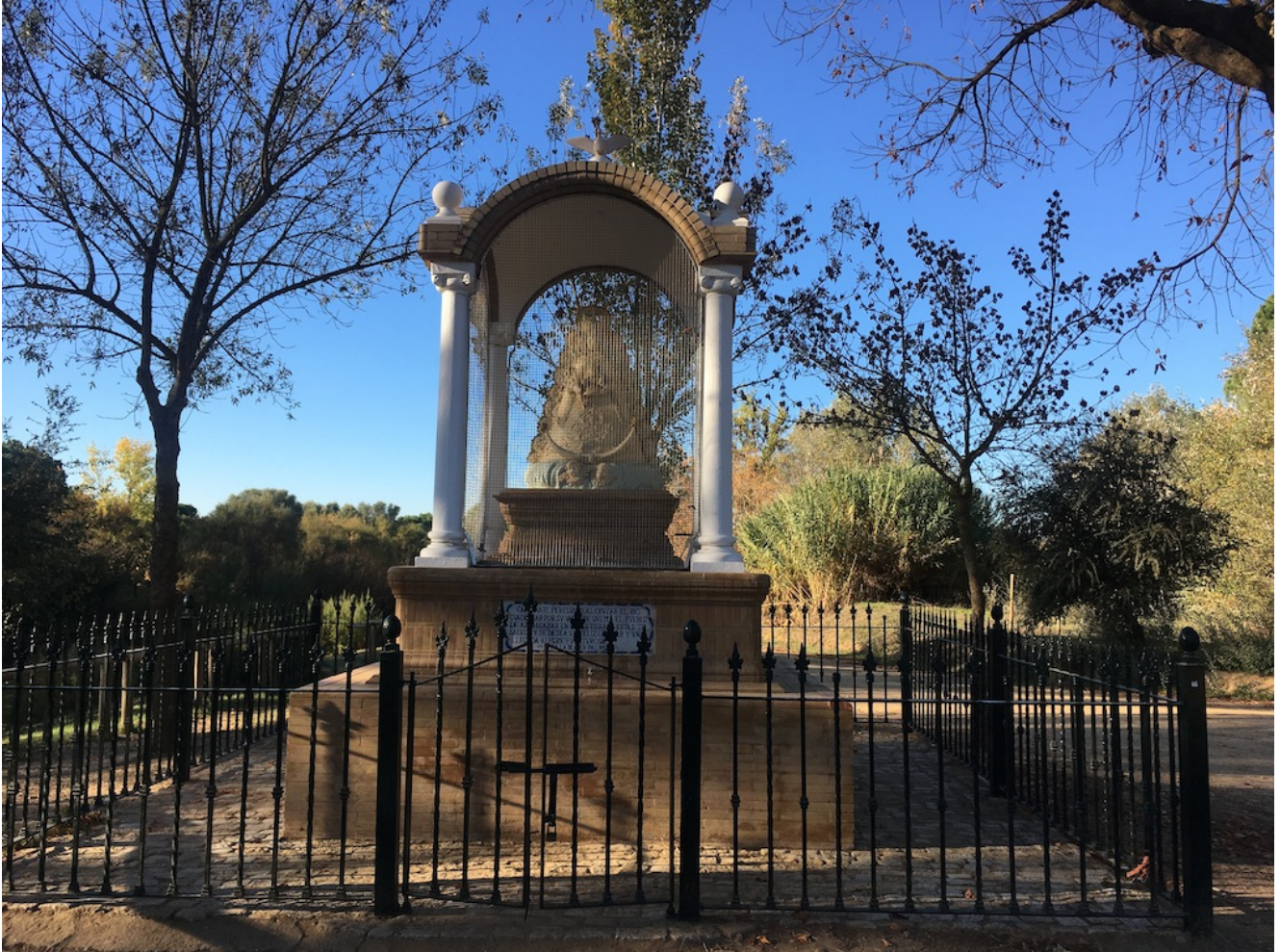
Virgen del Rocío

hermandades, acuden cada año en peregrinación a la ermita de El Rocío, para rendir pleitesía a la Virgen del Rocío.