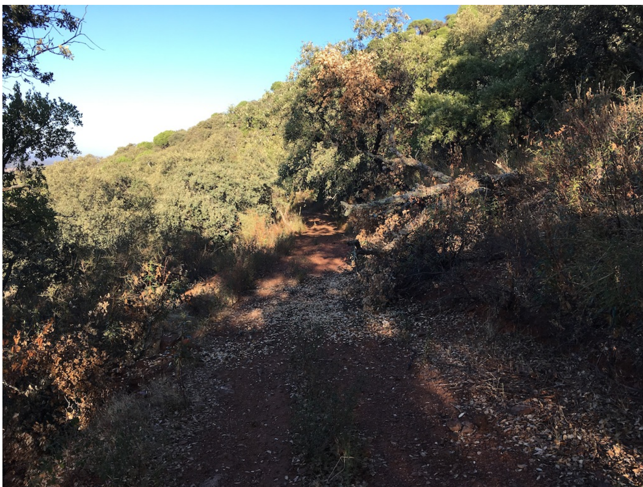
Tramo de la ruta

zona granítica de El Pedroso para conocer sus berrocales. La ruta se inicia a las 10:00 en la explanada de la estación de ferrocarril de El Pedroso, junto a la Oficina de Turismo de la Sierra Norte, donde seguimos un camino verde que nos lleva al inicio del sendero, por el que caminaremos durante 8km por la zona granítica de El Pedroso (Batolito y Berrocales) y un típico ecosistema de Dehesa junto al arroyo de las Cañas.