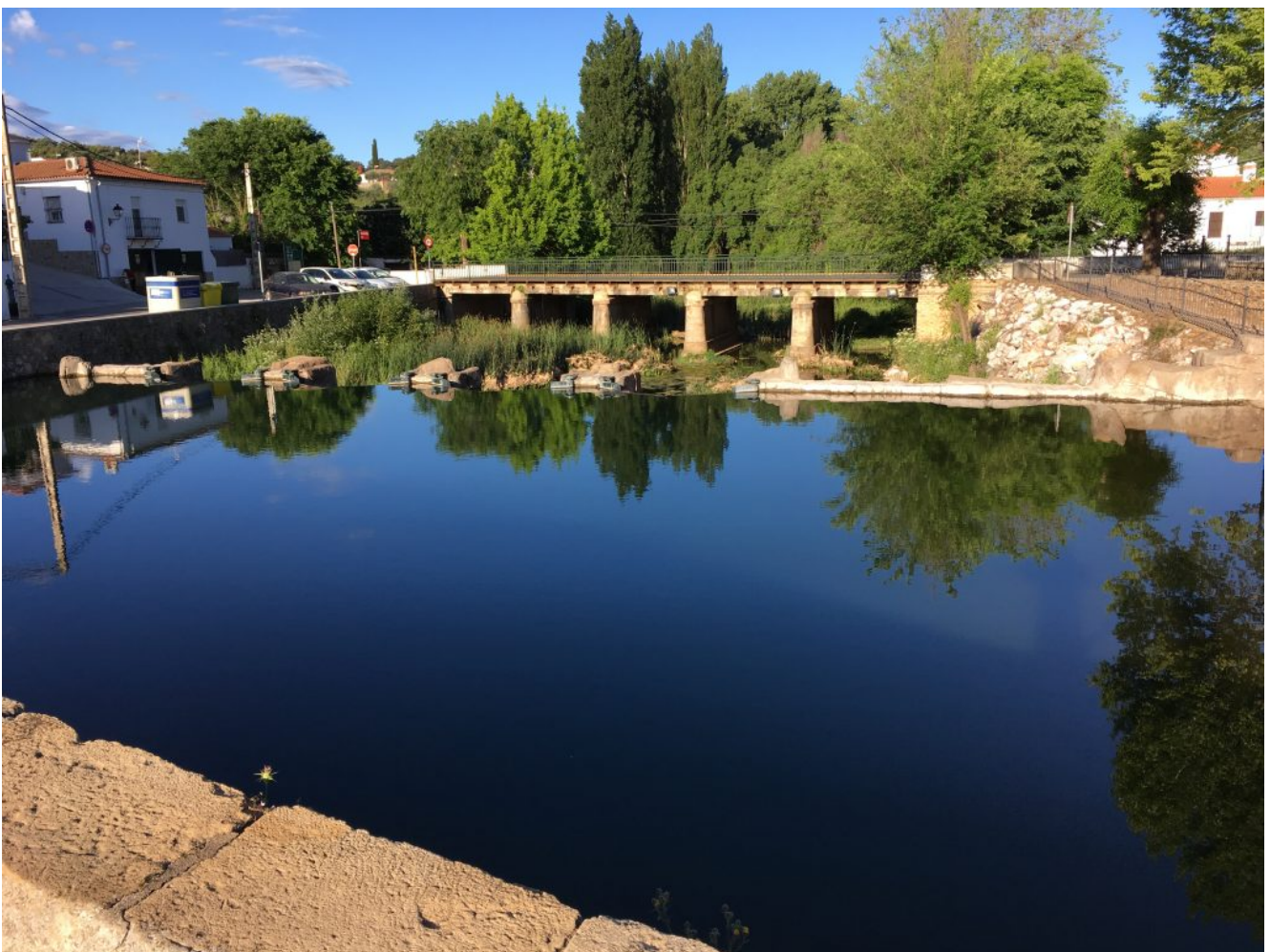
Playa del San Nicolás del Puerto

Después de disfrutar de este capricho de la naturaleza volveremos a San Nicolás del Puerto para comer (quien quiera lo puede hacer con bocadillos o en restaurante), tomar el sol y relajarnos en la Playa Artificial. Aprovechando que estamos en este bello lugar apetece pasar algunas horas de la tarde allí, antes de volver a Sevilla.