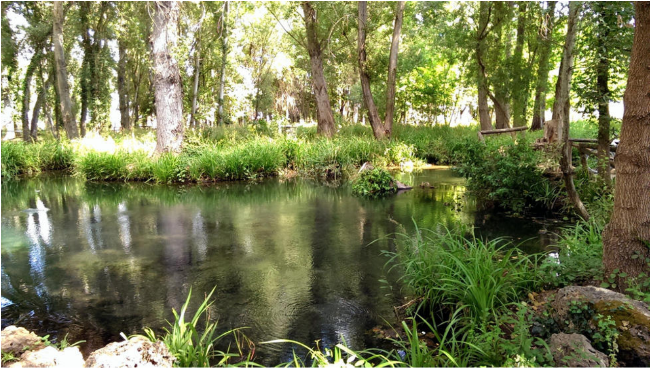
Cascadas del Huéznar

Reiniciamos la marcha por la Vereda de las Moreras hasta llegar al Monumento Natural de las Cascadas del Huéznar , la estrella de nuestra excursión .