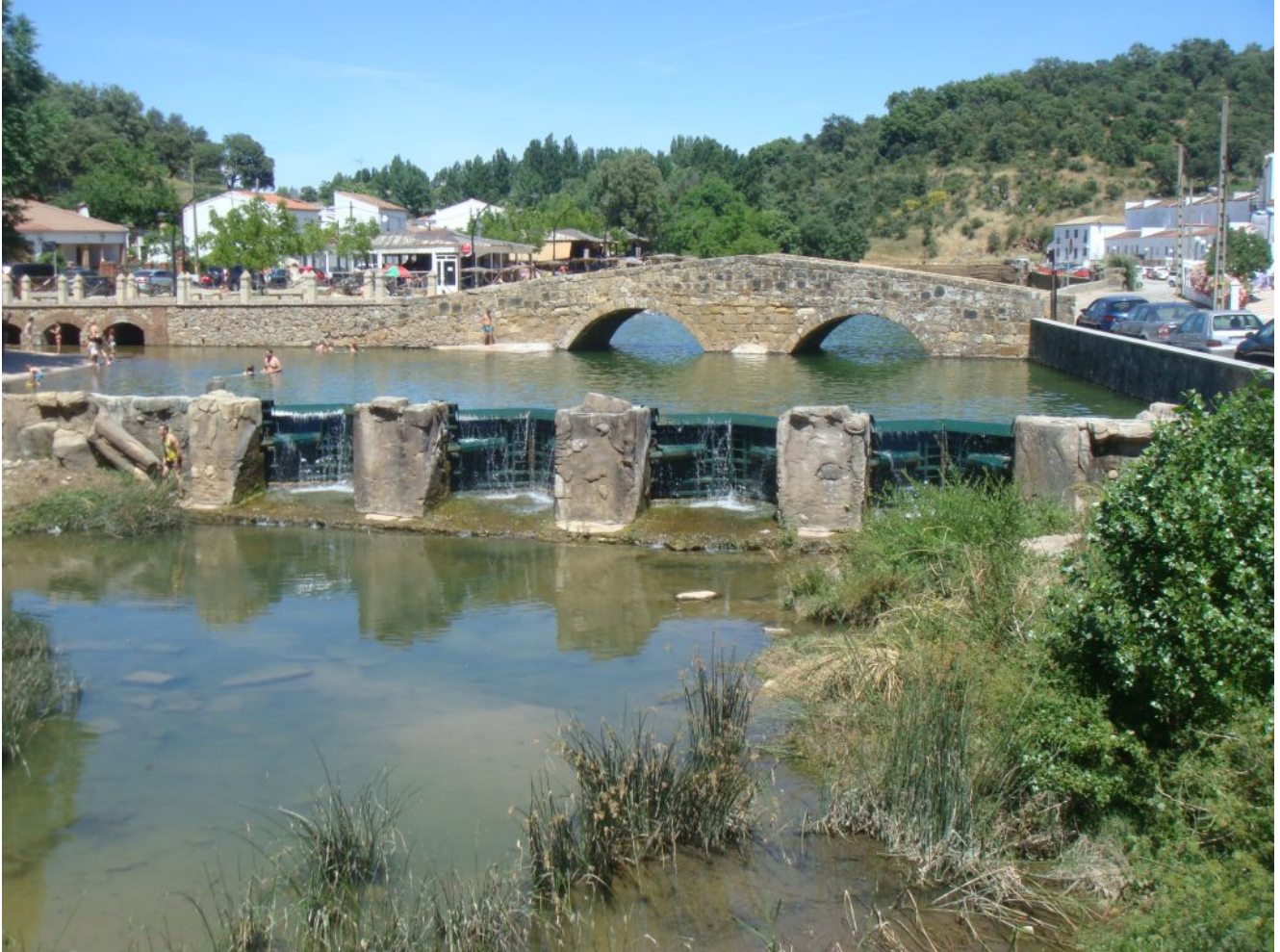
San Nicolás del Puerto[/caption]

Las recogidas en Sevilla son: 8.00 Gran Plaza, a las 8.15 en Plaza Antonio Martelo y a las 8.30 en la Cervecería Ronda el Alamillo (hace parada para desayunar) Quedaremos con los que vienen en coche a las de a las 11 horas en el Restaurante Atarazana, ubicado junto a la Playa Artificial de San Nicolás del Puerto y cuyas coordenadas gps son 37.996529, -5.653015.