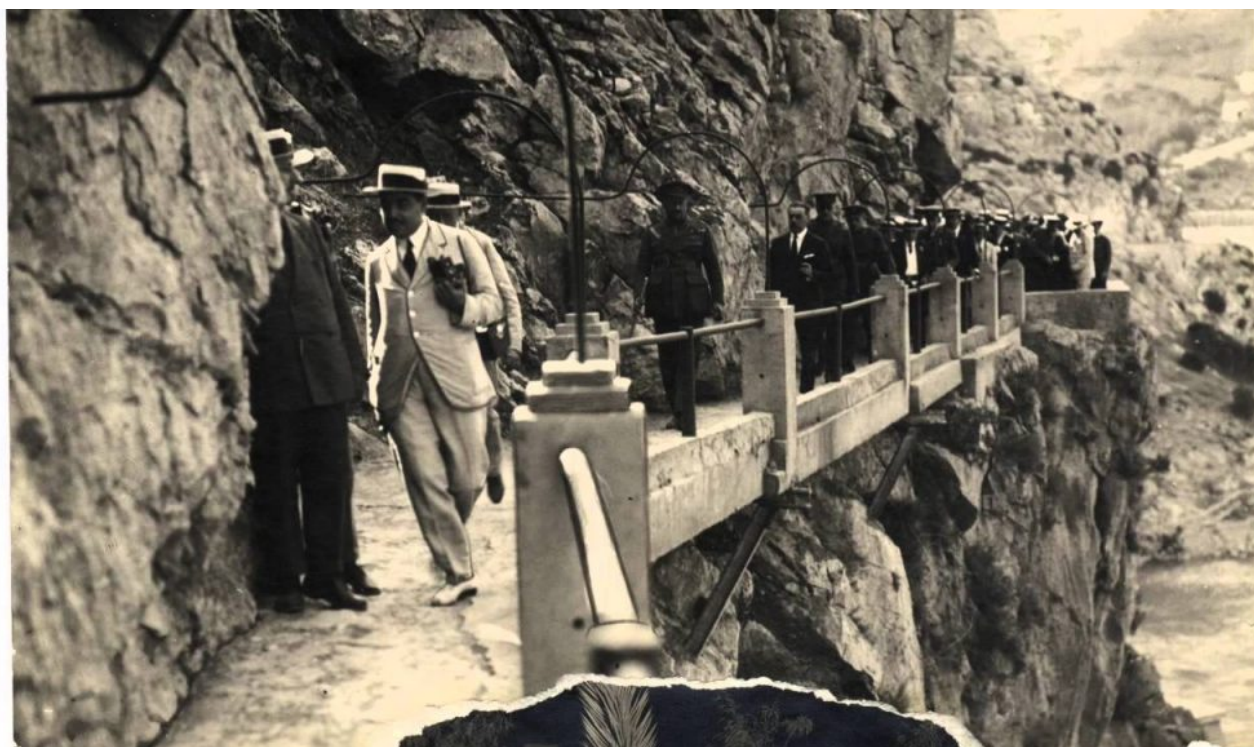
Imagen antigua del Caminito del Rey

Primero vamos a hacer un poco de historia sobre el Caminito del Rey : Este sendero se construyó porque la Sociedad Hidroeléctrica del Chorro, propietaria del Salto del Gaitanejo y del Salto del Chorro, necesitaba un acceso entre ambos “saltos de agua” para facilitar tanto el paso de los operarios de mantenimiento como el transporte de materiales y la vigilancia de los mismos.