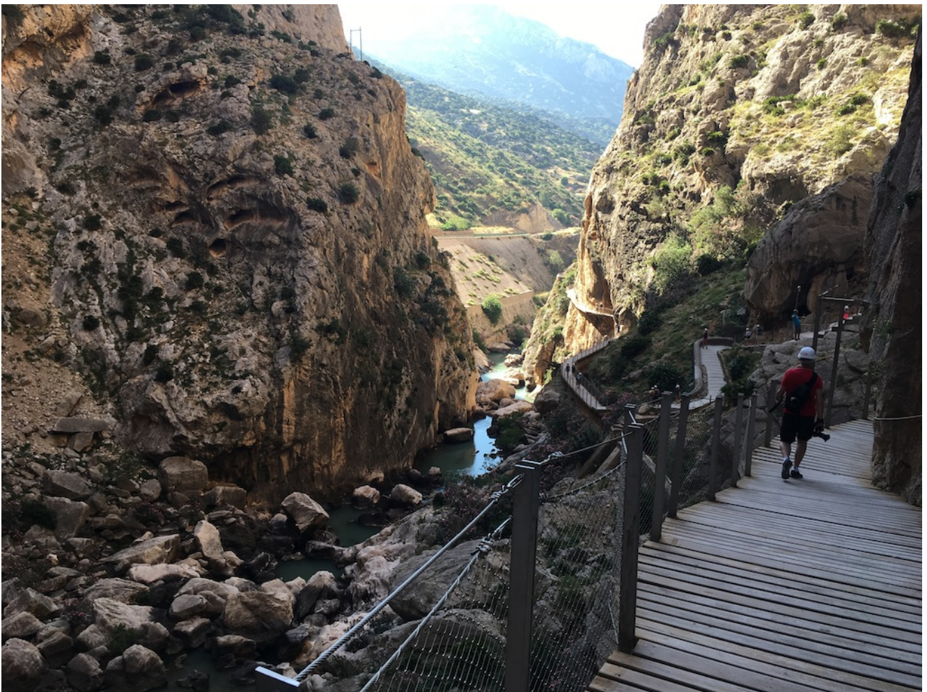
Bella estampa del Caminito del Rey

Nivel uno – El domingo 24 de noviembre de 2024 Senderismo Sevilla Viajes presenta la excursión al Caminito del Rey. Es una excursión catalogada como fácil o nivel uno y que tiene unos 10 km de recorrido y 150 metros de desnivel acumulado y es un recorrido en bajada (desde Ardales a Alora). Su dificultad estriba en la adrenalina que produce caminar por sus pasarelas colgadas. Es obligatorio ir en bus desde Sevilla que nos deja en el Pantano del Guadalorce de Ardales y tras una aproximación entramos en el Caminito del Rey. Después nos recoge en la parte de Alora y nos lleva a comer al Restaurante Carrión de ese pueblo una muy succulenta comida (incluido en el precio de 64€).