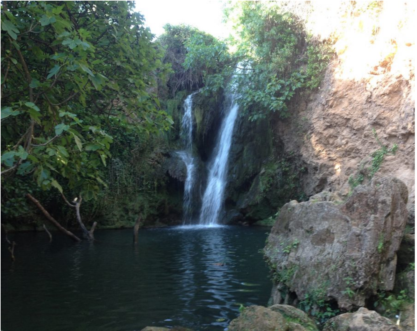
Cascadas del Huéznar