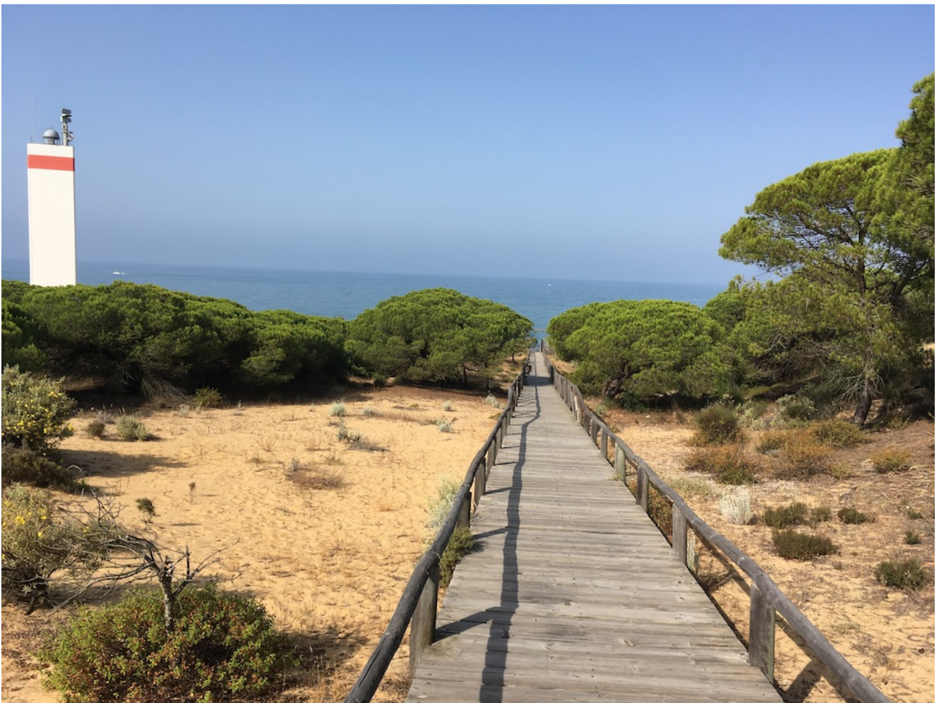
Parque Dunar Matalascañas

Nivel uno: Senderismo Consciente – Miércoles 24 de abril de 2024- La excursión del Parque Dunar en Matalascañas es una ruta fácil y especialmente dedicada a practicar senderismo consciente y meditación en la arena. Es un recorrido circular muy sencillo junto al mar, de unos 5 kilómetros en el que se pueden contemplar diferentes especies de animales lo que tiene un atractivo especial para ellos. Pondremos transporte desde Sevilla y se puede llegar en coches particulares.