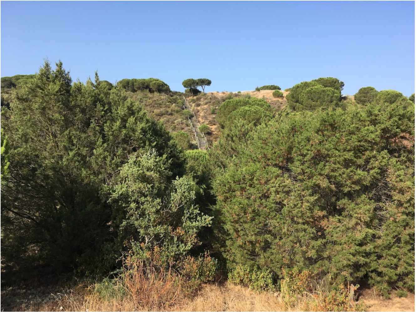
Pasarela Parque Dunar