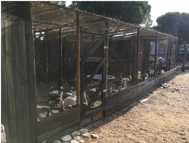
■ Gansos Parque Dunar