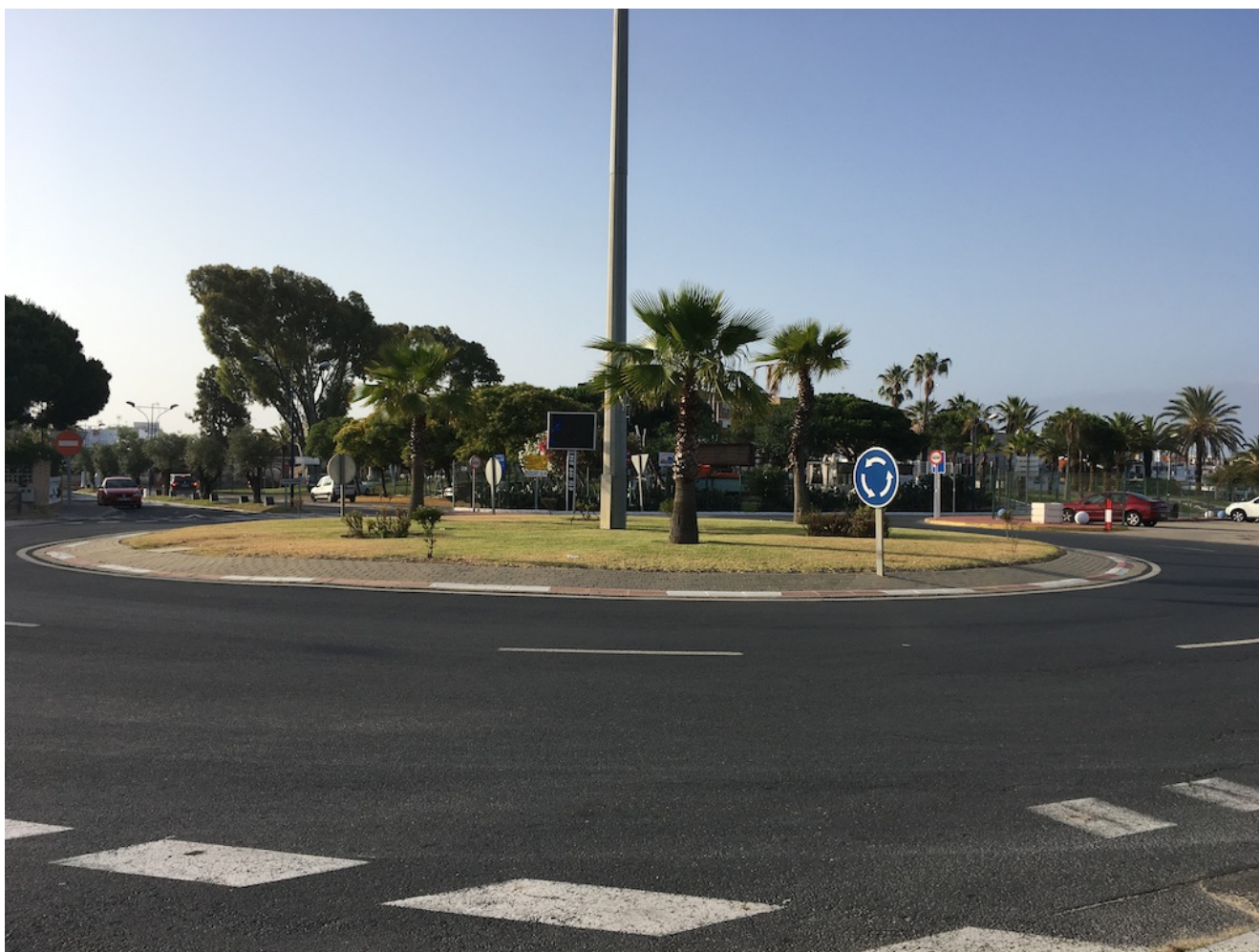
Rotonda entrada Matalascañas

de metro), 8.15 José Laguillo (frente al Hotel Catalonia Santa Justa) y 8.30 Cervecería Ronda el Alamillo. Recomendamos llegar antes de la hora porque el bus sólo espera 5 minutos de cortesía como máximo. Pararemos a desayunar por el camino. Volveremos saliendo sobre las 17 horas de Matalascañas después de tener un par de horas libres para comer por el pueblo e ir al playa quien lo desee. Para los que vienen en coche 10.30 horas en Restaurante Casa Matias en la rotonda de entrada de Matalascañas que es la entrada al Parque Dunar cuya imagen vemos debajo de estas líneas y cuyas coordenadas GPS son 37.010759, -6.564253