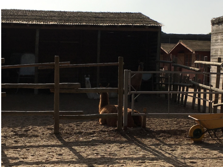
■ Llamas Parque Dunar