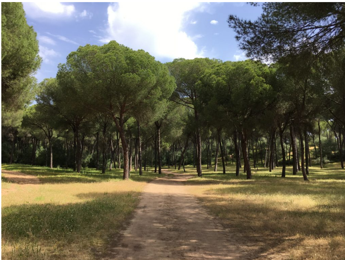
Pinares de Aznałcazar