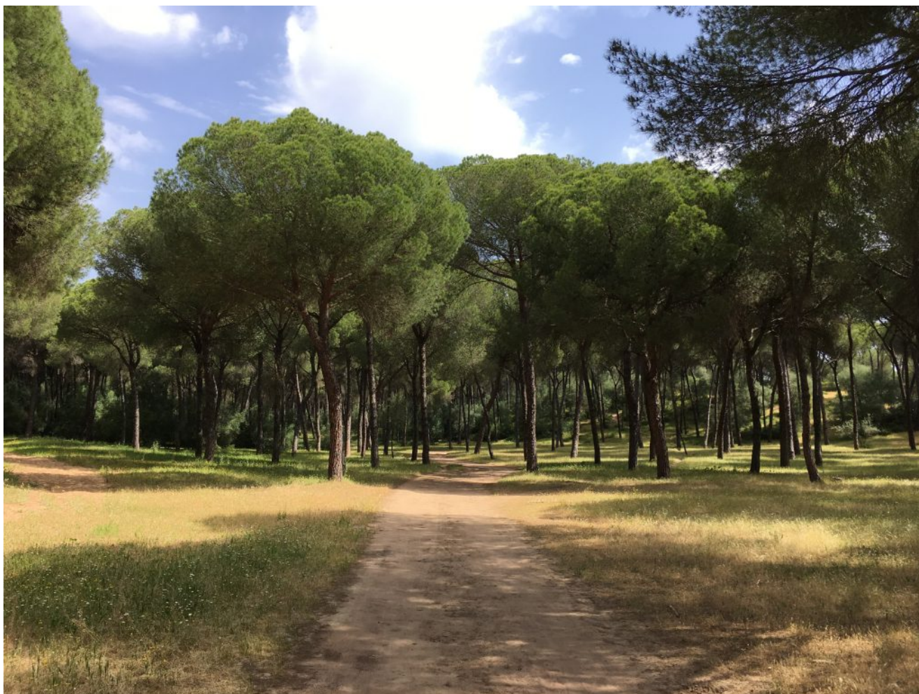
Pinares de Aznalcazar