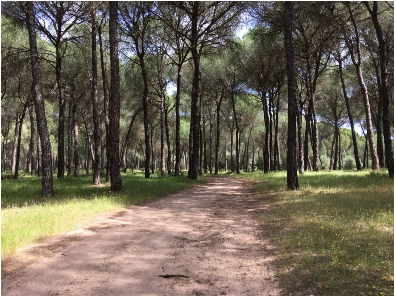
Camino entre pinares

Para el autobús quedaremos en nuestras habituales paradas: 8:00 Gran Plaza, 8.15 José Laguillo y 8.30 Cervecería Ronda el Alamillo y pararemos a desayunar. Para los que vienen en coche quedaremos a las 9.30 en un pequeño parking que hay en la carretera SE 3302 que va de La Puebla del Río a Aznalcazar. Está justo cuando empiezan los pinares por esta parte (Coordenadas 37.231283, -6.165430). Fijaros bien en la imagen para no confundirlo con que hay más adelante cerca de la Dehesa de Abajo.