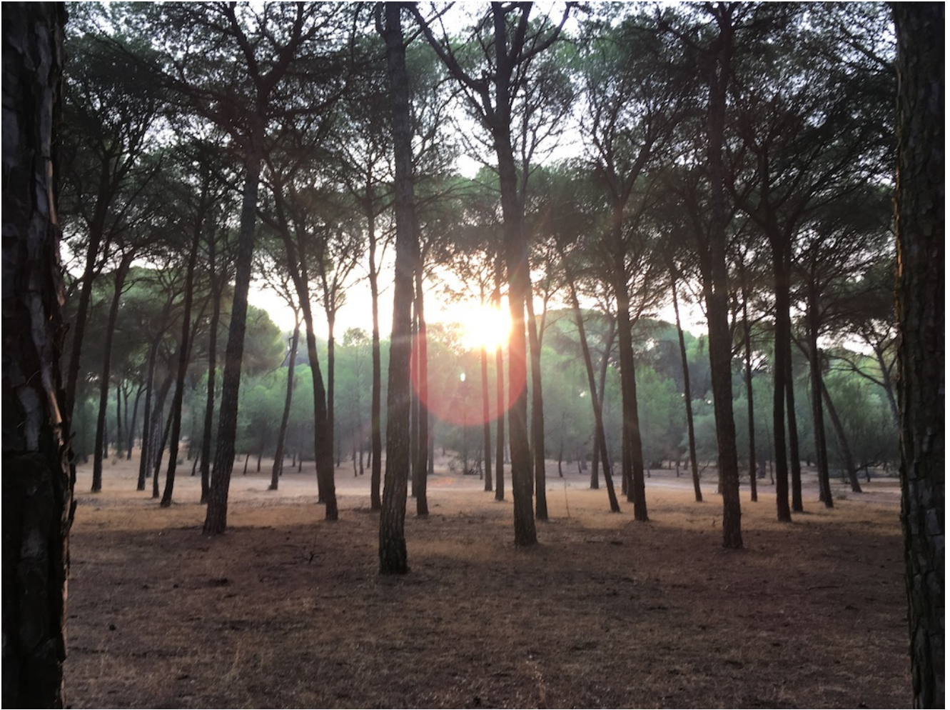
Bosque de pinos