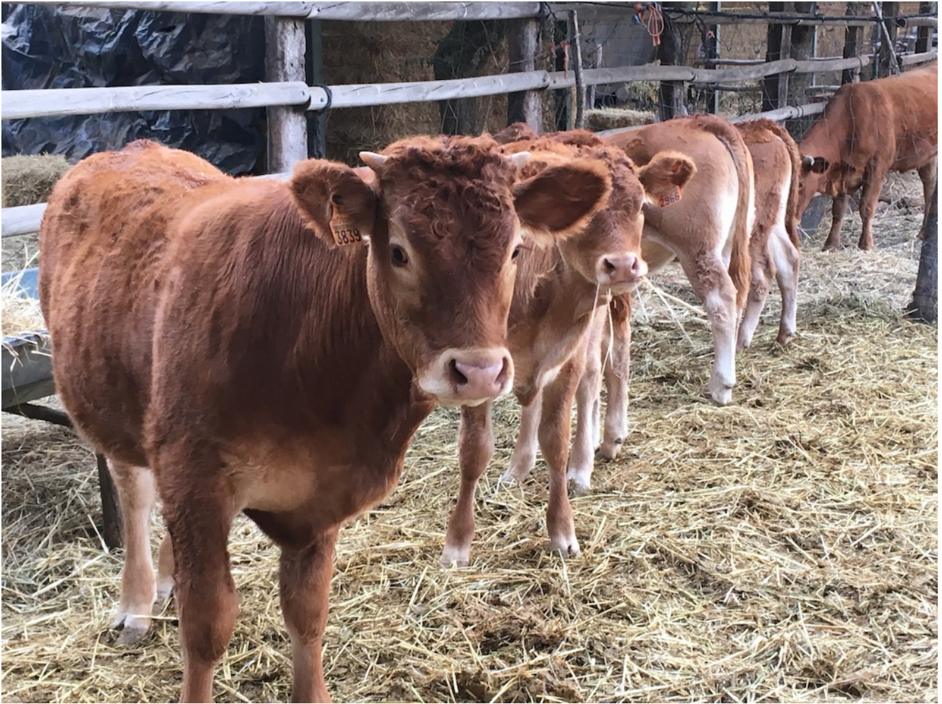
Ganado vacuno pastando

Sobre las 12.30 llegaremos primero al arrozal y luego a la laguna para posteriormente llevar a cabo una actividad de avistamiento e interpretación de aves en la laguna de la Dehesa de Abajo. Luego el que quiera podrá ir a comer al restaurante (por su cuenta) o hacerlo con nosotros con bocadillos. Avisamos que quien vaya en coche tendrá que pagar 2€ para poder utilizar el parking de la Dehesa de Abajo.