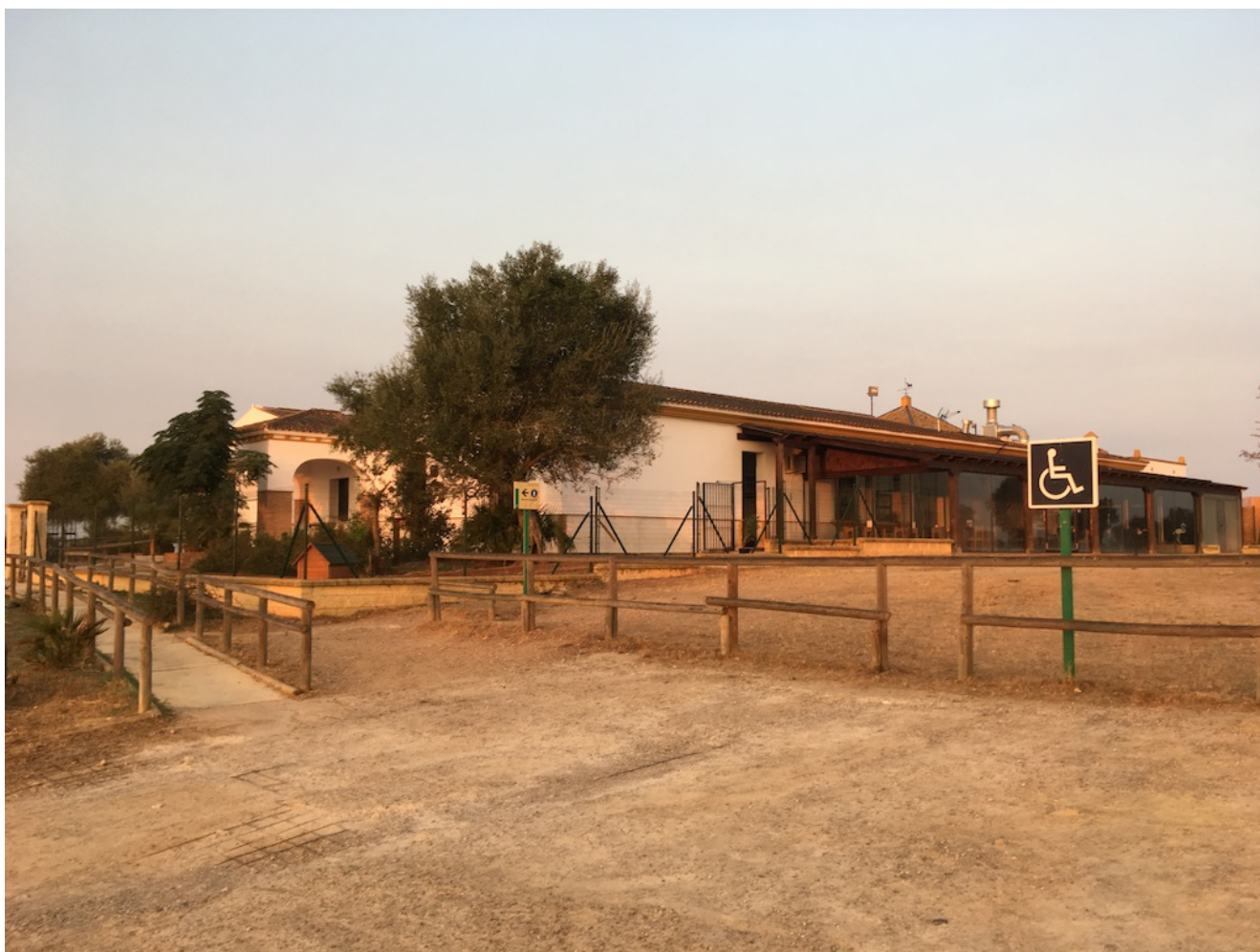
Caserio la Dehesa de Abajo

ecológica , tanto en flora como en fauna. Entre la flora destaca el lentisco, la jara, el almoradux, el cantueso, la esparraguera o el romero, además de los acebuches, encinas y piños piñoneros. Y en cuanto a la fauna el milano negro, el milano real, el alcotán, el águila culebrera, así como el lince ibérico, el zorro , el meloncillo, el tejón y la gineta.