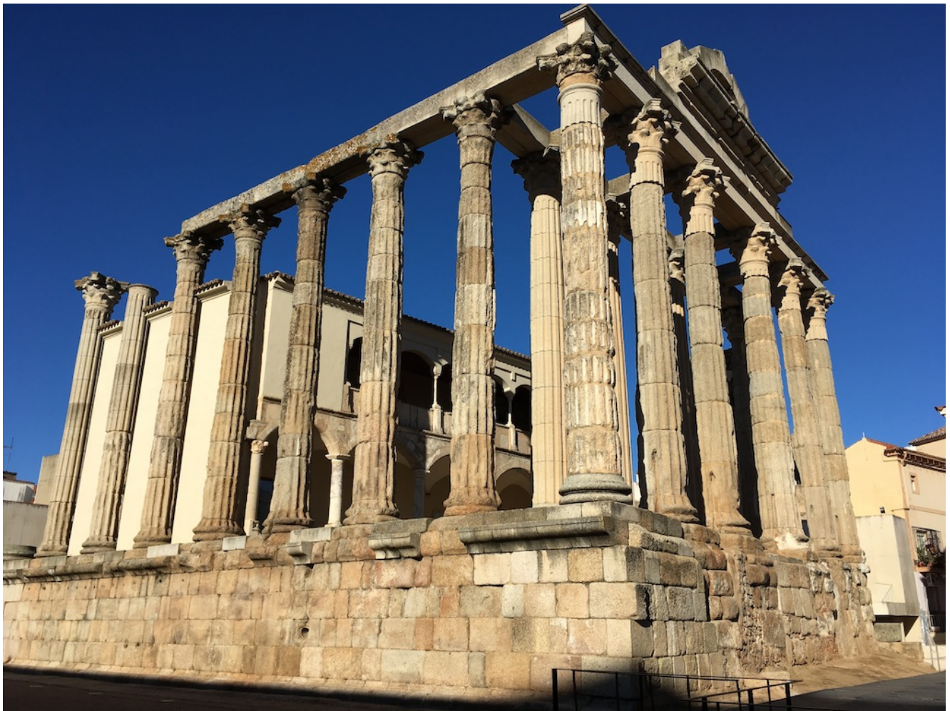
Templo de Diana

recorreremos y conoceremos en esta jornada: la presa de Proserpina, los acueductos, el Teatro y el Anfiteatro, la Casa de Mitreo y el Area Funeraria de las Columbarios, el Arco de Trajano, el Templo de Diana, el Puente sobre el Guadiana, la Cripta Arqueológica de Santa Eulalia, Area Arqueológica de la Moreria y el Circo Romano . Una experiencia inolvidable.